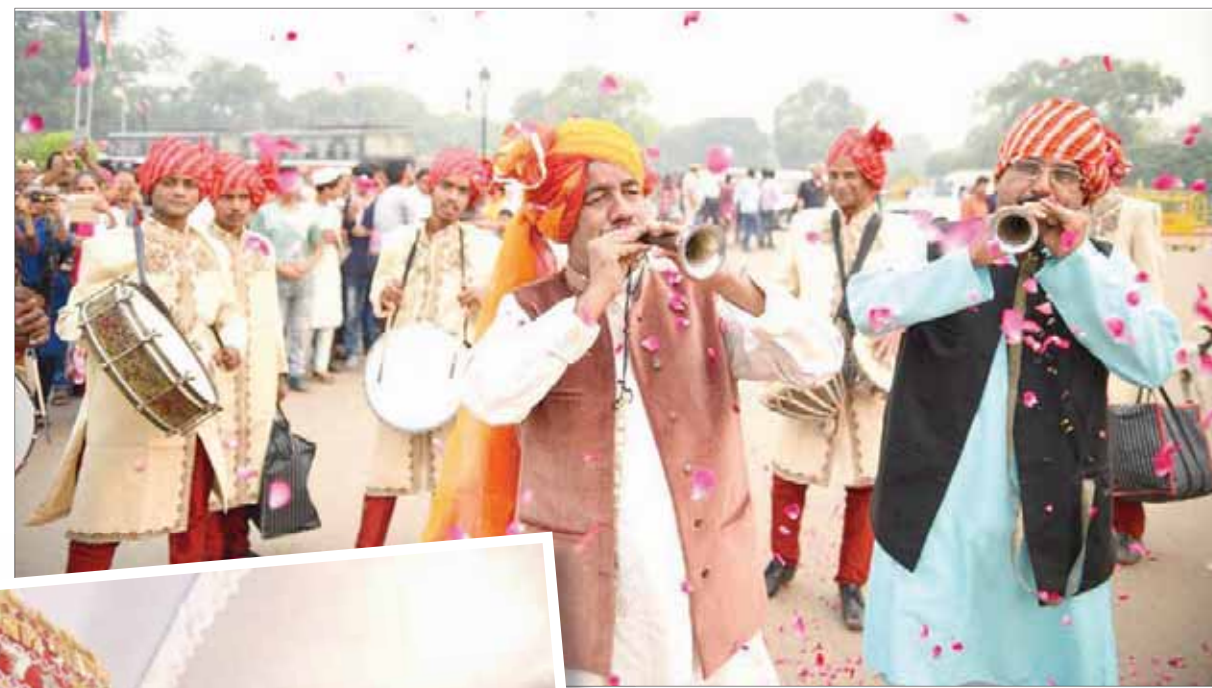
موسيقيون يعزفون المزمارة والشيناي في موكب الزهور

وتعهدت الأميرة بإنشاء مثلث مرارح يدوية ضخمة مصنوعة من أوراق النخيل ومزينة برفقات لامعة وزهور، راقصو فلكلور، موسيقيون يعزفون المزمارة والشيناي مرتدين أثواباً موشاة بالألوان الزاهية، يقودون موكب الزهور الذي يعود إلى عصر المغول منذ 200 عام، يُعرف باسم «موكب باعة الزهور». كل هذه الأشياء موجودة في شوارع العاصمة الهندية دلهي حالياً.