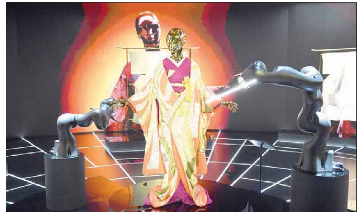
روبيوت برتدي «كيمونو» خلال معرض في طوكيو يضم مجموعة من 13 روبوتاً ترتدي «كيمونو» من تنفيذ حرفيين يابانيين يطلق عليهم اسم «الكنوز الوطنية الأحياء» لخبرتهم في هذا المجال

كانت شركة «فورود موتور كورب» الأميركية لصناعة السيارات قد طرحت في وقت سابق من العام الحالي رؤية مختلفة لاستخدام الطائرات من دون طيار في توصيل الطلبات للمنازل. وبدلاً من الطريقة التي تستخدمها «مرسيدس» حيث تبدأ الطائرة من دون طيار نصف الرحلة، التي تكمل السيارة نصفها الثاني، فإن «فور» لديها فكرة عكسية، حيث تنقل السيارة الشحنة إلى العنوان المطلوب، ثم تتولى طائرة من دون طيار حمل الشحنة إلى سقف المنزل وإسقاطها هناك.