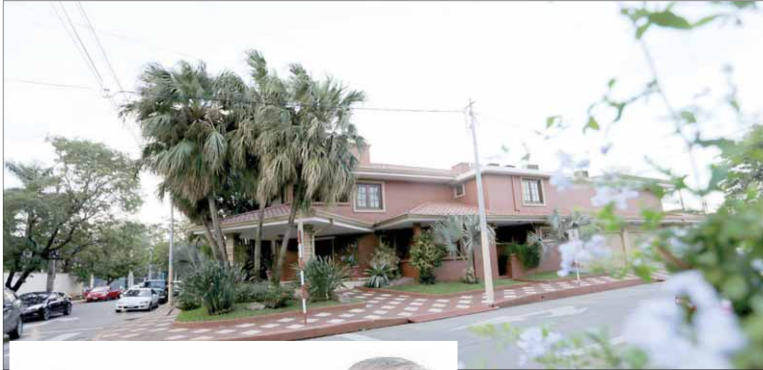
نيكولاس ليون يخضع حالياً للإقامة الجبرية في منزله بأسونسيون عاصمة باراغواي

خلال السنوات الخمس المقبلة، والتي سيكشف خلالها الكثير من المعلومات حول قضايا الفساد التي هزت كرة القدم العالمية خلال السنوات الأخيرة. واستأنف فريق الدفاع الخاص بالرئيس السابق للاتحاد أميركا الجنوبية لكرة القدم «كونميبول»، الباراغواياني نيكولاس ليون، ضد قرار تسليم الأخير للولايات المتحدة الأميركية، والذي أصدره القضاء في باراغواي قبل عشرة أيام. وقال المحامي ريكاردو بريدا، أحد أعضاء فريق الدفاع الخاص بليون، إن قرار المحكمة بتسليم موكله افتقد للأساس القانوني الصحيح. وقال بريدا في تصريحات لوسائل الإعلام في باراغواي: «طالبنا بإلغاء القرار ورفض طلب التسليم». ومن المتوقع أن يؤخر هذا الاستئناف إجراءات تسليم ليون، الذي ترأس «كونميبول» في الفترة ما بين عامي 1986 و2013، إلى الولايات المتحدة الأميركية. وفي عام 2013 استقال ليون من منصبه بشكل مفاجئ، في الوقت الذي كانت تشهد فيه باراغواي تغييرات سياسية كبيرة بوصول هوراسيو كورتيس، الرئيس الحالي للبلاد، إلى سدة الحكم. ومع حلول منتصف عام 2015 تفجرت فضيحة الاحتراف الدولي لكرة القدم، والمعروفة باسم «فيفا جيت»، والتي زجت بالعشرات من قيادات الكرة العالمية في السجون، وأخضعت بعضهم للإقامة الجبرية في منازلهم وأحالت آخرين للمحاكمة أمام القضاء الأميركي.