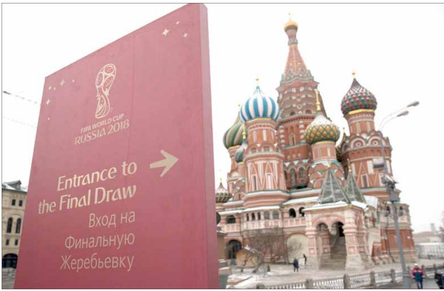
أنتظار الملايين تتجه اليوم صوب قصر الكرملين لتابعة فعاليات إجراء قرعة مونديال 2018 (أ.ب)

ويجد المنتخب السعودي نفسه أمام 3 سيناريوهات قبل قرعة المونديال... الأول السيناريو الأصعب ثم المتوسط فالأسهل. السيناريو الأصعب للمنتخب السعودي هو الوقوع في مجموعة تضم البرازيل وإسبانيا وأيسلندا، وفي هذه الحالة سيكون من الصعب التاهل للدور الثاني. فيما سيكون السيناريو متوسط الصعوبة هو المشاركة في مجموعة تضم منتخبات بولندا وكولومبيا أو المكسيك، ومصر أو كوستاريكا حيث قد يتمكن المنتخب السعودي من التاهل للدور الثاني. أما السيناريو الأسهل للمنتخب السعودي، فهو الوقوع في مجموعة تضم منتخبات روسيا وكولومبيا أو المكسيك ومصر أو كوستاريكا.