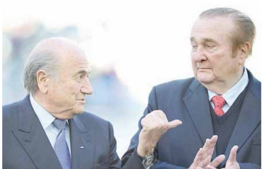
ليون وبلاتر وحيد لا يخلو من راحة فساد

وثمة تحديث آخر في هذا الأمر وهو أنه من بين 25 مديراً تنفيذياً في الاتحاد الدولي لكرة القدم الذين شاركوا في التصويت لقطر وروسيا نجد أن 13 منهم إما منعوا من ممارسة أي نشاط متعلق بكرة القدم أو اعتبروا