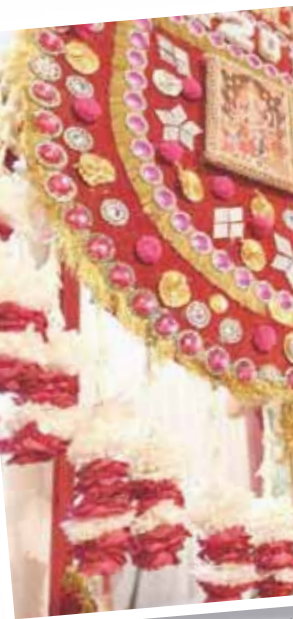
جانب من احتفالات مهرجان الزهور في دلهي

وبالتالي، إن ما بدأ على هيئة زيارة أم ملكة مسلمة إلى ضريح رجل دين مسلم أصبح على مر القرون مناسبة للاحتفال للمدينة بأسرها، متجاوزة الحواجز المجتمعية والطبقية.