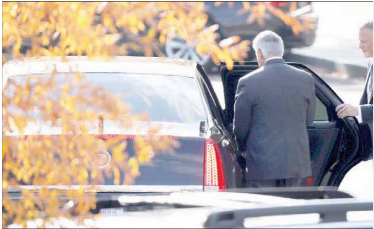
وزير الخارجية الأميركي يغادر البيت الأبيض بعد اجتماعه مع ترمب أمس (رويترز)

أي خبرة في العمل السياسي أو العمل الحكومي. وراهن ترمب الذي لم يكن لديه أيضاً أي خبرة سياسية أو حكومية على أن تيلرسون سيكون قادراً على ترجمة مهاراته الهائلة في عالم الشركات والنفط و«البيزنس» إلى الدبلوماسية الدولية بعد 41 عاماً أمضاها داخل شركة «إكسون موبيل» متسلقاً السلم الوظيفي حتى قمته. ويبدو أن بيكس تيلرسون كان يتجه اتجاهاً آخر مخالفاً لتوقعات الرئيس ترمب حيث أمضى الكثير من وقته في إعادة تنظيم وزارة الخارجية من الداخل وخفض ميزانيتها والاستغناء عن أكثر من ألفي موظف. وقد ظهرت التخباينات في مواقف وتصريحات كل من الرئيس ترمب من جانب ووزير الخارجية تيلرسون من جانب آخر، وبدت واضحة في موافق تتعلق بالاتفاق النووي الإيراني وخيفية مواجهة تهديدات كوريا الشمالية. وكان رحيل تيلرسون متوقعا على نطاق واسع لعدة أشهر، وفي حال خروجه خلال عدة أسابيع فإنه سيكون الوزير الذي أمضى أقصر فترة في منصبه، حيث قضى عاماً واحداً فقط في منصبه مقارنة بجميع وزراء الخارجية السابقين على مدى 120 عاماً.