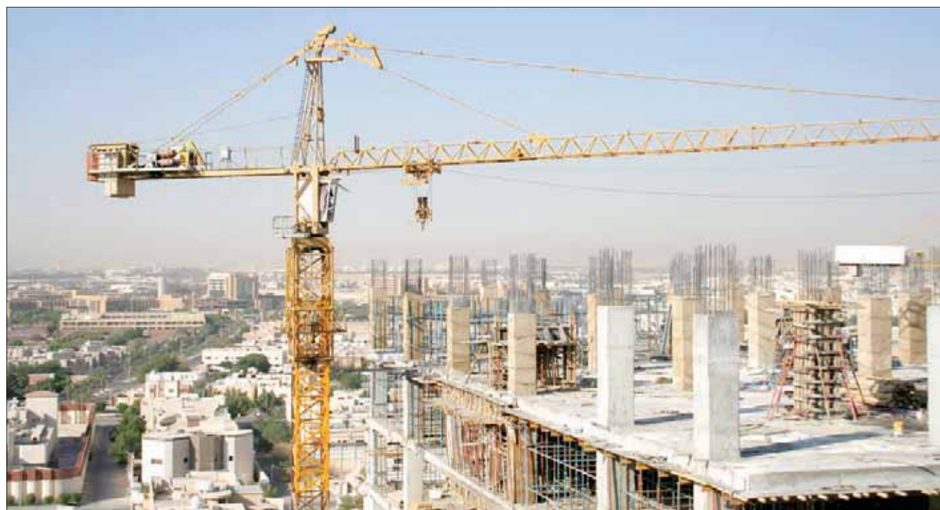
الرياض، فتح الرحمن يوسف

التقديرية الإجمالية للاستثمارات المنتشرة في هذا القطاع.