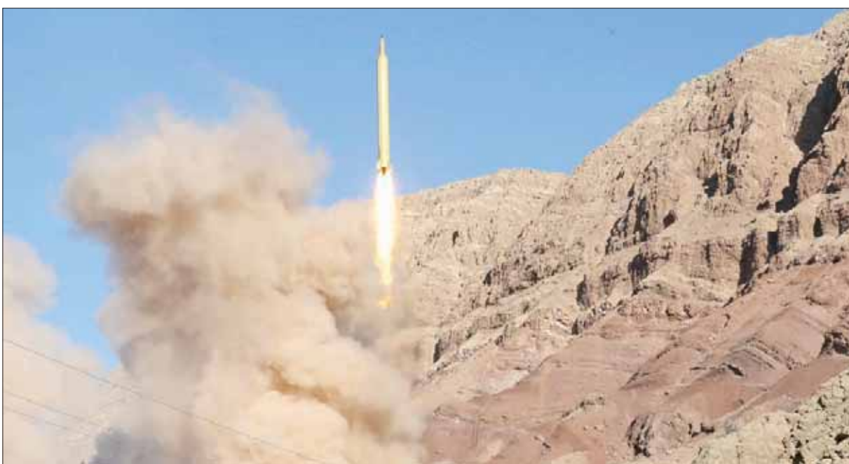
صورة أرشيفية لعملية إطلاق الصاروخ الإيراني الباليستي «قادر» العام الماضي

مع بلدان الخليج قلقاً مزدوجاً من تسارع تطوير إيران لترسانتها الصاروخية ولما تعتبره سياسة «عدوانية» وانزعة للهيمنة» بحسب ما جاء في تصريحات وزير خارجيتها وعلى لسان ماكرون نفسه. وأشارت المصادر الفرنسية لـ«الشرق الأوسط» إلى أن منبع