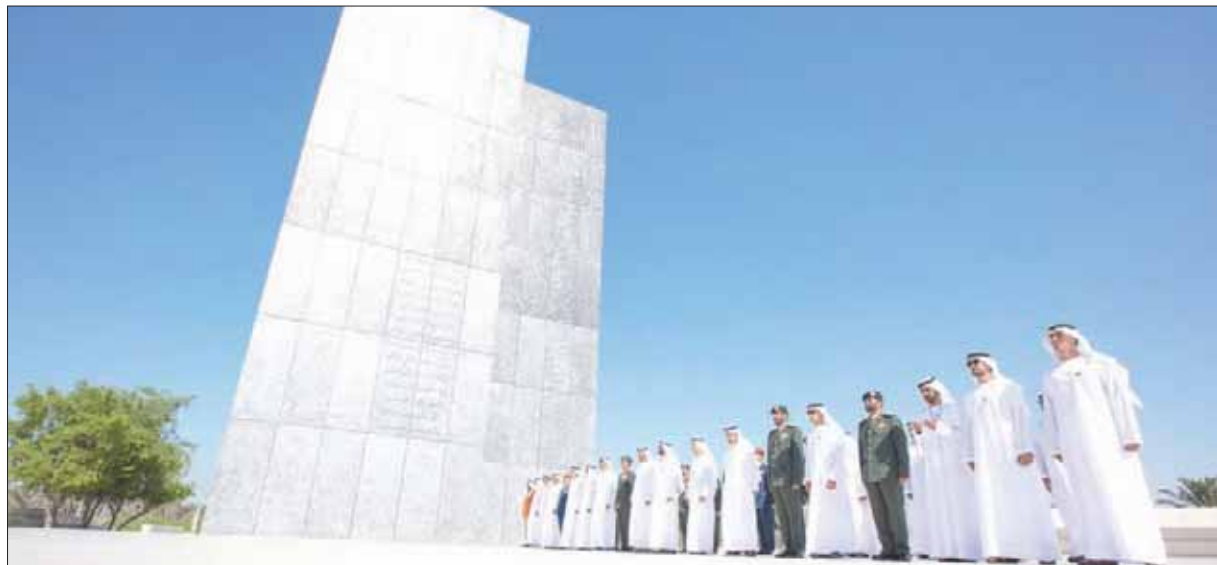
دقيقة صمت وقفاً عدد من المسؤولين في الإمارات في واحة الكرامة بالعاصمة الإماراتية

إنما هو بفضل تضحيات شهدائنا ويحطولاتهم وتضحياتهم، هم لم يغادرونا بل سيظلون يسكنون في ذاكرة كل بيت وكل بقعة في أرضنا الخيرية». وأضاف الشيخ محمد بن زايد آل نهيان: «نقف وهاماننا شامخة بتضحيات شهدائنا البررة، نستذكر مآثرهم وأعمالهم وما سطرته أفعالهم البطولية من معان سامية باقية تمد الأجيال بالخير، وتدفعهم إلى الحفاظ على إرث الشهداء والوفاء له والعمل به».