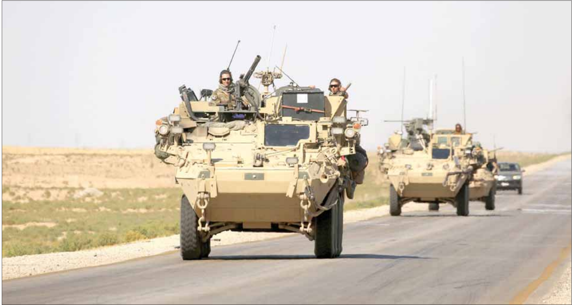
صورة أرشيفية لقوات أميركية في ريف الرقة شمال شرق سوريا

جوية للتحالف، على صعيد آخر، قال: «المركز السوري لحقوق الإنسان» إن «داعش» نفذ عمليات إعدام طالت نحو 15 شخصاً من عناصر قوات النظام والمسلحين المواليين لها في إصدار جديد نشره التنظيم، إذ «جاء هذا الإصدار في محاولة لرفع معنويات جمهور التنظيم المناصر له، بعد أن خسر التنظيم وجوده بشكل شبه كامل في الأراضي السورية، وتحول من تنظيم يسيطر على أكثر من نصف مساحة سوريا، إلى تنظيم يدافع عن وجوده في آخر 3 في المائة فقط من الجغرافيا السورية، بمساحة تقدر بنحو 5600 كلم مربع من الأراضي السورية، وتضمن الإصدار 3 دفعات من عمليات الإعدام بحق عناصر سوريين من قوات النظام والمسلحين المواليين لها أحدهم ضابط طيار، وبحق عنصر من المسلحين العراقيين المواليين إلى جانب النظام في البادية السورية».