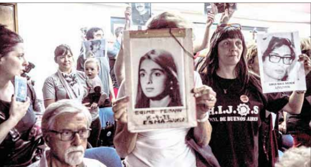
أقارب ضحايا الحقبة الديكتاتورية في الأرجنتين أثناء الانتظار خارج المحكمة (أ.ب)

وليوني دوكيه، اللتان خطفتا وقتلتا مع مؤسسات «الجمعية الإنسانية»، اللاتي يطلق عليهن في الأرجنتين «مهايات ميدان مايو» في ديسمبر (كانون الأول) 1977. ودفن على رفات دوكيه و 3 من مؤسسات الجمعية على سواحل الأرجنتين المطلة على الأطلسي، ودفن في مقبرة مجاورة، فيما لم يعثر على رفات دومون. وحكم على الفريديو إستيز الملقب بـ«ملك الموت الأشقر» وخورخي أكوستا الملقب بـ«النمر» بالسجن مدى الحياة. وهما اللذان توليا عمليات القتل العمد لهؤلاء الضحايا. وهذه ثالث محاكمة تنظر في انتهاكات لحقوق الإنسان في «المدارس البحرية الميكانيكية»، وقدم نحو 800 شخص شهادتهم في المحكمة. ومنذ انطلاق الجلسات في نوفمبر (تشرين الثاني) 2011، توفي