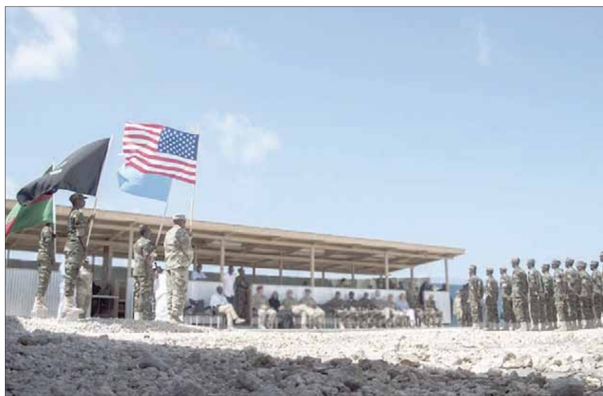
صورة وزعتها «أفريكوم» لقوات أميركية تدرب جنوباً صوماليين في مقديشو

الصومال. وقالت وكالة الأنباء الصومالية إن قوات الأمن التي وصلت إلى المكان، قامت بعمليات التمشيط بحثاً عن الجناة. إلى ذلك، جددت وزارة الداخلية الصومالية الإجراءات الأمنية التي اتخذت منتصف العام الجاري، بشأن تحديد الحراس المسؤولين الحكوميين وأسلحتهم. وقال وزير الداخلية محمد ابوكر اسلو في مؤتمر صحفي في مقديشو، إن وزارته «تأمر جميع الجهات المعنية بالالتزام التام بالبنود الصادرة عن الحكومة حول مهمة تعزيز أمن العاصمة». ودعا المسؤولين إلى التقيد بمرافقة أربعة حراس فقط. وكان رئيس الحكومة حسن علي خيري قد تفقد في ساعة متأخرة من مساء أول من أمس، نقاط التفتيش التي توجد فيها عناصر الأمن المكلفة بأمن مقديشو، وأشاد بأجهزة الأمن والشرطة التي لا تالو جهداً في «تصفية الخليا الإرهابية»، على حد تعبيره.