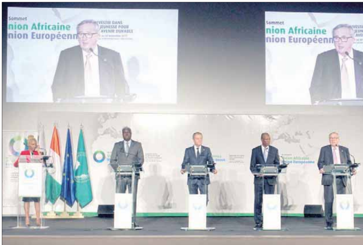
جانب من المؤتمر الصحفي في ختام قمة أبيدجان أمس

تفرض نفسها بالحاح شديد، وتقتضي تفعيلها على أربعة أصعدة: وطنيا وإقليميا وقاريا ودوليا. كما دعا الملك محمد السادس أيضا إلى تصحيح أربع مغالطات، هي أن الهجرة الأفريقية لا تتم بين القارات في غالب الأحيان (من أصل 5 أفارقة مهاجرين 4 منهم يقعون في أفريقيا)، وأن الهجرة غير الشرعية لا تشكل النسبة الكبرى، إذ تمثل 20 في المائة فقط من الحجم الإجمالي للهجرة الدولية، وأن الهجرة لا تسبب الفقر لدول الاستقبال (85 في المائة من عائلات المهاجرين تصرف داخل هذه الدول)، وأخيرا وهو أن التمييز بين بلدان الهجرة وبلدان العبور وبلدان الاستقبال لم يعد قائما. وأشار الملك محمد السادس إلى أن الدول الأفريقية مطالبة بالنهوض بمسؤولياتها في ضمان حقوق المهاجرين الأفارقة، وحفظ كرامتهم على أراضيهم، وفقا لالتزاماتها الدولية، ويعيدا عن الممارسات المخجلة واللاإنسانية الموروثة عن حقبة تاريخية عفا عنها الزمن، مؤكدا ضرورة «وضع تصور جديد لمسألة الهجرة، من خلال التعاون معها كموضوع قابل للنقاش الهادئ والرصين، وكحافز على الحوار البناء والمثمر». وأكد الملك محمد السادس أن دول المنطقة كانت ستكون أكثر قوة في مواجهة تحدي الهجرة، لو كان الاتحاد المغربي موجودا حقا، مشيرا إلى أن ساعة العمل قد دقت، وأنه «ينبغي العمل على تطوير السياسة الأوروبية في هذا المجال» في سياق ذلك، دعا العاهل