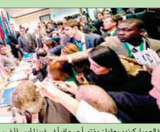
الفالاح وباركيندو يعقدان مؤتمراً صحافياً في فيينا أمس

فيينا: وائل مهدي اتفقت منظمة «أوبك» وحلفاؤها المنتجون للنفط خارج المنظمة، وفي مقدمتهم روسيا، أمس، على تمديد تخفيضات إنتاج النفط حتى نهاية عام 2018، لكنهم أشاروا إلى خروج محتمل من الاتفاق قبل ذلك الموعد إذا حدث صعود حاد للأسعار. وينتهي أجل الاتفاق الحالي للمنتجين، الذي بموجبه يخفضون الإمدادات نحو 1,8 مليون برميل يوميا في مسعى لدعم الأسعار، في مارس (آذار) المقبل. وتم التوصل إلى الاتفاق بعد ساعات من المناقشات في مقر «أوبك» بفيينا. وأرب وزير