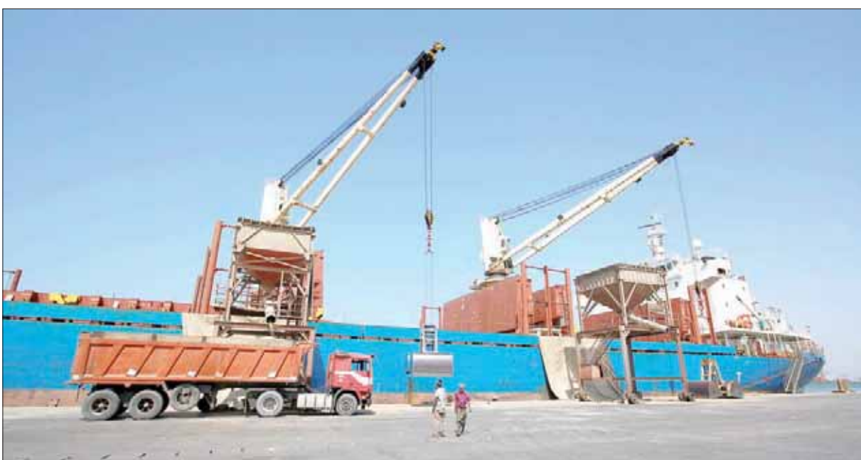
جانب من ميناء الحديد

بأن تقرير «أوتشا» ذكر أن قدرة ميناء عدن الاستيعابية الإجمالية لا تتجاوز لـ230 ألف طن متري منها 50 ألف طن متري للوقود و80 ألف طن متري للمواد الغذائية و100 ألف طن متري لغير المواد الغذائية، وقال: «ذلك مناف للحقيقة تماماً»، وأضافت: «حاول في بلاغه تقدير الاحتياجات المطلوبة للإغاثة بشكل مبالغ جداً، ليجر بان ميناء عدن غير قادر لتلبية احتياجات الإغاثة أو استيعاب مستوردات اليمن التجارية الأخرى، وحاول أيضاً أن