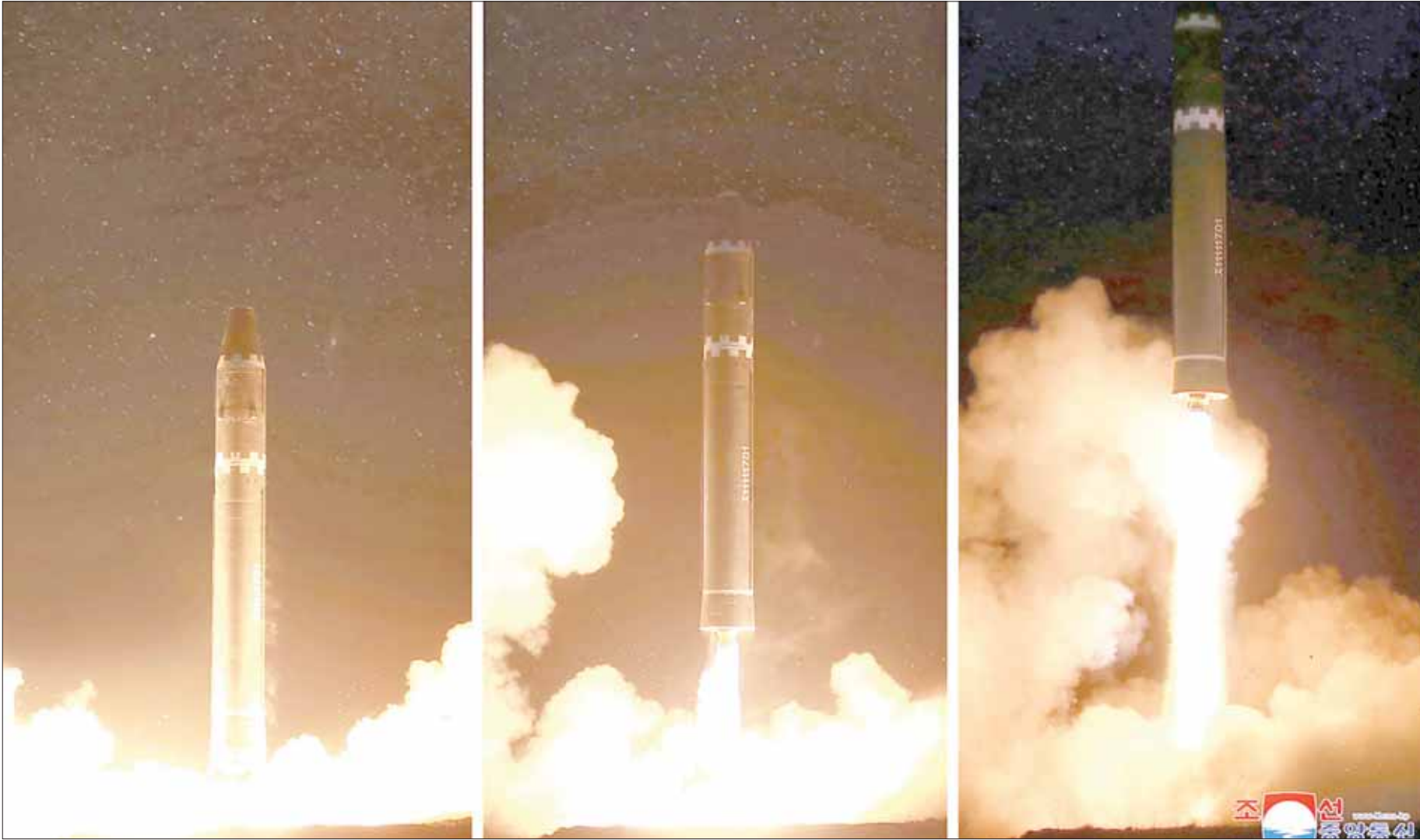
باريس: «الشرق الأوسط»

بحسب تقديرات أولية للبينتاغون قطع الصاروخ الكوري الشمالي الأخير مسافة ألف كلم تقريبا قبل أن يسقط في البحر في المنطقة الاقتصادية البحرية الحصرية لليابان. لكن تحليل الصاروخ في مسار عمودي يحمل على الاعتقاد بأن مداه يتعدى 13 ألف كلم، بحسب ديفيد رايت المدير المشارك في «اتحاد العلماء المهتمين». وقال رايت، كما نقلت عنه الصحافة الفرنسية، أن صاروخا كهذا سيكون مداه أكثر من كاف لبلوغ «أي منطقة في الولايات المتحدة القارية» وهو ما أعلنه النظام الكوري الشمالي. ونظريا تصبح لندن (8,700 كلم عن بيونغ يانغ) وباريس ومدن أوروبية أخرى في مرمى الصواريخ الكورية الشمالية. ومن هنا جاء تحذير وزيرة الدفاع الفرنسية فلورنس بارلي أمس الخميس، قائلة بأن أوروبا، مثل الولايات المتحدة، باتت الآن في مرمى الصواريخ الباليستية الكورية الشمالية. وقالت بارلي لشبكة «بي إف إم» التلفزيونية أن قيام بيونغ يانغ بتجربتها الثالثة لصاروخ باليستي عابر للقارات ليل الثلاثاء الأربعاء «يخطر تنامي قوة» بيونغ يانغ، وحثت بارلي المجتمع الدولي على «السعي لتطبيق العقوبات» على كوريا الشمالية. وقالت: «يلزم على الجميع تطبيق هذه العقوبات، ومنهم الصين وروسيا».