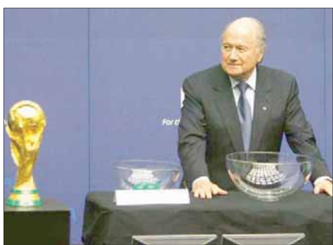
بلاوتر أقر حدوث تلاعب في قرعة البطولات الكبرى «الشرق الأوسط»

البرازيل حيث تنتمي المنتخبات الخمسة إلى اتحاد قاري واحد هو اتحاد أمريكا الجنوبية (كولومبيا). وبعدها، تسحب منتخبات المستوى الثالث (الدنمارك وأيسلندا وكوستاريكا والسويد وتونس ومصر والسفاح وإيران) ثم منتخبات المستوى الرابع (صربيا ونيجيريا وأستراليا واليابان والمغرب وبنما وكوريا الجنوبية والسعودية). وفيما يلي قائمة المنتخبات التي سيصحبها كل وعاء ومركز كل منها في التصنيف العالمي: