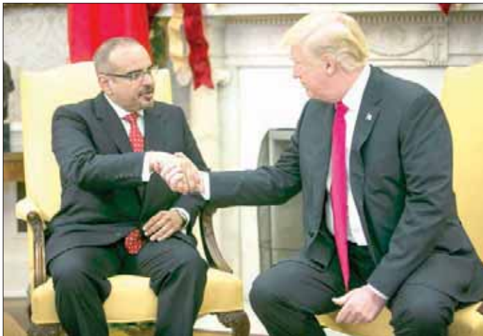
الرئيس الأميركي مستقبلاً ولي العهد البحريني في البيت الأبيض أمس

أطر العمل المشترك بينهما، ومنها الجهود لحفظ الأمن الإقليمي والتصدي للإرهاب والتطرف وتجفيف مصادر تمويله.