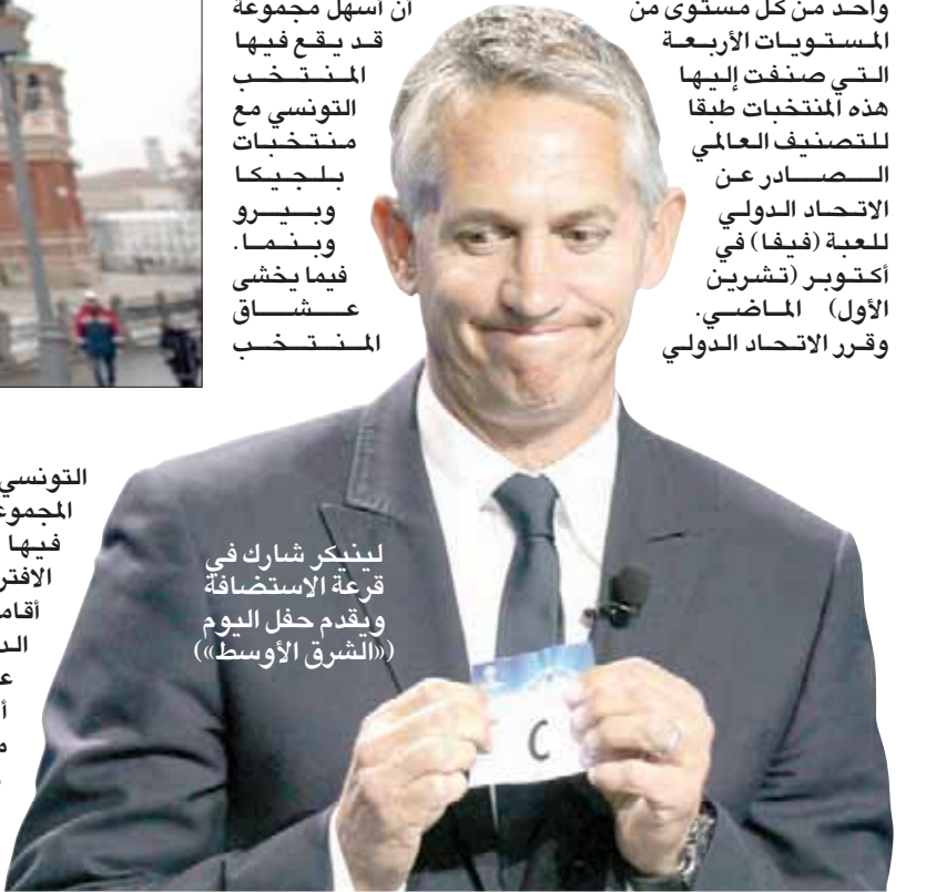
لنشارك في قرعة الاستضافة ويقدم حفل اليوم «الشرق الأوسط»

وتقسم المنتخبات الـ32 المتأهلة للنهائيات على ثماني مجموعات تضم كل منها أربعة منتخبات بواقع منتخب واحد من كل مستوى من المستويات الأربعة التي صنفت إليها هذه المنتخبات طبقاً للتصنيف العالمي الصادر عن الاتحاد الدولي للعبة (فيفا) في أكتوبر (تشرين الأول) الماضي. وقرر الاتحاد الدولي