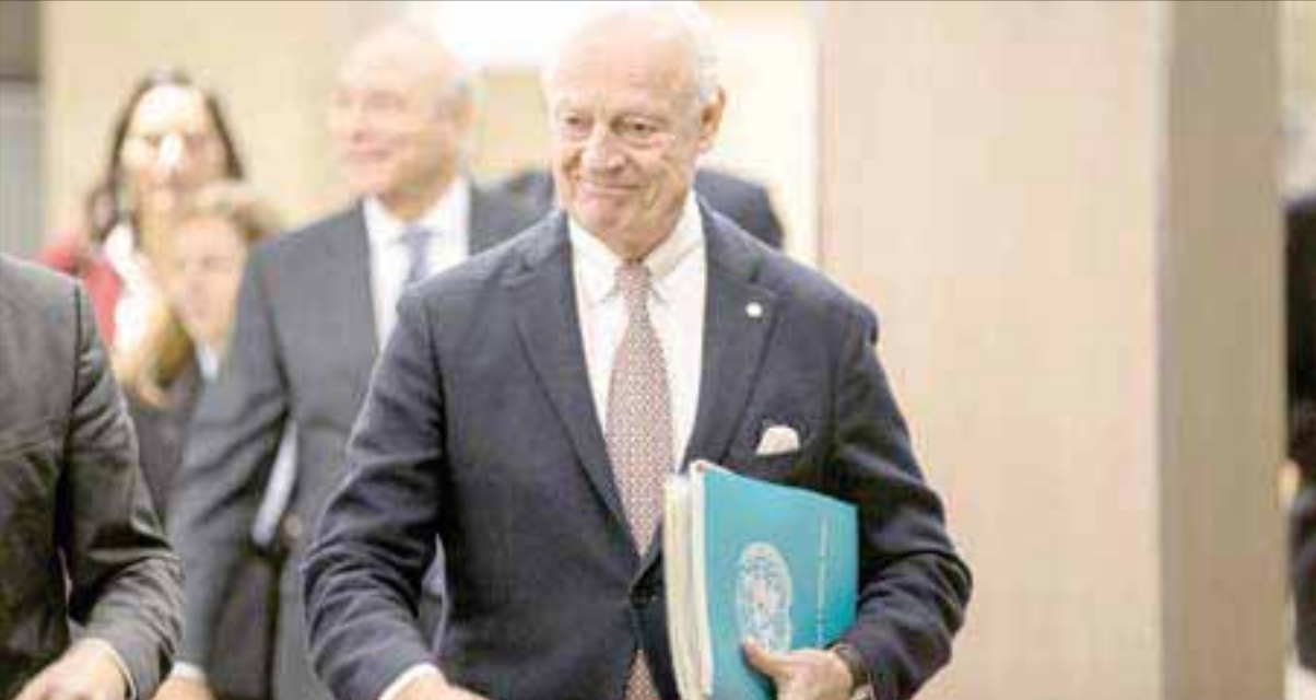
دي ميستورا في جنيف أمس

القاهرة وموسكو، وثيقة، رداً على دي ميستورا، تضمنت 12 بنداً. وكان لافتاً في الوثيقة، التي حصلت على نسخة منها، إسقاط كلمة «العربية» من اسم «الجمهورية العربية السورية» لتصبح «سوريا»، إضافة إلى إقرار مبدأ اللامركزية وحقوق الأكراد وباقي القوميات. كما اقترحت التأكيد على «إصلاح الجيش الوطني» و«إعادة هيكلة أجهزة الأمن».