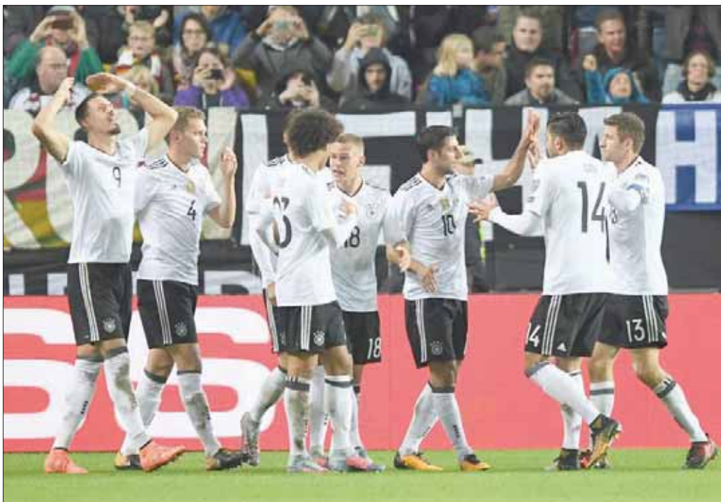
ألمانيا مرشحة للاحتفاظ باللقب

البرازيل حيث تنتمي المنتخبات الخمسة إلى اتحاد قاري واحد هو اتحاد أمريكا الجنوبية (كولومبيا). وبعدها، تسحب منتخبات المستوى الثالث (الدنمارك وأيسلندا وكوستاريكا والسويد وتونس ومصر والسفاح وإيران) ثم منتخبات المستوى الرابع (صربيا ونيجيريا وأستراليا واليابان والمغرب وبنما وكوريا الجنوبية والسعودية). وفيما يلي قائمة المنتخبات التي سيصحبها كل وعاء ومركز كل منها في التصنيف العالمي: