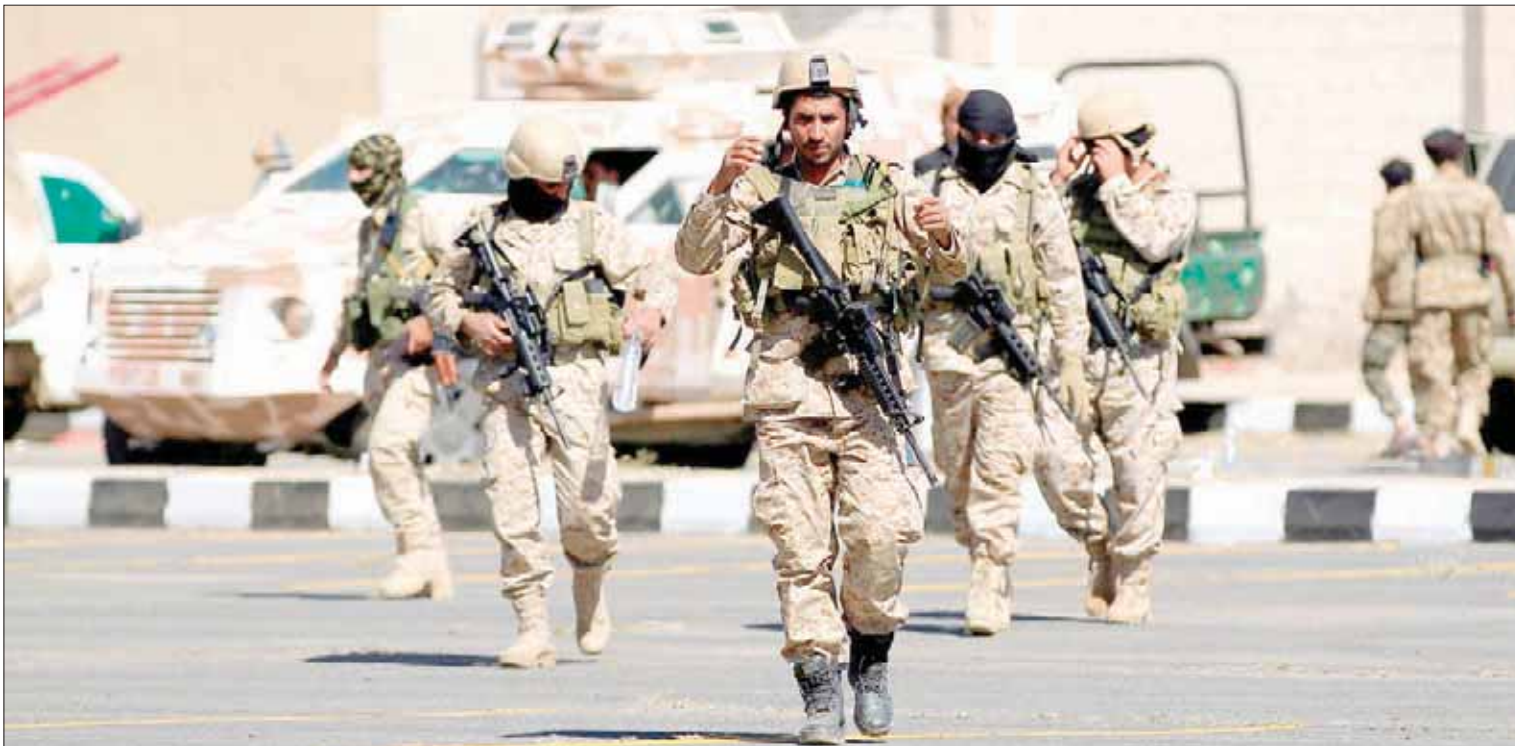
عناصر الأمن الحوثية بعد سيطرتها على مسجد الصالح بصنعاء

تستخدمها سوى الدول وأجهزتها الأمنية والعسكرية، بالإضافة إلى عدد من الأطقم المدرعة، ناهيك بالاطقم العادية مع عربة كبيرة ففص (إكس راى) متنقل، وكذلك عدد من صواريخ لو الأميركية وقواذف (ار بي جي) ومعدلات نوع (شيكي)، وهذا ما أكد الشكوك لدى الأجهزة الأمنية واتضح أسباب التمنع والرفض هذا المنطقية التي كانت تخفي خلفها هذا الكم الهائل من السلاح».