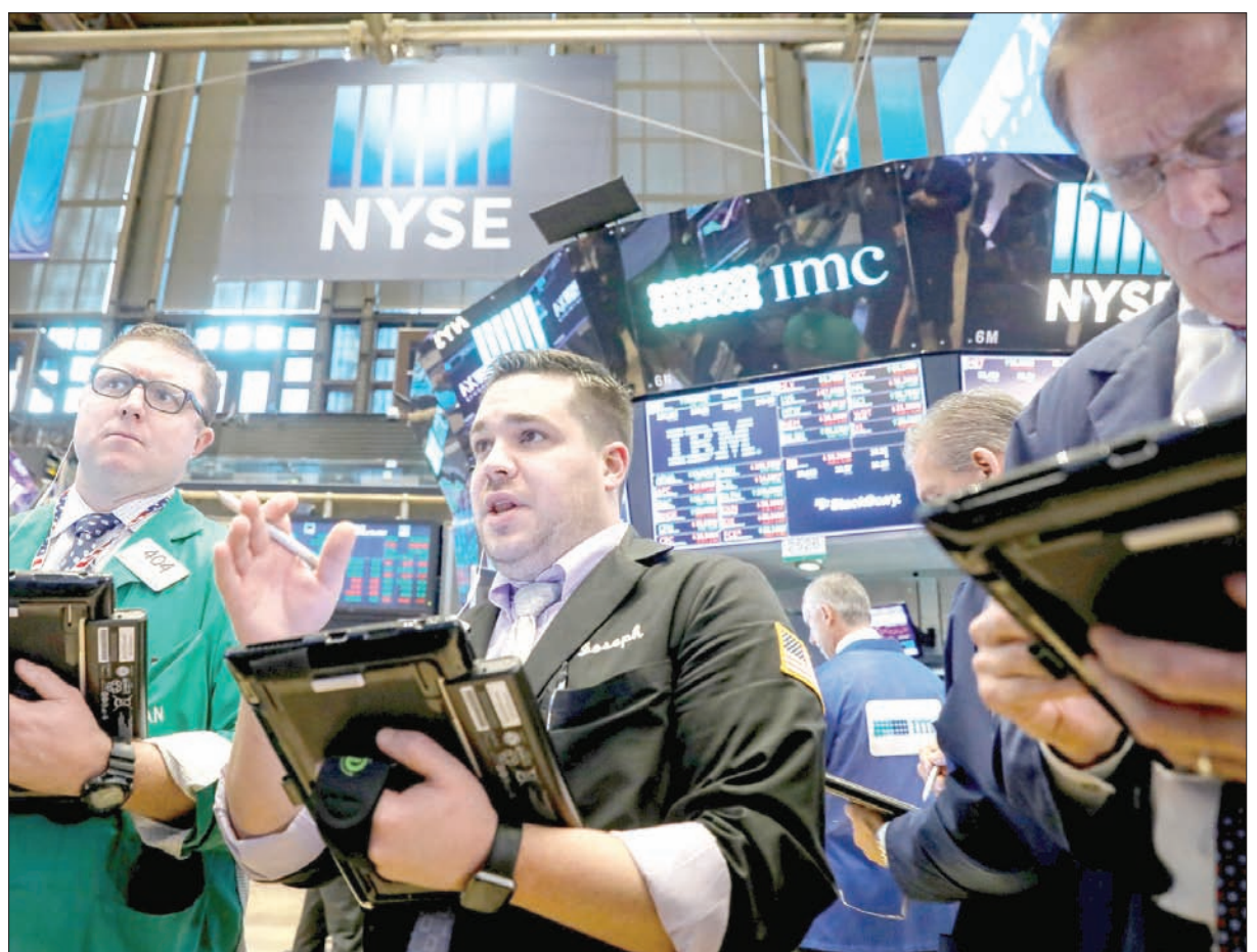
متعاملون أثناء تداولهم الأسهم في بورصة نيويورك

المستهدف من البنك المركزي خلال خمس سنوات على الرغم من تحرك مجلس الاحتياطي صوب تطبيع السياسة النقدية. وعضو المؤشر نيكبي القياسي لأسهم الشركات اليابانية الخسائر التي كان قد منى بها في وقت سابق وأغلق على ارتفاع طفيف أمس الجمعة، حيث بددت التوقعات بأن بنك اليابان المركزي سيشتري المزيد من صناديق المؤشرات إثر تراجع قطاع شركات إنتاج السيارات. بيد أن سهم ميتسوبيشي ماتريالز هبط بعد أن قالت الشركة إن وحدتها التابعة زُيِّت بيانات منتجات في أحد فضاءات الرقابة على الجودة تشمل شركات يابانية. وأغلق المؤشر نيكي مرتفعاً 0,1 في المائة إلى 22550,85 نقطة بعدما جرى تداوله على انخفاض في التعاملات الصباحية. وعادة ما يقل بنك اليابان المركزي على الشراء في صناديق المؤشرات لدعم المؤشر إذا هبط صباحاً.