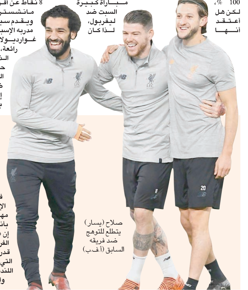
السبت ضد ليفربول، لذا كان

تشيلسي يتطلع لمواصلة انطلاقته في الأسابيع الأخيرة