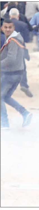
مواجهة بين الفلسطينيين وجيش الاحتلال الذي استعمل الغاز المسيل للدموع في الخليل أمس

أمور أخرى، إلى تحويل النقب بأسره إلى أرض يهودية، بعد أن عبّر، في مذكراته، عن إعجابه بالاستيطان اليهودي الذي أظهر «نجاحاً استثنائياً». وقال موهان في مذكراته، إن البدو العرب «حتى إن عاشوا هناك (في منطقة النقب) نحو الألف سنة، لن يتركوا خلفهم أي أثر». ويتضح من المذكرات أنه وبعد نكبة فلسطين عام 1948، استمر موهان في لعب دور دبلوماسي مهم في عملية الملاحقة والأراضي المنقولة، وبين عام 1949 بين إسرائيل، وبين كل من مصر ولبنان والأردن وسوريا. وقسم قرار 181 فلسطين إلى 3 كيانات جديدة، دولة عربية تقوم على نحو 42 في المائة من مساحة فلسطين وتقع على الجليل الغربي، ومدينة عكا، والضفة الغربية، والساحل الجنوبي الممتد من شمال مدينة أسدود حتى رفح جنوباً، مع جزء من الصحراء على طول الشريط الحدودي مع مصر، بالإضافة إلى دولة يهودية تقع على 58 في المائة من مساحة فلسطين وتقع على السهل الساحلي من حيفا حتى جنوب تل أبيب، والجليل الشرقي بما في ذلك بحيرة طبرية وأصبع الجليل، والنقب بما في ذلك أم الرشراش أو ما يعرف ببلات حاليًا، على أن تقع مدينة القدس وبيت لحم والأراضي المجاورة، تحت وصاية دولية.