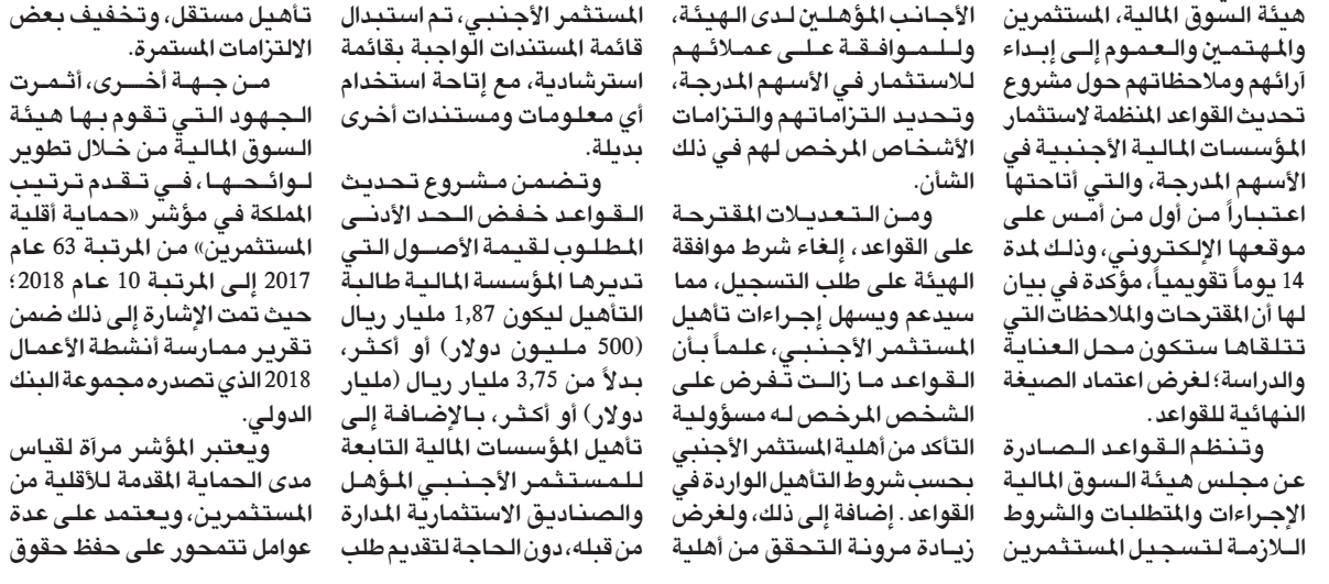
المستثمر الأجنبي، تم استبدال قائمة المستندات الواجبة بقائمة استرشادية، مع إتاحة استخدام أي معلومات ومستندات أخرى بديلة.

المستثمر الأجنبي، تم استبدال قائمة المستندات الواجبة بقائمة استرشادية، مع إتاحة استخدام أي معلومات ومستندات أخرى بديلة. وتضمن مشروع تحديث القواعد خفض الحد الأدنى المطلوب لقيمة الأصول التي تديرها المؤسسة المالية طالبة تاهيل ليكون 1,87 مليار ريال (500 مليون دولار) أو أكثر، بدلا من 3,75 مليار ريال (مليار دولار) أو أكثر، بالإضافة إلى تاهيل المؤسسات المالية التابعة للمستثمر الأجنبي المؤهل للصناديق الاستثمارية المدارة من قبله، دون الحاجة لتقديم طلب الإلتزامات المستمرة. من جهة أخرى، أثمرت الجهود التي تقوم بها هيئة السوق المالية من خلال تطوير لوائحها، في تقدم ترتيب المملكة في مؤشر «حماية أقلية المساهمين» من المرتبة 63 عام 2017 إلى المرتبة 10 عام 2018؛ حيث تمت الإشارة إلى ذلك ضمن تقرير ممارسة أنشطة الأعمال 2018 الذي تصدره مجموعة البنك الدولي. ويعتبر المؤشر مראה لقياس مدى الحماية المقدمة للأقلية في الاستثمارين، ويعتمد على عدة عوامل تتمحور على حفظ حقوق