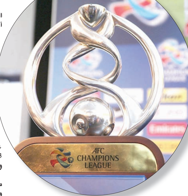
كأس دوري آسيا تنتظر بطلها الجديد اليوم (الشرق الأوسط)

ويتمسح فريق أوروا الياباني بجماهيرته التي يعتبرها أبرز أسلحته هذا المساء، حيث يتوقع أن تشهد المباراة حضوراً جماهيرياً لكافة مقاعد الملعب المتاحة، حيث اعتاد الفريق الياباني بوجود مساندة جماهيرية دائمة ومؤثرة في غالبية مواجهات الفريق الأحمر.