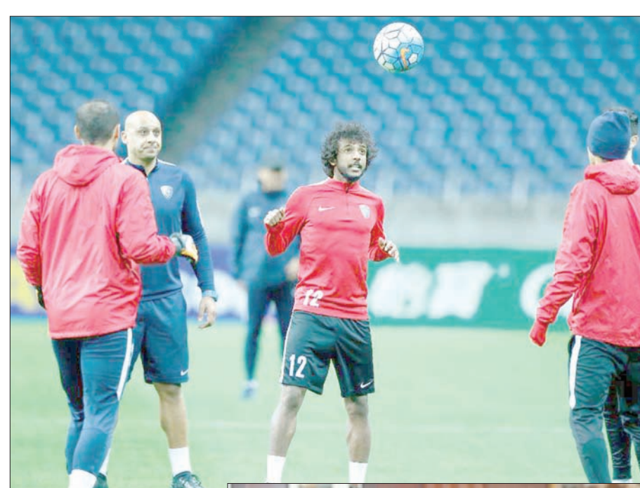
من تدريبات الهلال الأخيرة قبل النهائي الآسيوي

وأشار إلى أن سيناريو لقاء الذهاب أتاح فرصاً عديدة للهلال من أجل الخروج بنتيجة كبيرة، إلا أنهم لم يوقفوا