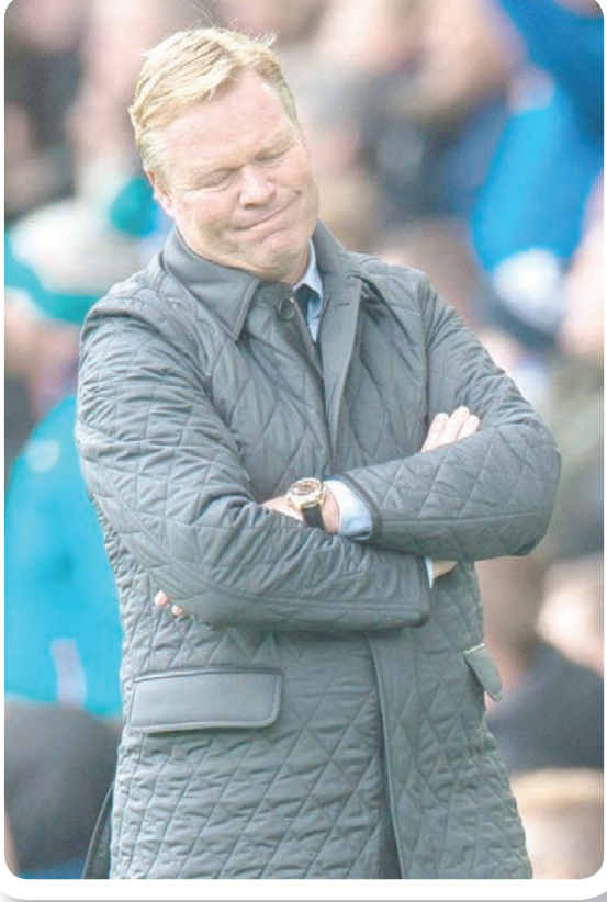
لم يتوقع كثيرون رحيل كومان عن إيفرتون («الشرق الأوسط»)