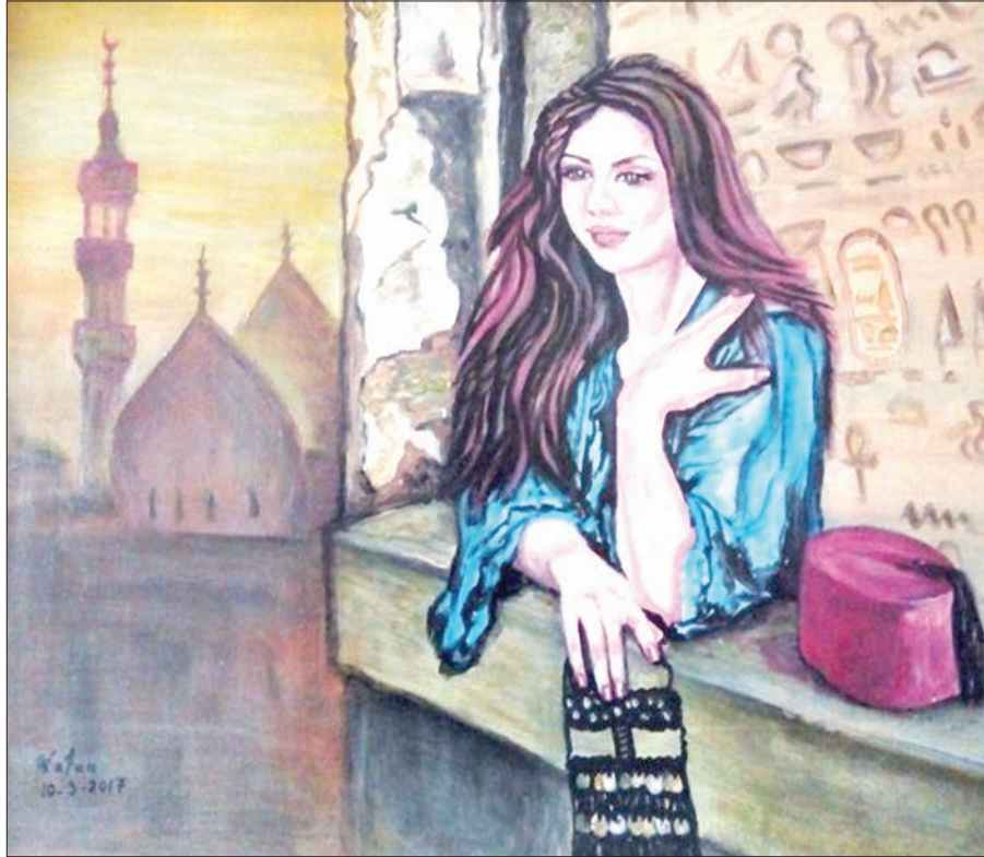
إحدى اللوحات المشاركة في المعرض

ويكشف مدير إدارة المشروعات الخاصة عن أنّ معارض «جمال وسلام» للفن التشكيلي تُخطط لها أن تنظم بشكل ربع سنوي، بعد الاتفاق مع نقابة الفنانين التشكيليين المصريين على ذلك، مع التوسع في إيجاد عناوين وشعارات أخرى فرعية، وهو ما يعمل على التوسع والنوع في نشر مفهومي «الجمال والسلام»، إلى جانب أنّ ذلك يتيح الفرصة لعدد كبير من الفنانين التشكيليين للاشتراك في هذه المعارض بما يجرز مواهبهم وإبداعاتهم الفنية.