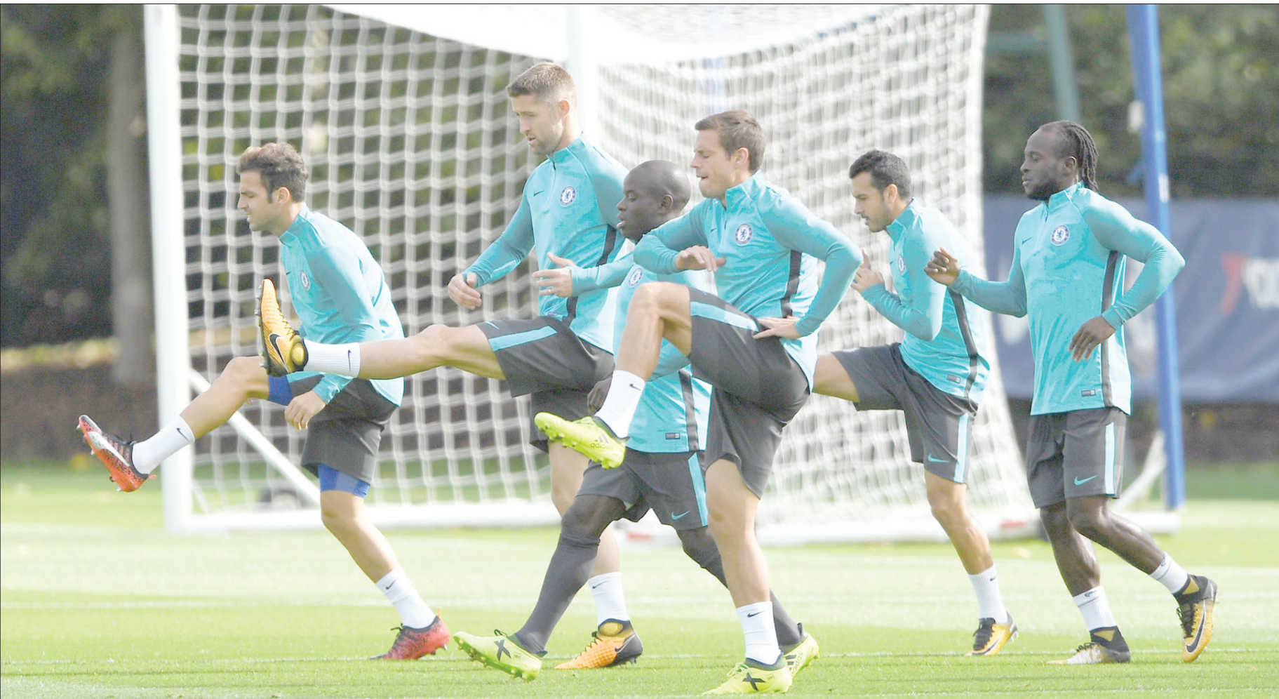
تلدن، الشرق الأوسط

الغربي خلال الفوز الكاسح للريال 6 - 1. صفر الثلاثاء بدوري أبطال أوروبا، وبالمعالم المحل. وتعرض خط هجوم الريال الذي يضم بنزيمة ورونالدو وغاريث بيل لهجوم شديد في موسم الحالي، بسبب عزيمته عن تسجيل الأهداف، الأمر الذي ألقى بثقله على نتائج الفريق. ويستمر غياب بيل بسبب الإصابة ويغيب المدافع ناتشو لايكاف، ونحوم الشوك حول مشاركة كيلور نافاس ومانيو كوفاسيتش. ويلتقي أتلتيكو مدريد صاحب المركز الرابع اليوم مع ليفانتي منتشيا بالفوز على روما 2 - 1 صفر في دوري أبطال أوروبا. ويلتقي اليوم أيضاً الأفيص مع إيبار وريال بيتيس في جبرونا. وفي باقي المباريات غداً يلتقي ديورتيغو لاكورنا مع أتلتيك بيلنايا، وريال سوسيداد مع لاس بالماس، وفي ريال مع أشبيلية. فيما يلتقي إسبانيول مع خيتافي يوم الإثنين.