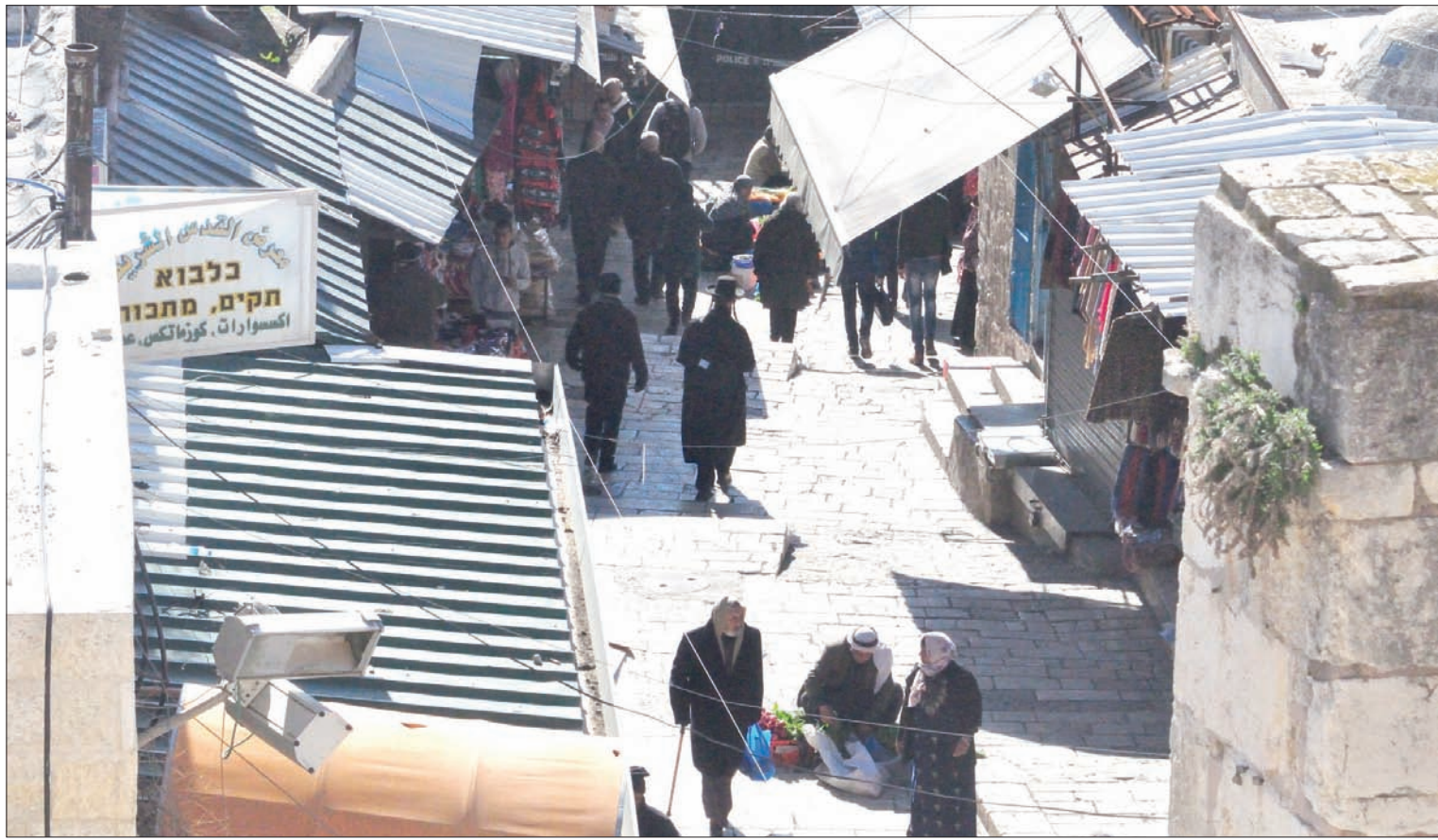
جانبا من سوق شعبية في المدينة القديمة بالقدس

ويقول إن أنه على الرغم من أن عرب القدس الشرقية، لم يتخلوا عن وطنيتهم الفلسطينية، فإن اندماجهم في المجتمع الإسرائيلي يزداد. فهناك المزيد من خريجي الثانوية وفقاً للمناهج التعليمية الإسرائيلي، والمزيد ممن يختارون الدراسة في جامعات إسرائيل، والمزيد من حالات الزواج لأبناء وبنات شرقي القدس مع العرب في إسرائيل (فلسطيني 48) وأقل من عرب الضفة، والمزيد من «التوجه إلى الغرب» والوجود المتعاظم في مجالات الاستهلاك والترفيه في المناطق اليهودية. ووفق كل شيء، يحتل عمال شرق القدس أجزاء متزايدة من سوق العمل في غرب المدينة. وهنا يكشفان عن تمييز عنصري صارخ ضد العرب. وهكذا يتضح من البحث أن «دوامه المشاعر المتضاربة التي