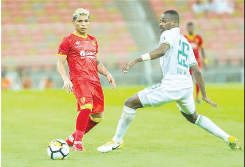
من مباراة الأهلي والقادسية أمس في جدة

وقال نائب رئيس نادي الهلال عبد الرحمن النمر، إن الفريق في جاهزية كاملة للمباراة باستثناء الغياب القسري للبرازيلي إدواردو للإصابة، وإن جميع اللاعبين تحت رهن إشارة الجهاز الفني للفريق «ولا ينقصنا إلا التوفيق من رب العالمين وأن يتيسر لنا الحظ». كان الحكم الأوزبكي رافشان قد حوَّص من قبل الإعلاميين السعوديين، أمس، لاستنطاقه حول النهائي الآسيوي، إلا أنه رفض التصريح. وأمر مسؤولي الأمن بإبعادهم عنه. وكان قراءة 700 مشجع هلافي قد وصلوا إلى طوكيو من أجل مساندة الهلال قادمين من المملكة، بالإضافة إلى المتعجبين السعوديين والعرب، ويوجد قرابة 2500 تذكرة مخصصة للجماهير في مدرجات الهلال. من جهة أخرى زار رئيس مجلس إدارة الهيئة العامة للرياضة تركي بن عبد المحسن آل الشيخ، بعثة فريق الهلال الأول لكرة القدم في مقر إقامتها في العاصمة اليابانية طوكيو. وحضر رئيس مجلس هيئة الرياضة على لقاء اللاعبين لتحفيزهم قبيل خوض مواجهة إياب النهائي. وتُشن الأمير نواف بن سعد، زيارته آل الشيخ لمقر البعثة ووقفاتته الكبيرة مع ممثل الوطن، معبراً عن اعتزازه بما يجده ممثل الوطن من دعم وتوفير كل سبل النجاح، وتحفيزهم قبيل خوض مواجهة إياب النهائي. وتُشن الأمير نواف بن سعد، زيارته آل الشيخ لمقر البعثة ووقفاتته الكبيرة مع ممثل الوطن، معبراً عن اعتزازه بما يجده ممثل الوطن من دعم وتوفير كل سبل النجاح، وتحفيزهم قبيل خوض مواجهة إياب النهائي.