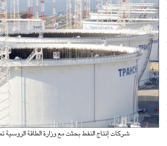
شركات إنتاج النفط يبحث مع وزارة الطاقة الروسية تمديدا لمدة ستة أشهر (رويترز)

متحدثة باسم نوكاف عن التعليق، كان نوكاف يتحدث في بوليفيا حيث يحضر منتدى الدول المصدرة للغاز. وقال إنه التقى بوزير النفط القطري والفنزويلي في بوليفيا وكذلك مسؤولين من الإمارات حسيما ذكرت وسائل إعلام روسية. ويمثل ارتفاع إنتاج النفط الأميركي، الذي ففز في المائة منذ منتصف 2016 على مستوى الأسعار، خفضا عند 9,6 مليون برميل يوميا، حجر عثرة في طريق تمديد الاتفاق الذي تقوده أوبك. ويريد المنتجون الأميركيون إمداداتهم مع ارتفاع أسعار النفط بعد أن كانوا خفضوا الإنتاج في أعقاب ارتفاع الأسعار في منتصف عام 2014. ويقوض ارتفاع الإنتاج الأميركي أثر تخفيضات الإنتاج والتيبت في تاكل الحصص السوقية لآخرين مثل روسيا. وحول السيناريووات الغورية لما بعد انتهاء أجل اتفاق خفض الإنتاج، قال مصدر في شركة نفط روسية كبيرة «بكل تأكيد أتوقع معركة شرسة على الحصص في الأسواق العالمية فور أن ينتهي أجل