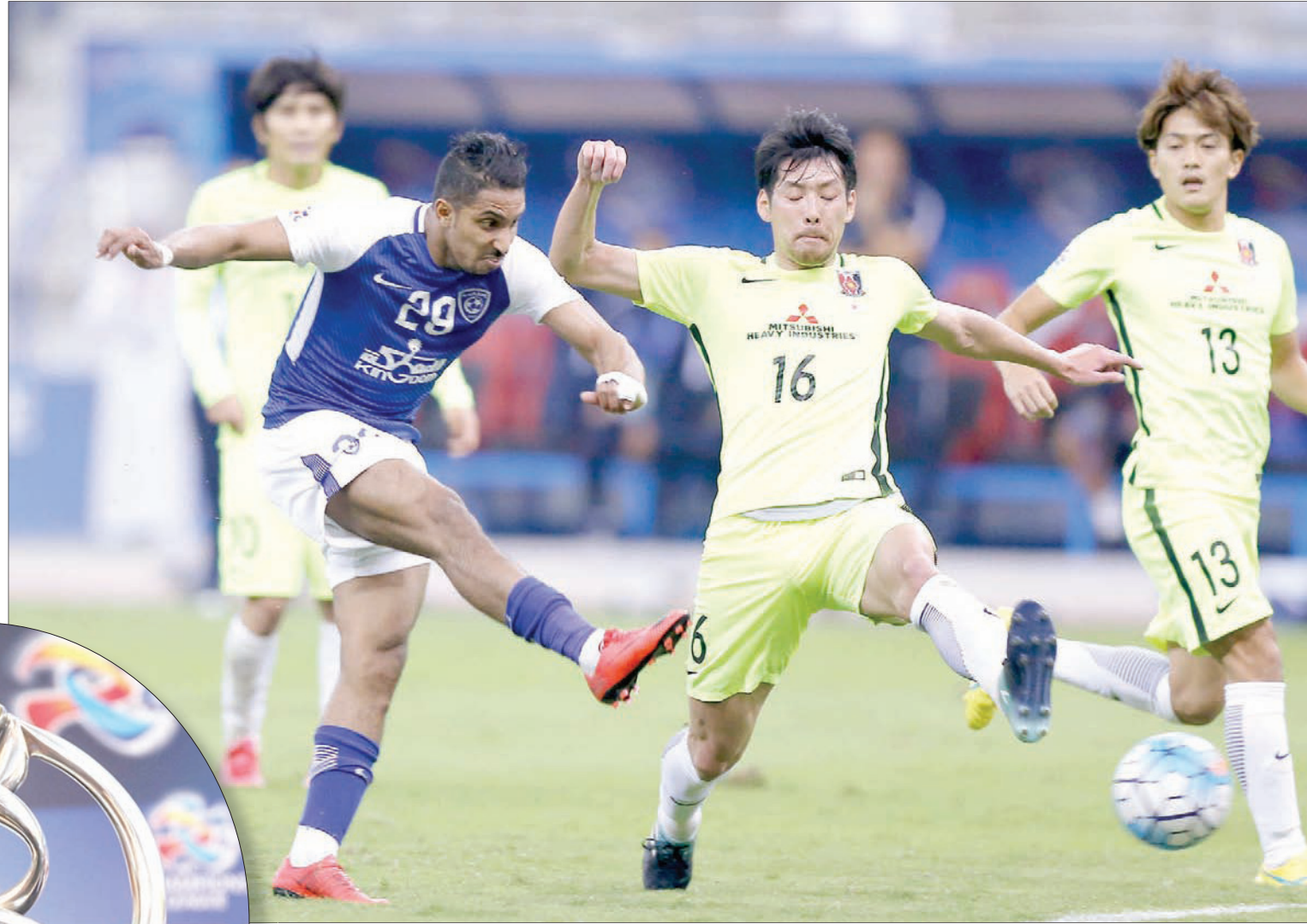
من مواجهة ذهاب النهائي الآسيوي في الرياض بين الهلال وأوروا (الشرق الأوسط)