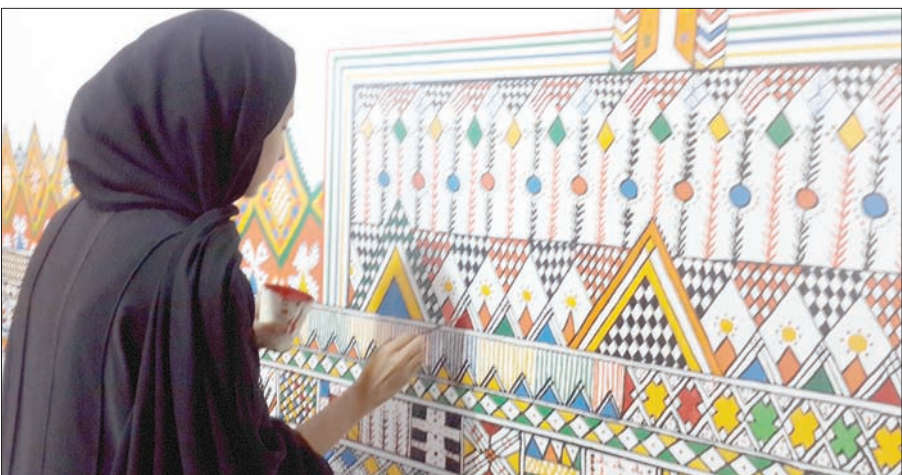
فن القط العسيري وهو فن من فنون النقش والزخرفة التقليدية على جدران المنازل

والدعم الدوليين لضمان استمرار نقل هذه الممارسات الثقافية فيما يتوافق مع المجتمعات المنتمية. وجرت العادة، مرة كل سنة، أن تجتمع اللجنة الدولية الحكومية المؤلفة من ممثلي الـ24 دولة الأطراف في اتفاقية اليونيسكو الخاصة بصون التراث الثقافي. ويتابع المجتمعون تطبيق هذه الوثيقة القانونية التي صدقت عليها 175 دولة من الدول التي أدرجت صون التراث غير المادي في التشريعات الوطنية. وقد ساعدت الاتفاقية خلال الـ14 عاماً الماضية في صيانة 140 مشروعاً للتراث الحي في 107 بلاد.