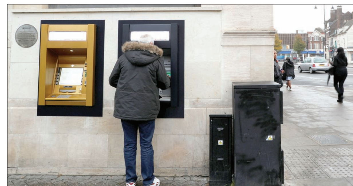
نسبة كبيرة جدا تلجا إلى السحب عن طريق ماكينة الصرف الآلي