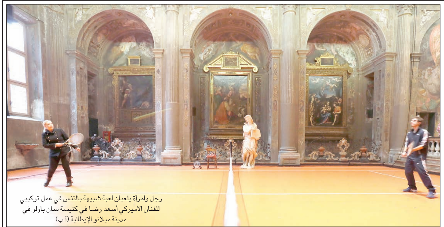
رجل وامرأة يلعبان لعبة شبيهة بالتنس في عمل تركيبى للفنان الأمريكى أسعد رضا في كنيسة سان باولو في مدينة ميلانو الإيطالية

أبوظبي، «الشرق الأوسط» يؤسس فرناندو ألونسو (بطل العالم مرتين)، أول سائق في بطولة سباقات «فورمولا 1» للسيارات، فريقه الخاص لبطولة «فورمولا 1» الإلكترونية، على الواقع الافتراضي. وأعلن سائق «مكلارين» البالغ عمره 36 عاماً عن فريقه «إف.إيه. ريسنج جي. 2» لوجينك «جي» على هامش سباق جائزة أبوظبي الكبرى في ختام موسم «فورمولا 1». وقال السائق الإسباني للصحافيين «أخيراً أصبح رئيساً لفريق. أنا متحمس لهذا الأمر وهو مجال جديد». وجاء الفريق بناءً على شراكة بين «جي. 2» في سبورتس، وراعي «مكلارين لوجينك»، وسينافس في العديد من الألعاب بالإضافة إلى البطولات الحالية. وأعلن مكلارين هذا الأسبوع عن تعيين أول سائق سباقات افتراضية، سائقاً رسمياً لجهان المحاكاة بعد تنظيم إحدى البطولات، وهو أول فريق أيضاً يملك مديراً لبطولات السباقات الافتراضية. وسيتم تتويج أول فائز في بطولة العالم لسباقات «فورمولا 1» الإلكترونية الأسبوع المقبل في أبوظبي. وتعاقد فريق ألونسو بالفعل مع أحد المشاركين في النهائي وهو التركي جيم بولكباشي. وقال ألونسو في بيان: «في قلب كل سائق فورمولا 1 هناك سائق سباقات ألعاب إلكترونية. المنافسة في البطولات الافتراضية تفتح الاحتمالات أمام السائقين الشبان لخوض تجربة السباقات». وقال زاك براون، المدير التنفيذي لـ«مكلارين»، في مايو (أيار) إن كل فرق «فورمولا 1» يجب أن تضم سائق سباقات افتراضية. وأضاف في ذلك الوقت: «لا يمكن لفريق فورمولا 1 أن يتجاهل قوة السباقات الإلكترونية والجمهور التي تشاهدها. لذا أتمنى أن تسمي كل فرق فورمولا 1 على نفس النهج».