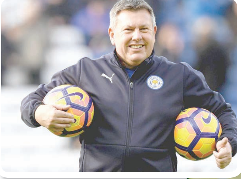
شكسبير بدأ مسيرته متفانلاً مع ليستر كمدرب