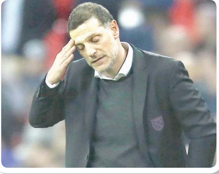
الهزيمة أمام ليغربول رباعية كانت القشة التي قصمت ظهر بيليتش («الشرق الأوسط»)