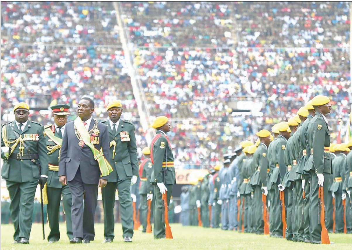
رئيس زيمبابوي الجديد إيمرسون منانغاغا خلال حفل أداء اليمين في العاصمة هراري أمس

وكان أفيد أن موغابي سيجب مراسم تنصيب خلفه، لكنه لم يفعل. وقال شارامبا «إنه ليس في حالة تسمح له بالحضور». ويرى محللون سياسيون أن موغابي ترك اقتصاداً مدمراً في بلد يعاني من نقص الأموال وشبح التضخم المفرط. فبينما تبلغ نسبة البطالة 90 في المائة، يعايش سكان البلاد من أشغال صغيرة في الاقتصاد الموزاي، فيما هاجر آخرون إلى جنوب أفريقيا، لذلك يعلق سكان زيمبابوي أملاً هائلة على هذا التغيير في السلطة.