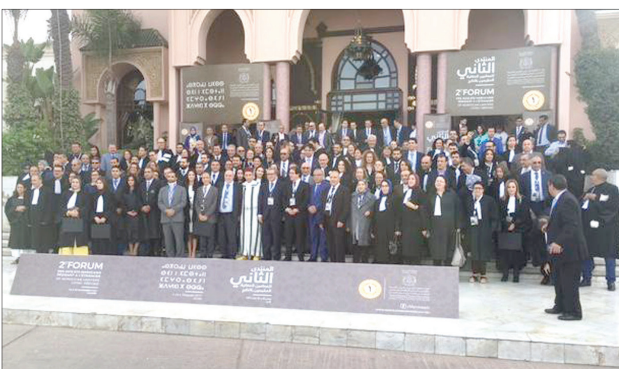
صورة تذكارية لوزيري العدل والجلية المغربية بالخارج وشؤون الهجرة مع المحامين المغاربة المشاركين في المنتدى الذين قدموا من داخل المغرب وخارجه («التشرق الأوسط»)

وتعيش أسر المغاربة العالقين في ليبيا على وقع الصدمة والخوف من مصير ابنائهم المعتقلين في السجون