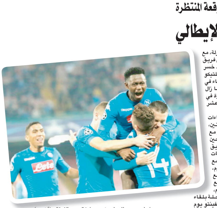
نابولي يسعى للتحلق في صدارة الدوري الإيطالي

الإسباني في دوري الأبطال، التي انتهت بالتعادل السلبي الأربعة. ويعاني يوفنتوس من اهتزاز خط دفاع، على غير العادة، هذا الموسم، بعدما تلقى 14 هدفاً في 13 مباراة ببطولة الدوري. وأشار ماسيمليانو اليغري مدرب يوفنتوس بمدافعيه عقب مواجهة برشلونة، حيث قال: «واجهنا مجموعة من اللاعبين الاستثنائيين الليلة، حافظنا على مستوى عالٍ من التركيز، ولم يتمكنوا من هز شبانكا». وأضاف اليغري: «عندما يدافع يوفنتوس بهذا الشكل، فإن مهمة منافسينا في التسجيل تبدو صعبة للغاية». وأضاف اليغري: «عندما يدافع يوفنتوس يتميز بها يوفنتوس، والتي لعبت دوراً هاماً في تحقيقه رقماً قياسياً باحفاظه بثلث الدوري الإيطالي ستة مواسم متتالية، عاملاً حاسماً له عندما يلتقي مع نابولي وإنتر وروما في الشهر المقبل. ويلتقي روما، صاحب المركز