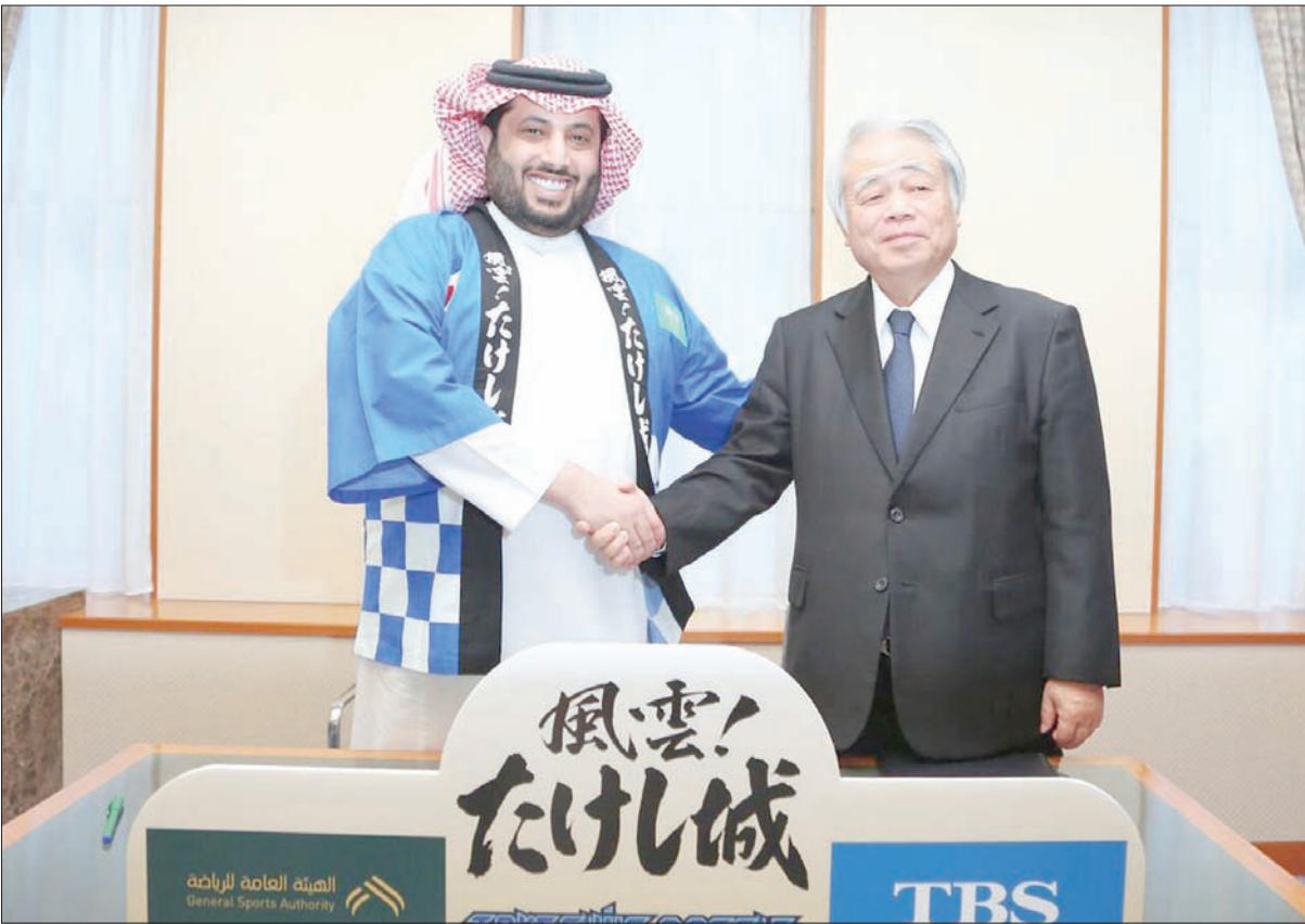
آل الشيخ بعد توقيع الاتفاقية مع توشي شيكا

نحو إيجاد برامج نوعية وثرية، تساهم في رفع معدل الرياضات والألعاب المختلفة، إلى جانب تهيئة برامج لصناعة اقتصاد رياضي مزدهر، مستمد من رؤية وطنية وطموح قادته نحو الوصول لأفضل البرامج المناسبة للمجتمع بمختلف فئاته.