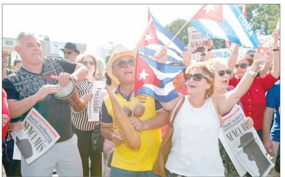
كوبيون يرفعون الأعلام الكوبية بمناسبة ذكرى وفاة الزعيم فيدل كاسترو في شوارع ميامي أمس (أ.ب.)

ويعد فيدل كاسترو بالنسبة لانصاره بطل كوبا الحرة، الذي وقف في وجه أميركا، وبشر بالتقدم الاجتماعي للبلاد؛ لكن بالنسبة لخصومه يعد الزعيم الراحل حاكماً