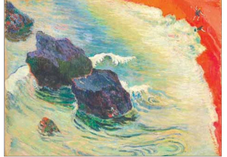
من أعمال بول غوغان من عام 1888