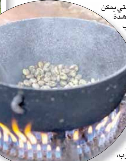
مزارع في حقول قهوة ليوم واحد

يمكنك التمتع بالهواء النظيف، وسحر الريف مقابل تكلفة تتراوح بين 80 و100 دولار، في حين تبلغ سعر رحلة اليوم الواحد 50 دولاراً تقريباً. يعد مثلث القهوة من أفضل الوجهات والمقاصد السياحية في كولومبيا. وبدأ هذا المكان ليوم واحد، حيث يمكن أن يعرفوا عن معلومات عن حبوب القهوة، التي تتم زراعتها على ارتفاعات وسر عملية حصاد الحبوب، وتجفيفها، وتحميصها. ويمكن أن يكون ختام التجربة مسكاً، وذلك بتذوق الذنكهات القهوة التي تفوق الخيال. يوضح باتشون قائلاً: «يساهم المشهد الثقافي للقهوة لدينا في إحداث تنوع كبير، حيث توجد محاصيل تنم زراعتها على ارتفاع يتراوح بين