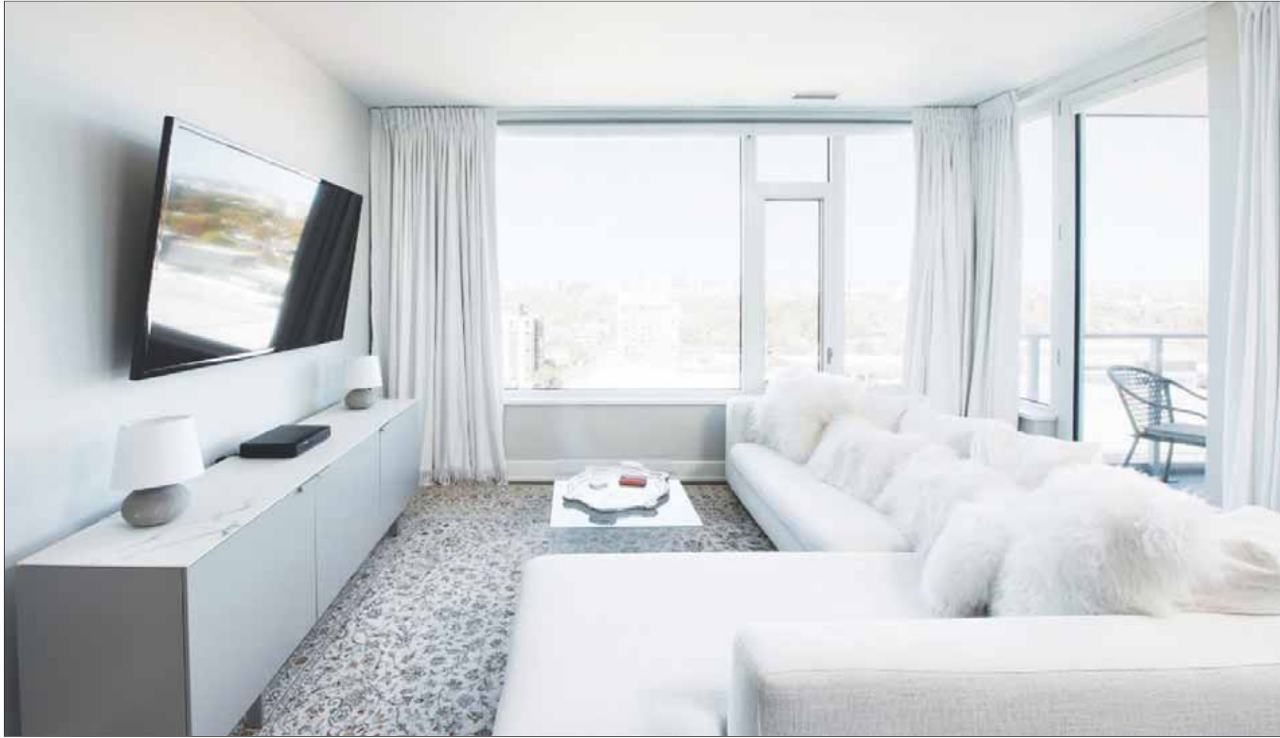
شقة من غرفتين في وسط مدينة أوتاوا بسعر 1,34 مليون دولار أميركي

بشكل خاص مع الطفرة العقارية الحالية هناك.