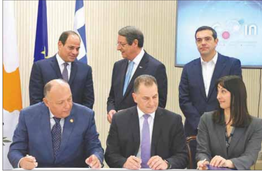
الزعماء الثلاثة يشاهدون توقيع الوزراء عدداً من اتفاقيات التعاون

وأشار إلى أن «آلية التعاون بدأت بهدف تعزيز التعاون الاقتصادي وترسيخ العلاقات السياسية المستقرة، غير أنها تحولت حالياً إلى أحد أهم أركان الحفاظ على الأمن والاستقرار في منطقة شرق المتوسط... تلك الآلية