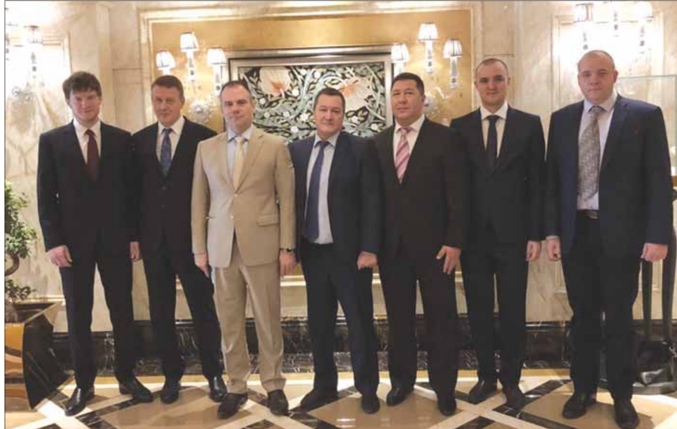
جانب من زيارة ممثلي قطاع الأعمال الروسي أمس في الرياض

المملكة، وسيعودون إلى الرياض لتوسيع التعاون في مجالات تتمتع بتقنيات روسية عالية في الكهرباء أرخص من مثيلاتها في أوروبا. ولفت إلى أن زيارة وفد قطاع الأعمال الروسي الحالية، تأتي امتداداً لما تم الاتفاق عليه في منتدى الأعمال السعودي الروسي الذي نظمته هيئة الاستثمار إبان زيارة خادم الحرمين لموسكو، وتتويجاً لما تم الاتفاق عليه في اللجنة الروسية السعودية