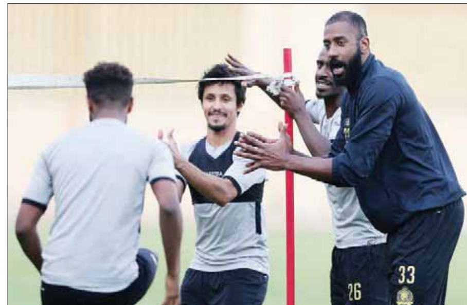
جانب من تدريبات فريق النصر