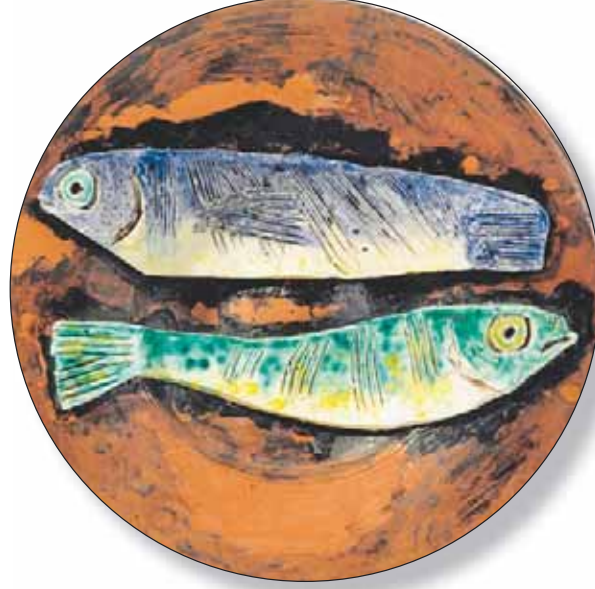
لوحة لبيكاسو من عام 1957