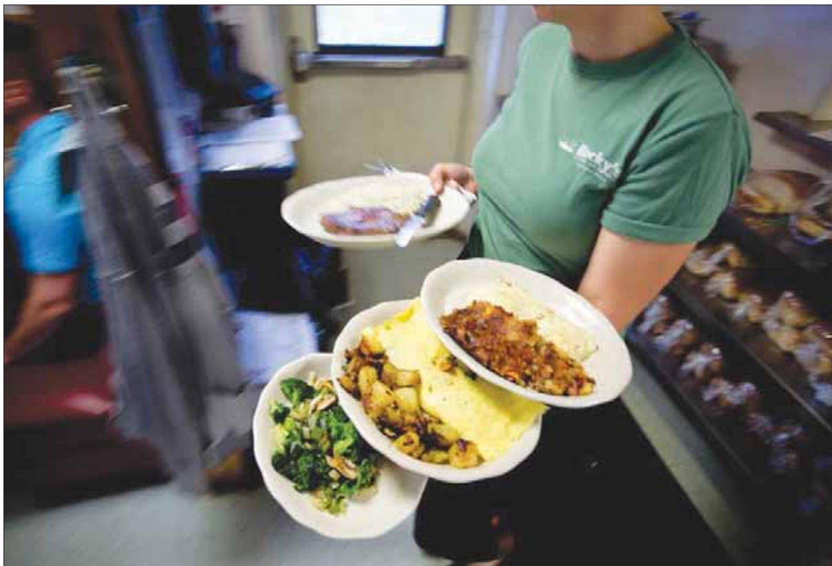
تختلف وجبات البيض والبطاطا المقلية والخبز المحمص من ولاية لأخرى... وهي في متناول الجميع

تبعاً للحد الأدنى عن دوام كامل ولديه طفلان، يحصل على أكثر من 1000 دولار، حتى قبل أخذ الإعانات الفيدرالية في الاعتبار. من ناحية أخرى، فإن القوة الشرائية للحد الأدنى للأجور ينبغي أن تكافئ تقريباً المستوى ذاته عبر مختلف أرجاء البلاد، من بالم سبرينغز في كاليفورنيا حتى ينغستاون في أوهايو. ولتحقيق ذلك، ينبغي توزيع المناطق عبر واحدة من خمس فئات تعتمد على ما تطلق عليه الحكومة التكافؤ السعري الإقليمي، الذي يشكل مقياساً للتباينات في الأسعار عن المنتجات المتشابهة بين المناطق المختلفة. داخل المناطق الأعلى تكلفة، مثل مدينة نيويورك ونيويورك، ينبغي تبعاً لهذا المقياس تحديد الحد الأدنى للأجور التي أقرت في ولايات مختلفة. يذكر أنه عام 2014، علاوة على تصويت سياتل وسان فرانسيسكو لصالح إقرار الحد الأدنى للأجور عند 15 دولاراً، اختارت أركنساس والاسكا وساوث داكوتا ونبراسكا جميعاً رفع الحد الأدنى للأجور لديهم. وداخل هذه الولايات الريفية الأربع منخفضة التكلفة، جرى رفع الحد الأدنى للأجور إلى ما بين 8,50 دولار و9,75 دولار. لذا؛ فإنه بدلاً عن الحد الأدنى للأجور، ينبغي إقرار نطاق للأجور على المستوى الوطني يعكس الاختلافات القائمة بين تكاليف المعيشة وأسواق العمل على نحو أكثر مرونة واستمرارية. وفيما يلي سنطرح السبل لتحديد الأجر المناسب لجميع