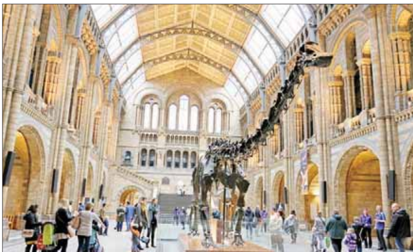
تجد في المتحف أهم الجسومات الحيوانية

وكما هو الحال بالنسبة لكافة المتاحف في منطقة جنوب كينزينغتون، لا توجد رسوم لزيارة متحف التاريخ الطبيعي. وليس من المستغرب أن يكون المتحف مشغولاً طيلة أيام العطلة المدرسية، وفي عطلة نهاية الأسبوع في الشتاء، عندما تبحث العائلات عما تشغل به اهتمام الأطفال.