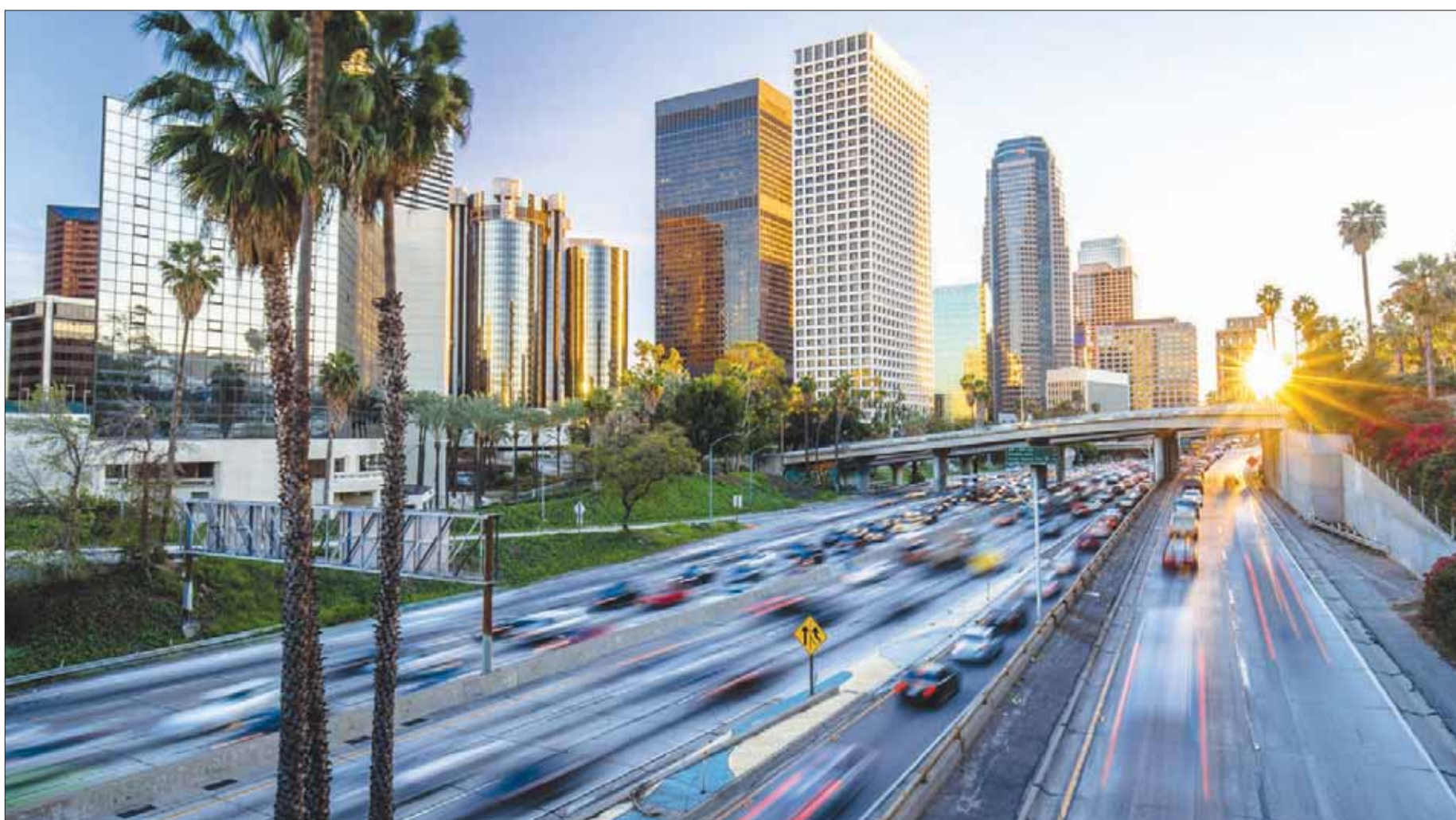
ارتفع المعدل السنوي لمشروعات الإسكان في الولايات المتحدة إلى 1,290 مليون وحدة خلال أكتوبر الماضي

جاء الارتفاع المستمر للمبيعات مفاجئاً للمحللين، الذين كانوا يتوقعون تراجع مبيعات المساكن القائمة إلى ما يعادل 5,30 مليون وحدة سنوياً خلال الشهر الماضي. وذكرت الوزارة أن مبيعات المساكن الجديدة ارتفعت خلال الشهر الماضي بنسبة 18,9 في المائة بما يعادل 667 ألف مسكن سنوياً مقابل 561 ألف مسكن سنوياً، وفقاً للبيانات المعدلة في الشهر الماضي. في أغسطس (آب) الماضي، وكان ذلك الارتفاع الكبير قد فاجأ المحللين الذين كانوا يتوقعون تراجع المبيعات إلى ما يعادل 555 ألف مسكن خلال سبتمبر الماضي، مقابل 560 ألف مسكن وفقاً للتقديرات الأولية للشهر السابق.