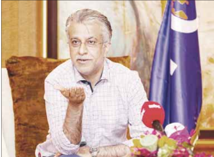
الشيخ سلمان آل خليفة («الشرق الأوسط»)

وأضاف: «يأتي هذا التطبيق كأحد تطورات، من أجل تأكيد التزامنا مع الاتحاد الآسيوي لكرة القدم عام 2013، لحماية نزاهة كرة القدم، وتأكيد جدية الاتحاد الآسيوي في تمكين الجماهير وأطراف اللعبة من المشاركة.»