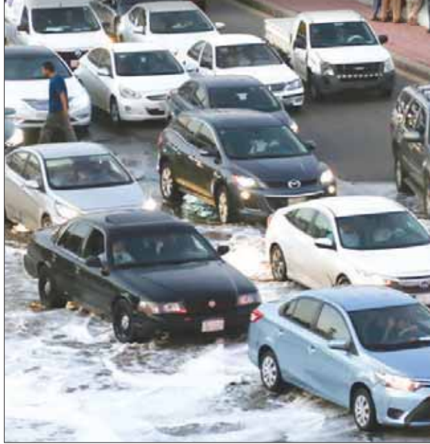
تسببت سيول جدة في إرباك حركة المرور في المدينة.. وفي الإطار رجل يقف على رصيف أحد الشوارع الغارقة

مراجعين، إضافة إلى ذلك انقطاع التيار الكهربائي عن عدد من المنازل. وأصدرت المديرية العامة للشؤون الصحية في محافظة جدة بياناً أكدت فيه أن طوارئ مستشفيات المحافظة استقبلت 29 حالة، منها 8 حالات صعق كهربائي، وحالة وفاة واحدة، في حين تراوحت بقية الحالات بين سقوط وحوادث مرورية في مواقع متفرقة نتيجة الأمطار، مشيرة إلى أنها فُحلت خطط الطوارئ مع استمرار هطول