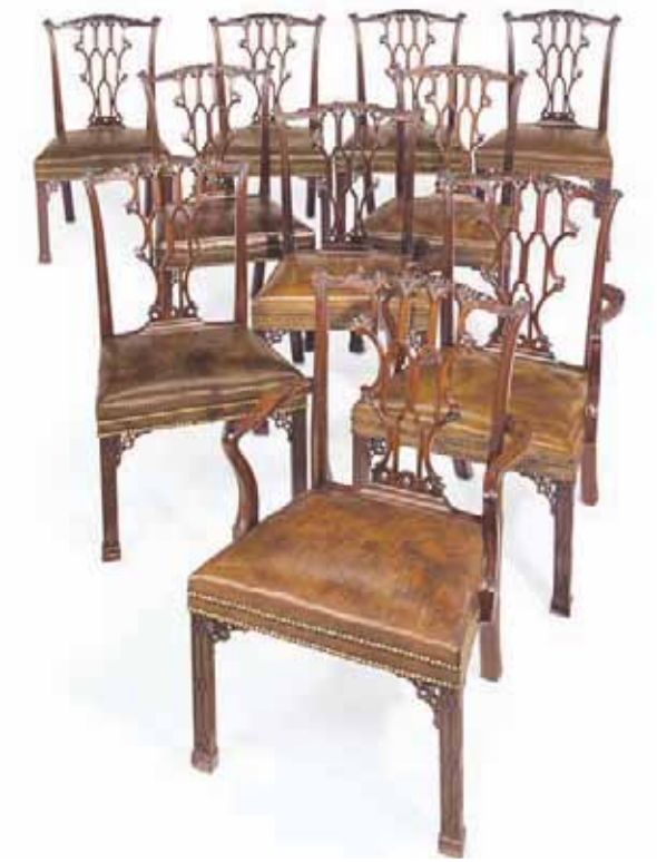
مقاعد من الماهاغوني من عام 1765