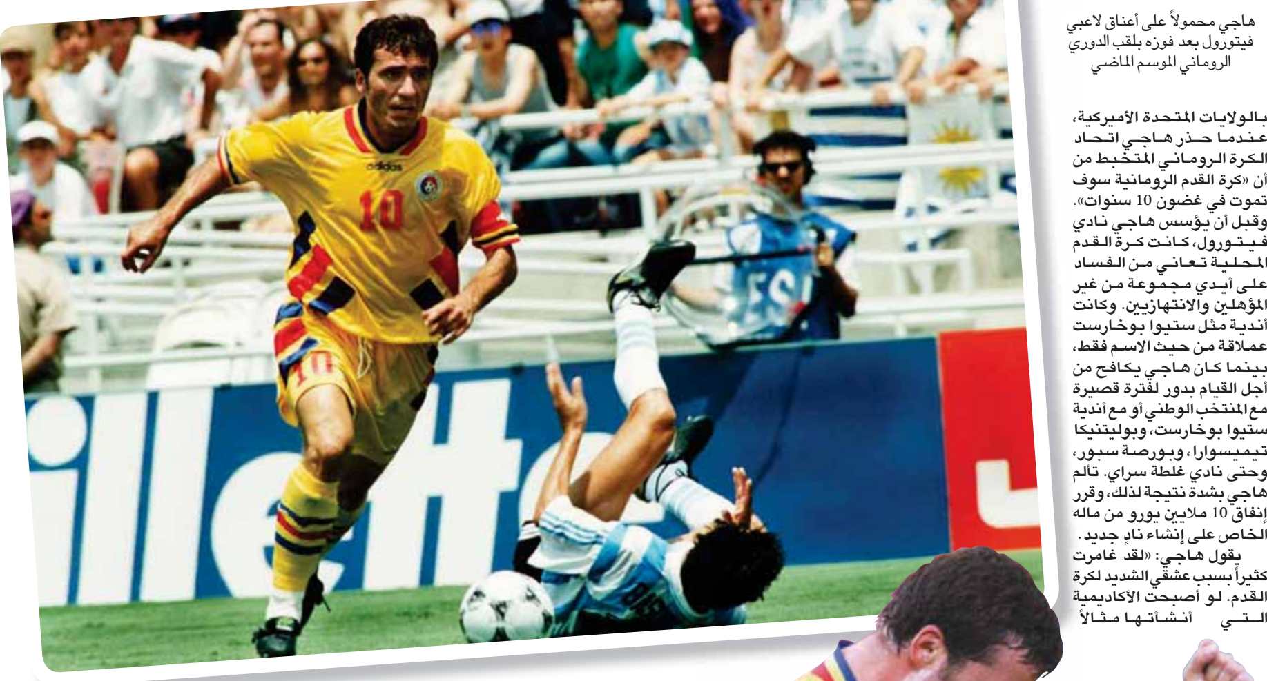
هاجي في مونديال 1994 حيث تأملت رومانيا دور الثمانية (الشرق الأوسط)

للغاية من المباريات، وتستنفد طاقة اللاعبين عندما يصلون للمسابقات النهائية. مستوى الدوري الإنجليزي الممتاز مرتفع للغاية ويخوض اللاعبون عدداً كبيراً من المباريات؛ لذا لا يكونون في كامل لياقتهم عند انطلاق البطولات. دائماً ما يبدأ المنتخب الإنجليزي بشكل جيد، ثم يسقط. لديهم لاعبون رائعون للغاية، لكنهم لا يكونون في كامل لياقتهم الذهنية والبدنية».