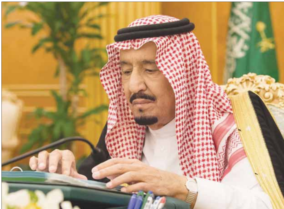
خادم الحرمين الشريفين الملك سلمان بن عبد العزيز لدى ترؤسه جلسة مجلس الوزراء (واس)

12- 1438هـ، الموافقة على تنظيم مكتب الإدارة الاستراتيجية بمجلس الشؤون الاقتصادية والتنمية. وبعد الاطلاع على ما رفعه رئيس مجلس إدارة الهيئة العامة للسياحة والتراث الوطني، وكذلك الاطلاع على التوصية المعدة في مجلس الشؤون الاقتصادية والتنمية رقم: 7 - 5 - 39 - د وتاريخ 27- 1- 1439هـ، قرر مجلس الوزراء