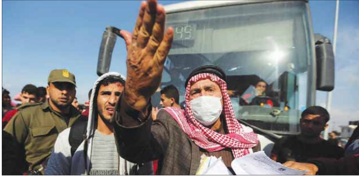
مسن فلسطيني خارج معبر رفح الحدودي جنوب قطاع غزة يطالب بالسفر للعلاج أول من أمس

وطنية فلسطينية بقطع حماس علاقاتها مع إيران، العدو اللدود للدولة العبرية. ويشكل الانقسام الفلسطيني واحدة من العقبات الرئيسية في طريق السلام. فعودة السلطة الفلسطينية، الجهة المحاوره لإسرائيل، إلى غزة يمكن أن يفتح آفاق تسوية. وقد أنجزت حماس في الأول من نوفمبر (تشرين الثاني) الماضي خطوة مهمة عبر تسليم السلطة مسؤولية المعابر مع إسرائيل ومصر، لكن الرئيس محمود عباس لم يرفع حتى الآن العقوبات المالية التي فرضها في الأشهر الماضية لإجبار حماس على التراجع، وهو ما ينتظره سكان غزة بفارغ الصبر. كما أن قضيتي العسكري لحماس ما زالت عالقتين، وتستبعد السلطة الفلسطينية تولي المسؤوليات المدنية في غزة قبل أن تسلم الأمن. وقالت حماس في بيانها الأخير «في بيان الأحمد، إنه لا يمكن لها أن تقوم بمهامها