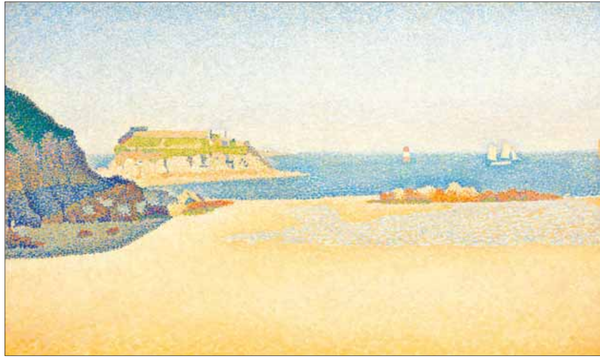
لوحة بريشة بول سينيكا من عام 1888

أهنته على بيع لوحة دافنشي، يقول: «كم هذا لطيف منك، كان أمراً رائعاً أن أكون أنا القائم على المزاد». يجيب: «هل تعتقد أن يقهر هذا السعر ونحن أحياء؟ أذكر في عام 1987 عندما باعت كريستيز لوحة (زهور عباد الشمس) لفان جوخ، كان الشعور حولي في غرفة المزاد رائعاً، لم تصدق أنفسنا أن يباع عمل فني 25 مليون جنيه إسترليني، وساورني الشعور بنفسه في المزاد الأخير بعد واخترت الدار مجموعة الجمهور بقوة وهي أن ربيع المزاد سيوجه بالكامل للأعمال الخيرية، وهي مؤسسات معروضها الأول في هونغ كونغ في 24 - 27 نوفمبر (تشرين الثاني) الحالي. والمعروف أن ديفيد روكفلر قد أعلن عن تخصيص معظم