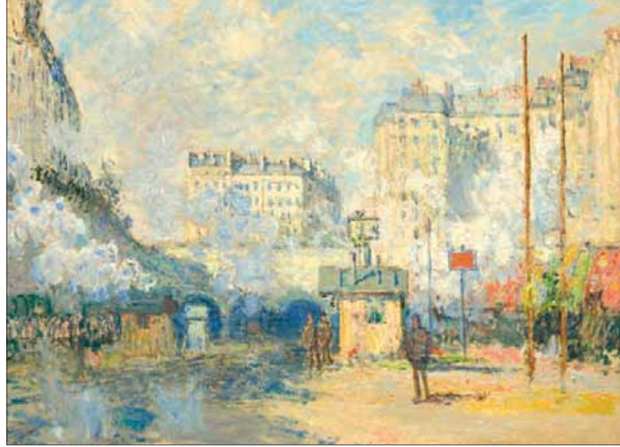
لوحة «خارج محطة سان لازار» لكلود مونيه رسمت في باريس عام 1877