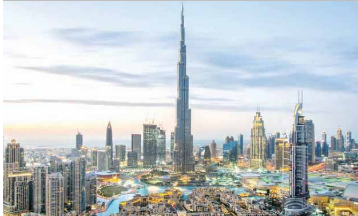
دبي الصاعدة سياحياً

هونغ كونغ - بانكوك - لندن - سنغافورة - ماكاو - دبي - باريس - نيويورك - شينجن في الصين - كوالالمبور - فوكيت التايلاندية - روما - طوكيو - تبيي اليابانية - إسطنبول - سيول الكورية - غوانجو - براغ - مكة المكرمة - ميامي - دلهي - مومباي - برشلونة - بنايا التايلاندية - شنغهاي - لاس فيغاس - ميلان - أمستردام - أنطاليا - فيينا - لوس أنجلوس - كنكون المكسيكية - أوساكا - برلين - أغرا الهندية - هوشي منه - جوهانسبرغ - البنديفة - مدريد - أورلاندو - الرياض - جوهانسبرغ - المايليزية - جبلن - فلورانس - تشيناي الهندية - موسكو - أثينا - جيبور - بكين - دنيسار الإندونيسية - تورينكو - هانوي - سيدني - سان فرانسيسكو - بودابست - هالونغ الفيتنامية - بونتا كانا في الدومينيك - الدمام - ميونخ - جوهانسبرغ - لشبونة - جزيرة بينانغ الماليزية - الدوحة - كوينهاغن - إيراكليون اليونانية - القدس - أدبرن التركية - فوم بين الكمبودية - سانت بطرسبرغ - جوجو الكورية - كويتو - تشيانغ ماي التايلاندية - وارسو - كاراكوف - ميلبورن - تل أبيب - مراكش - بروكسل - أوكلاند - فانكوفر - جاكارتا - فرانكفورت أرتفين - غولبن الصينية - استوكهولم - كالكا - بيونس إيريس - تشيبا اليابانية - سيدني ريب الكمبودية - نيس - مكسيكو سيتي - ليما - تايتشانغ اليابانية - رودس - واشنطن دي سي - أبوظبي - كولومبو. ويلاحظ كثرة عدد المدن التايلاندية والصينية، وقلة المدن العربية والأميركية.