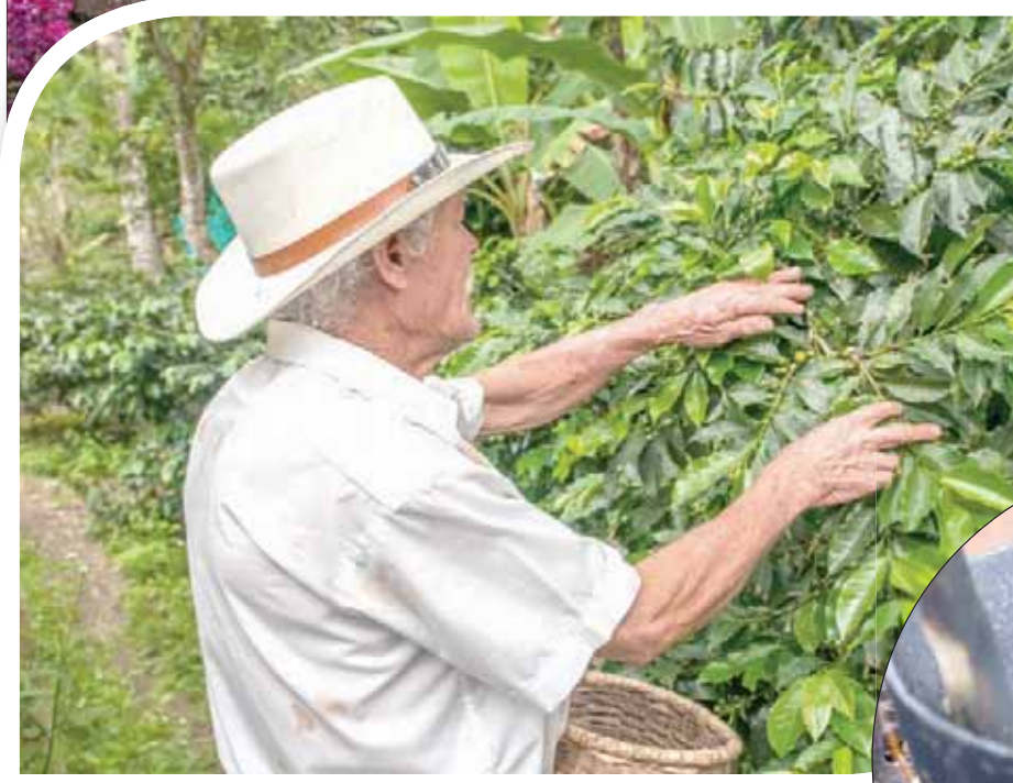
مزارع يقوم بقطف حبوب القهوة

أهل البلاد أم من الأجانب. من الأنشطة المفضلة في تلك المنطقة صعود الشوارع المنحدرة المرصوفة بالحصى للوصول إلى نقطة في البلدة يمكن منها التمتع بمنظر الجبال المكسوة باللون الأخضر، الذي يشع سلاماً، وفي الوقت نفسه يحمل قوة الطبيعة.