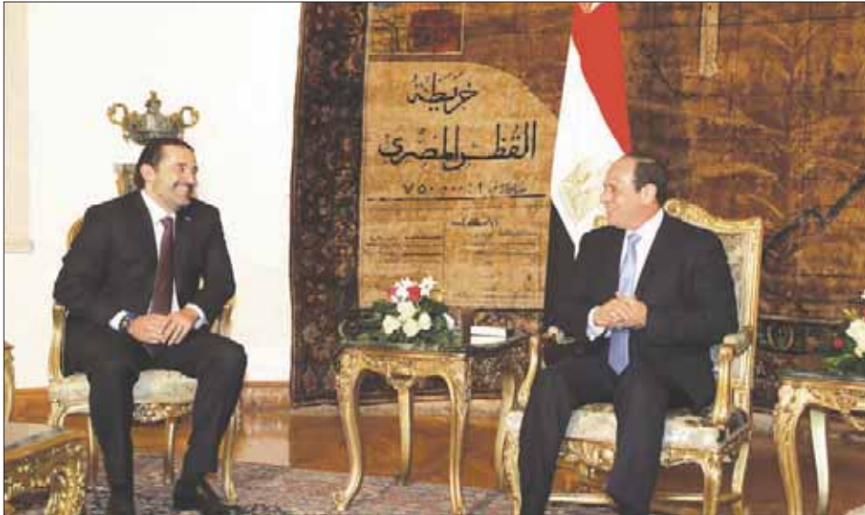
الرئيس المصري عبد الفتاح السيسي لدى لقائه رئيس الوزراء اللبناني المستقيل سعد الحريري في القاهرة أمس

إزاء مستجدات الموقف. إلى ذلك انتهت الاستعدادات الشعبية لاستقبال رئيس الحكومة المستقيل سعد الحريري في منزله في «وسط بيروت» بعد مشاركته في احتفال عيد الاستقلال، بينما بدأ رسمياً البحث في مرحلة بات يطلق عليها تسمية «ما بعد الاستقالة» والسنياريوهات التي من المتوقع أن تراقفها.