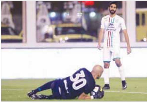
خسارة الاتفاق من أحد أثار ردود فعل غاضبة من أنصار الفريق (الشرق الأوسط)