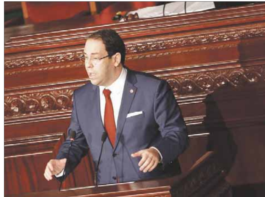
رئيس الحكومة التونسية يوسف الشاهد متحدثاً أمام البرلمان أمس