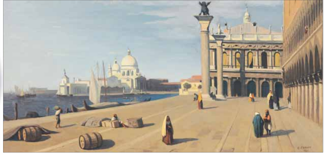
لوحة «فينيسيا» لجان بابتيست كورو من عام 1845

الطابور الطويل الذي امتد خارج الدار الأسبوع الماضي وكان الجو بارداً وتحدثت مع أحد الواقفين لأعترض له عن طول مدة الانتظار. واجابني قائلاً إنه «قضى فترة الانتظار في مناقشات مع الأشخاص الآخرين في الطابور، ناقشوا فيما بينهم السبب الذي دعاهم للوقوف وهو تلك اللوحة، وهو أمر باهر فكل شخص كان هناك سبب لرؤية اللوحة سواء من دافع ديني أو فني أو حتى مجرد الفضول، أن يقف شخص لساعة ونصف في الجو البارد أدهشني جداً. وكذلك ردود الفعل بعد إتمام عملية البيع كانت لطيفة جداً».