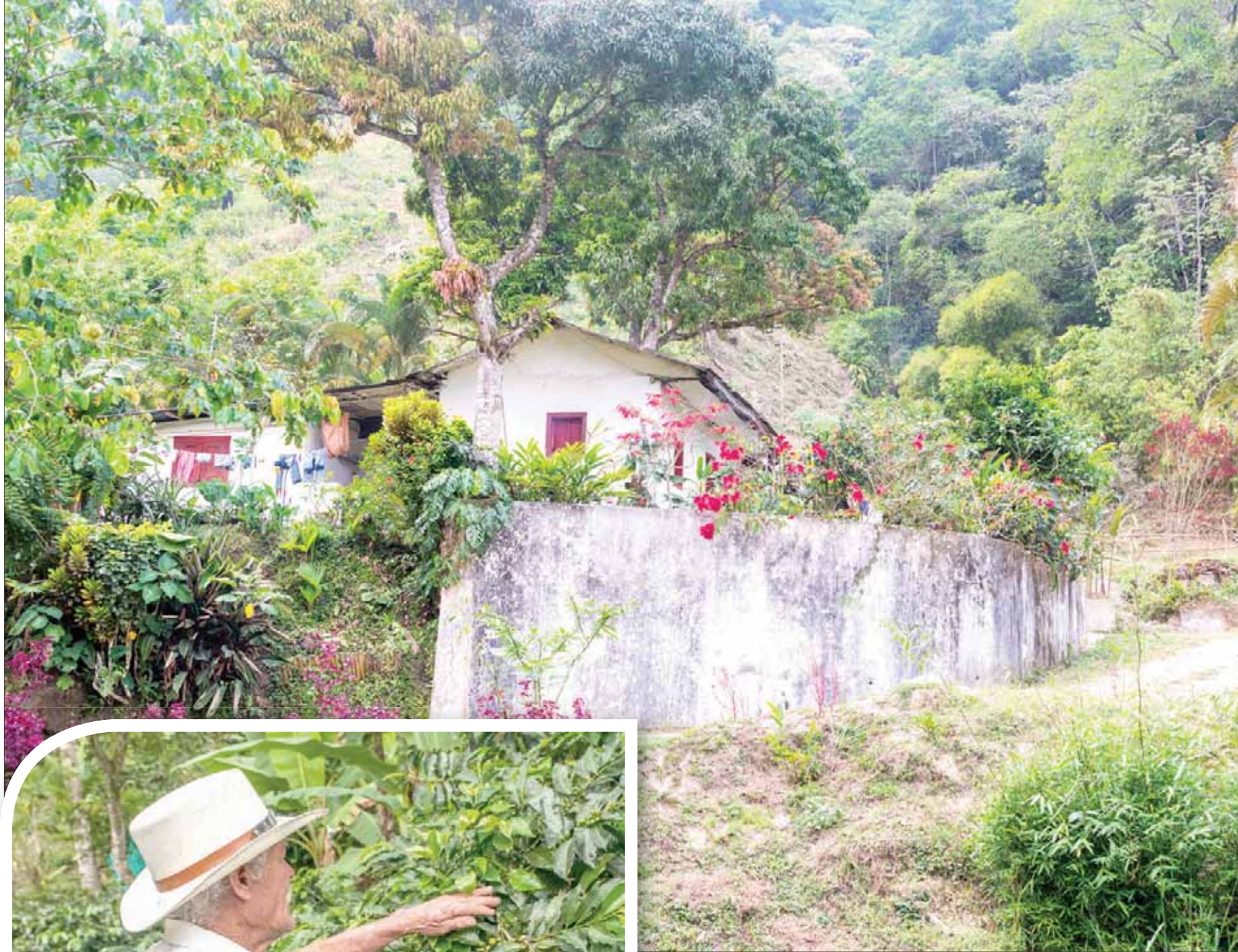
مزارع القهوة في كولومبيا أصبحت قبلة السياح