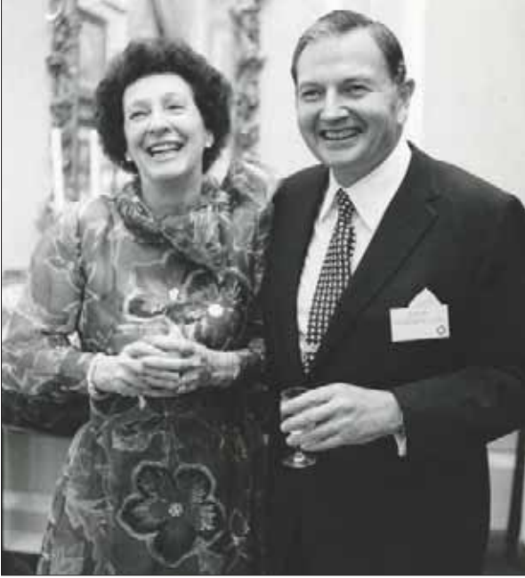
بيغي وديفيد روكفلر