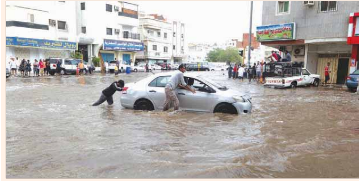
متطوعين يساعدون السيارات العالقة في أحد شوارع مدينة جدة

الرحلات القادمة والمغادرة لمطار الملك عبد العزيز لفترة قصيرة، أغقت الخطوط الجوية السعودية المسافرين على متن رحلاتها الذين يرغبون في تغيير حجوزاتهم أو إلغائها، واسترداد تذاكرهم من جميع القيود والغرامات تقديراً لظرفهم. وتابع الأمير خالد الفصيل مستشار خادم الحرمين الشريفين أمير منطقة مكة المكرمة الحالة المطرية على منطقة مكة المكرمة من