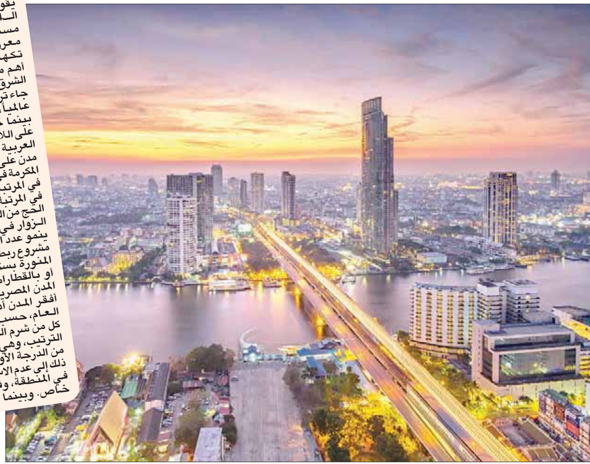
هونغ كونغ الرائدة في السياحة حالياً

لندن تتراجع من حيث المرتبة ولكنها تبقى من بين أهم المدن السياحية