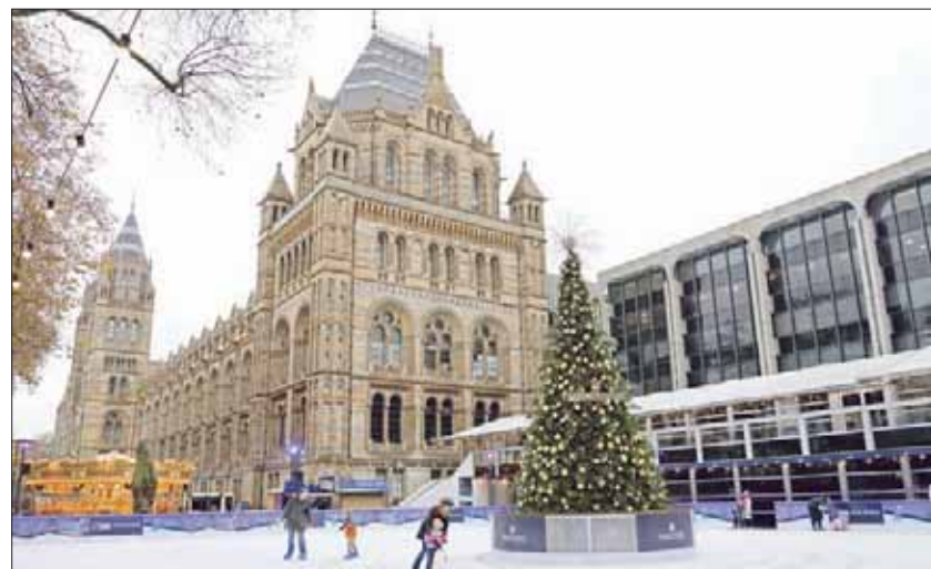
حلقة ترنح تقام في الحديقة فترة أعياد الميلاد

المدرسية للمتحف. على سبيل المثال، هناك لوحة مفيدة للغاية توضح التركيب العظمي لأحد الأفيال، وكيف أن العمود العظمي الصلب للفقرات، مثل الساقين، يملك القدرة على دعم الوزن الهائل للحيوان، غير أنه لا يمنحه القدرة على خفة الحركة أو القفز. إن استخدام الهياكل العظمية والأصداف يساعد في منح الزائرين