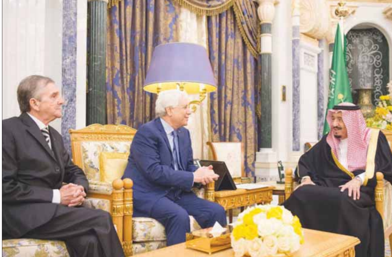
خادم الحرمين الشريفين خلال لقائه وزير العدل الجزائري الذي سلمه رسالة من رئيس الجمهورية عبد العزيز بوتفليقة