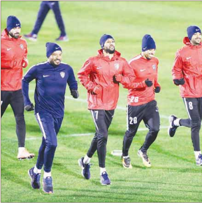
جانب من تدريبات فريق الهلال في طوكيو

الحالي لمشاركة عدد كبير من لاعبي الأهلي مع المنتخب السعودي الأول في فترات طويلة ومتقطعة، ووصل عددهم إلى 11 لاعباً دفعة واحدة خلال الفترة الأخيرة بجانب الثاني العربي السوري عمر السومة والمصري محمد عبد الشافي؛ لانضمامهما لمنتخبي بلديهما.