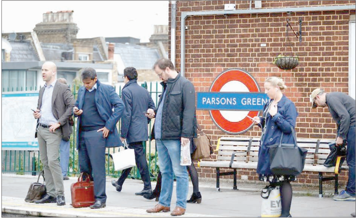
محطة بارسونز غرين التي تعرضت لهجوم إرهابي أفيد افتتاحها بعد انتهاء التحريات الجنائية

على سعيد آخر، صرحت كبيرة مفتشي شرطة لندن، سارة تورنتون، بأن الحرب التي تخوضها بلادها على الإرهاب تسببت في «ضغوط غير محتملة» على شرطة