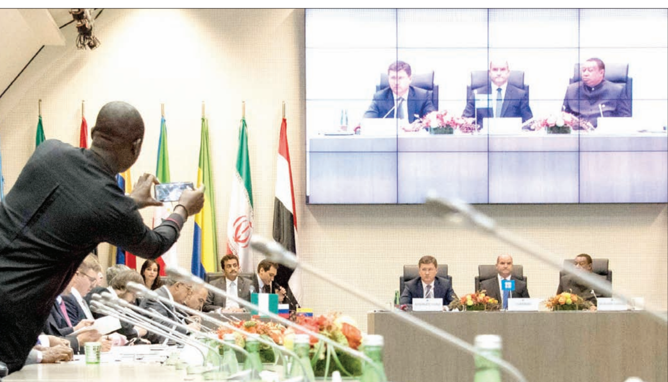
جانب من اجتماعات «أوبك» في فيينا أمس