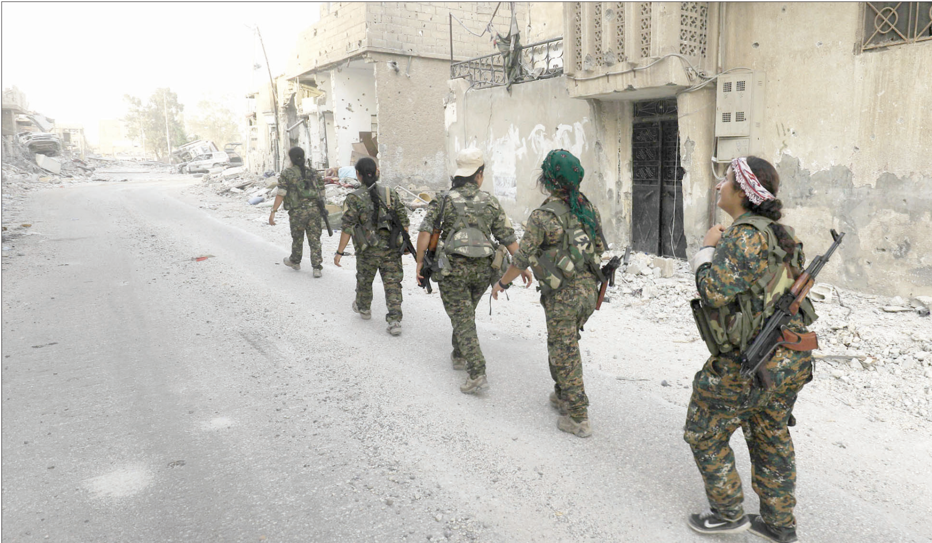
مقاتلات من «قوات سوريا الديمقراطية» في الرقة

يعد التنظيم لتنفيذ هجمات معاكسة، محاولاً إيقاع أكبر عدد من الخسائر البشرية في صفوف المهاجمين». وأوضحت المصادر نفسها، أن التنظيم يحاول استعادة السيطرة على المناطق التي خسرتها منذ عبور قوات النظام لنهر الفرات في 18 سبتمبر (أيلول) الحالي، وأن المعارك أسفرت عن سقوط خسائر بشرية مؤكدة في صفوف طرفي القتال. وكانت قوات النظام والمليشيات الموالية لها تمكنت من السيطرة على قرى وبلدات عند الضفاف الغربية لنهر الفرات، بريف دير الزور الشمالي الغربي، حيث توسعت سيطرتها لتصل إلى أكثر من 100 كلم، حيث تقدمت وأحكمت سيطرتها على كامل الضفاف الغربية للفرات والريف الشمالي الغربي لمدينة دير الزور.