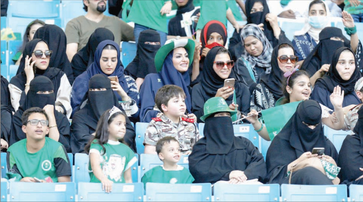
... في قسم العائلات بالاستاد ويبدو اللون الأخضر بقوة