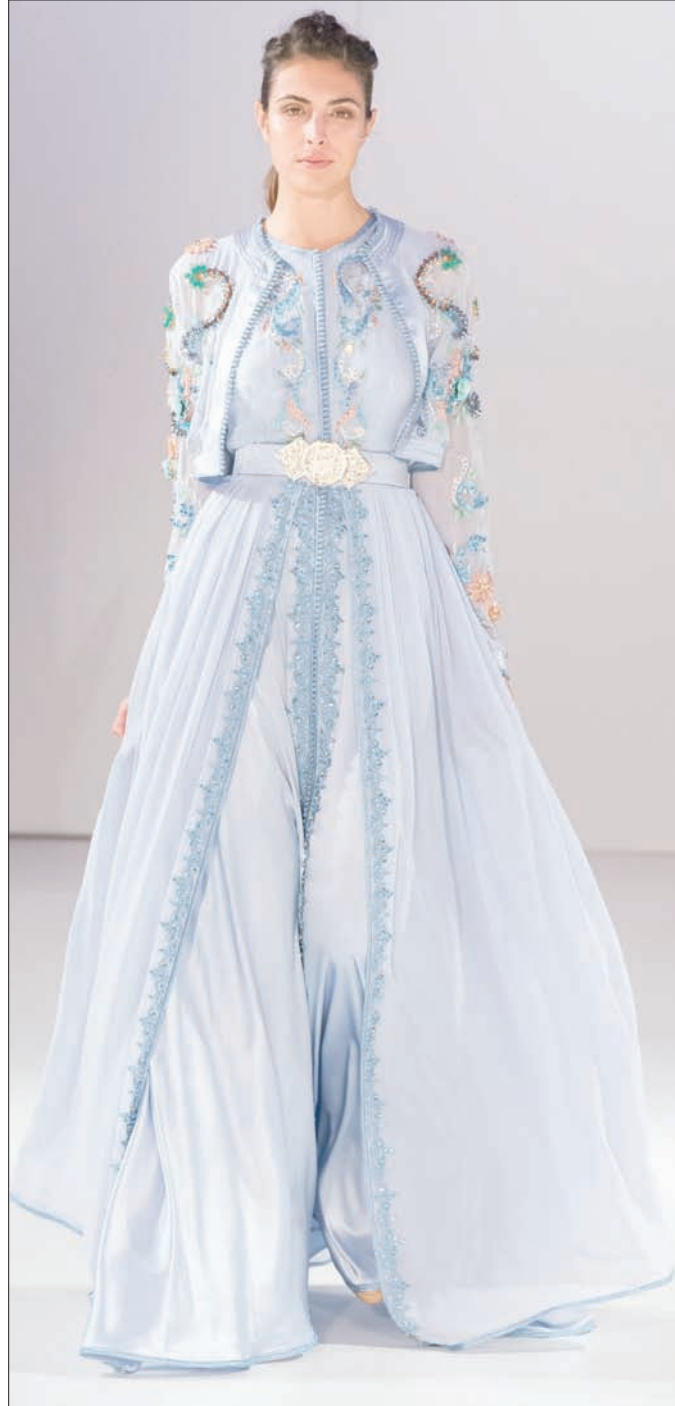
من تشكيلة «روميو كوتور لربيع وصيف 2018»