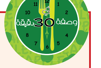
طبق كاري الدجاج

ويمكن عن طريق بعض التطبيقات على الهاتف الجوال الاستعانة بخدمات توصيل الأطعمة إلى المنازل فوراً. فليس هناك حاجة للاتصال الهاتفي كما أن هناك عشرات التطبيقات التي يمكن الاستعانة بها وفقاً للدول التي يعيش فيها المتصل. في المدن الأمريكية الرئيسية يمكن استخدام تطبيق يسمى