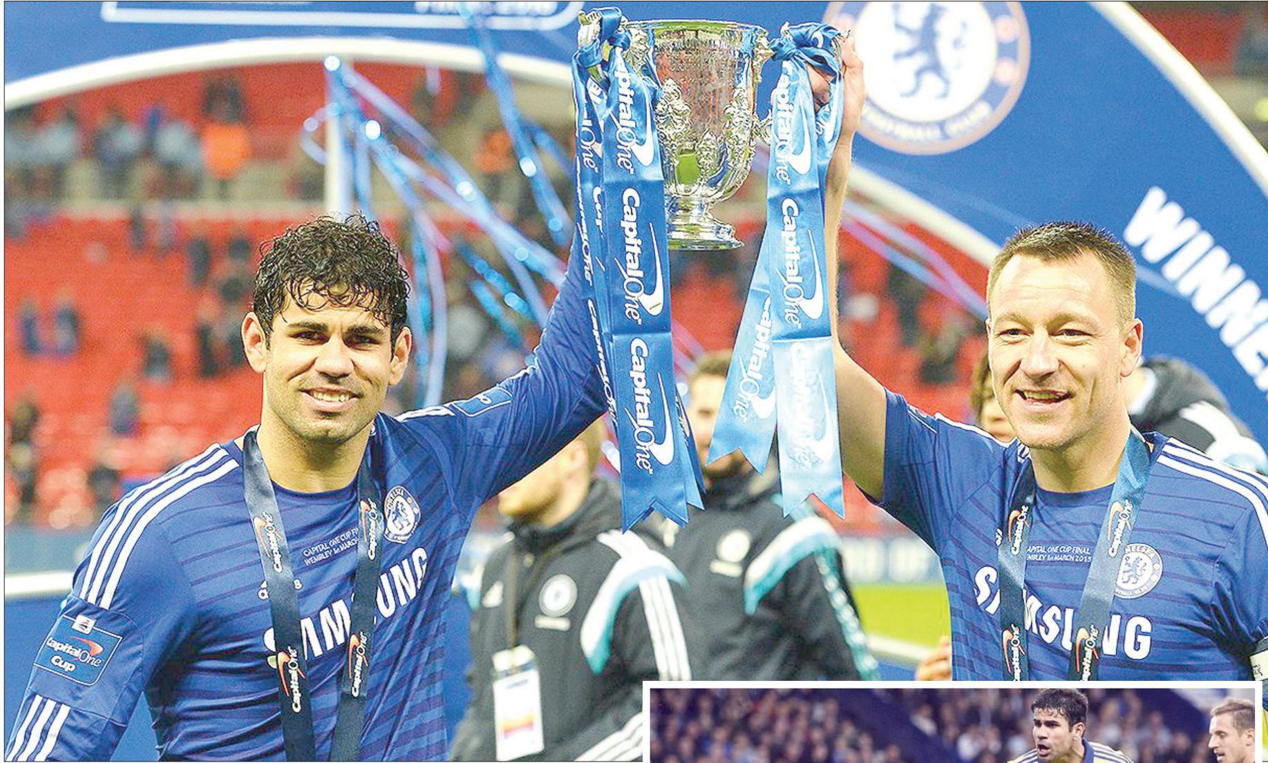
لعب دوراً حاسماً في فوز تشيلسي بالدوري الإنجليزي مرتين

هذه هي الطريقة التي يعتمد عليها كوستا والتي ساعدته على إحراز أهداف حاسمة خلال المواسم الثلاث التي قضاها في «ستامفورد بريدج» والتي سجل خلالها 52 هدفاً في 89 مباراة في الدوري الإنجليزي الممتاز وحصل على لقب الهداف في هذه المواسم الثلاثة ولعب دوراً حاسماً في فوز فريقه بالدوري الإنجليزي الممتاز مرتين. وكان كوستا يقود الخط الأمامي لتشيلسي بكل شراسة ومكر ودهاء خلال هذه المواسم الثلاث، والتي حصل خلالها على 33 بطاقة صفراء، بالإضافة إلى بطاقة حمراء واحدة، بعد حصوله على إثنين في مباراة الفريق أمام إيفرتون في كأس الاتحاد الإنجليزي. وقدم المهاجم البالغ من العمر 28 عاماً أداءً لافتاً من تشيلسي، وكانت المباراة الأخيرة له مع الفريق في نهائي كأس الاتحاد الإنجليزي في مايو (أيار) الماضي قد شهدت تالفاً كبيراً أيضاً للاعب الذي أحرز في تلك المباراة هدفه رقم 58 والأخير له مع البلوز. ووصفه المدير الفني الحالي مانشستر يونايتد جوزيه مورينيو بأنه لاعب متكامل، كما أكد كونتي على أنه لاعب محوري في الطريقة التي يلعب بها الفريق. وجاء وقت بدأ واضحاً خلاله أن كونتي بدأ ينجح في تغيير سلوكيات اللاعب لدرجة أنه لعب 10 مباريات دون الحصول على بطاقة حمراء واحدة، كما لم يتعرض للإيقاف سوى في مباراة واحدة قرب نهاية