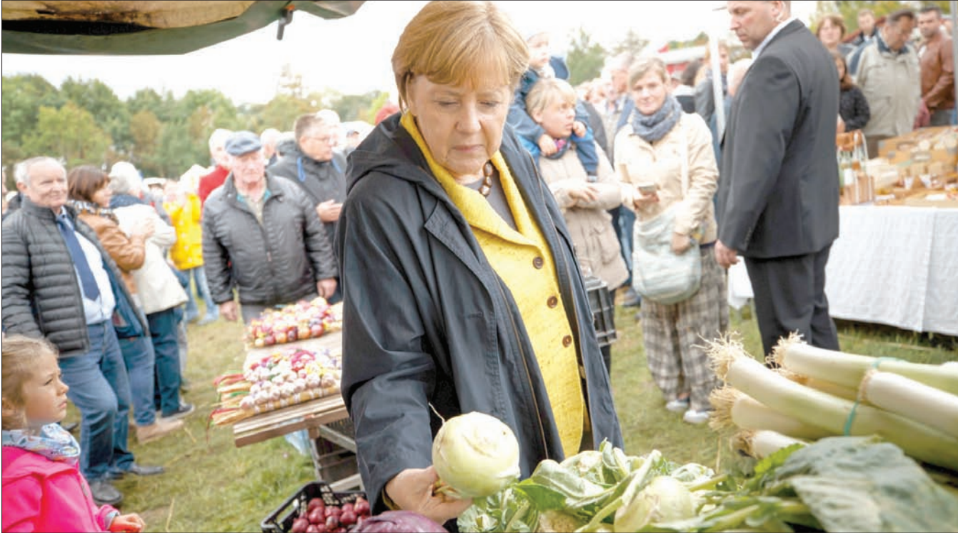
المستشارة الألمانية أنجيلا ميركل خلال زيارتها مزرعة في ميكلينبورغ - فوريوم شرق ألمانيا أمس

اختتمت المستشارة أنجيلا ميركل ومنافسها الاشتراكي الديمقراطي مارتن شولتز، أمس، حملتهما الانتخابيتين في معقليهما بعد حملة مضنية ترافقت نهائيتها مع صعود اليمين المتطرف. وتوجهت ميركل (63 عاماً)، صباح أمس، إلى مقر حملتها في برلين، وقالت لأنصارها إن «كل صوت له قيمته» في سعيها لولاية رابعة بعد 12 عاماً من حكم ألمانيا. ومن المتوقع أن تتوجه ميركل بعد ظهر اليوم إلى دارلترها في منطقة ميكلينبورغ - فوريوم في شرق ألمانيا، لكنها لم تختر المناطق الأسهل، حيث قررت الذهاب إلى غرفسفالده التي هزم فيها حزبها أمام حركة «البدل من أجل ألمانيا» اليميني المتطرف في انتخابات المناطق العام الماضي.