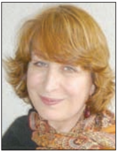
إنهام كجيه جي