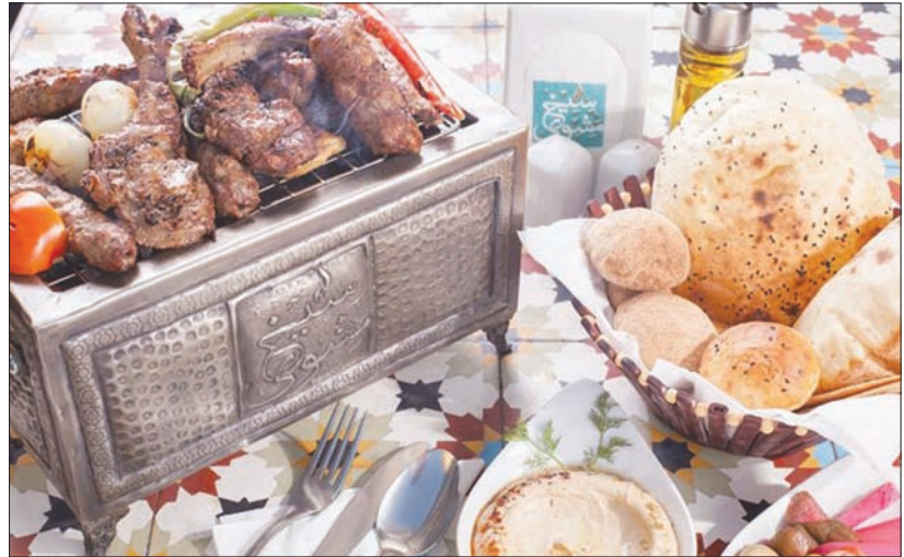
الخبز يقدم طازجا ومخبوزا بالطريقة المصرية