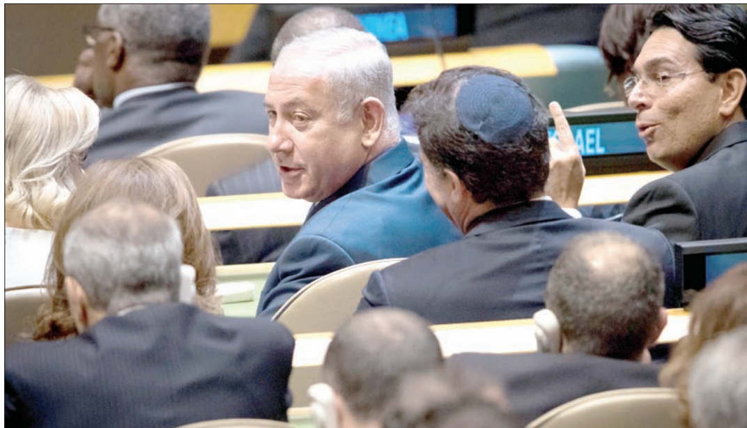
رئيس الحكومة الإسرائيلية بنيامين نتنياهو لدى حضوره اجتماعات الجمعية العامة في نيويورك مؤخراً

قال مسؤول كبير في الشرطة الإسرائيلية إن الشبهات ضد رئيس الوزراء الإسرائيلي بنيامين نتنياهو تتعزز في الفترة الأخيرة. ونقل موقع صحيفة «معاريف» الإسرائيلية عن المسؤول، الذي لم يذكر اسمه، قوله إن «الشبهات ضد نتنياهو تعززت بشكل كبير بعد الشهادات الأخيرة ضده». فيما قالت وسائل إعلام إسرائيلية إن شهادة رجل الأعمال أرنون ميلتشين زادت الضغوط على نتنياهو في الملف الأول المعروف بالملف «1000»، والمتعلق بشبهات حول تلقي هدايا ورتشي. وقال مصدر إسرائيلي إن الاعتقاد بتورط نتنياهو بتهمة «الاحتيال»، وربما «الرشوة» يعزز كثيراً بعد شهادة ميلتشين حول تلقي نتنياهو عدة هدايا مقابل تسهيل خدمات.