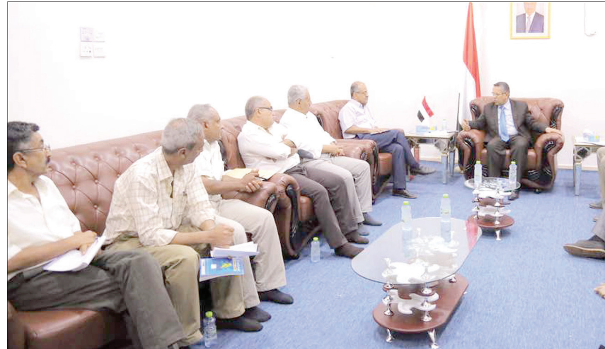
بن دغر لدى استقباله ممثلي اعصامات موظفي تعز بقصر المعاشيق في عدن (سبأ)

وبمباغتة فجر السبت، على مواقع الجيش الوطني في الصبار وتم التصدي للهجوم وإجبارها على التراجع بعد سقوط قتلى وجرحى منهم، ما جعلهم ينتقمون من الجيش الوطني من خلال قصفهم من مواقع تمركزهم في الحود من على قري الصبار بجميع أنواع الأسلحة، علاوة على قصف الجيش الوطني على مواقع الميليشيات الانقلابية في قرية العقبية، وأنباء عن سقوط قتلى وجرحى في صفوف الانقلابيين. وحسب أركان حرب اللواء 35 مدرع العقيد ركن عبد الملك الأهل، فقد أكد في تصريح له نقل عنه مركز إعلام اللواء، أن وحدات من اللواء 35 مدرع شنت هجوماً واسعاً على مواقع متمركز فيها ميليشيات الحوثي والمخلوع الانقلابية عقبه اندلاع معارك عنيفة استُخدمت فيها مختلف أنواع الأسلحة وبأسناد جوي من طيران التحالف العربي تمخّنت خلالها قوات الجيش الوطني من السيطرة على قرية وسوق الصبار، ما جعل عناصر الميليشيات الانقلابية تفر هاربة من أمام القوات بعد الضربات الموجعة والمكثمة التي تلقوها وكبدتهم عشرات القتلى والجرحى بينهم قيادات للميليشيات ويكنى بـ«أبو كهان». وعلى الصعيد، تشهد جبهة حيفان الريفية، جنوب تعز، مواجهات عنيفة شنت قوات اللواء 35 مدرع هجوماً عنيفاً على مواقع