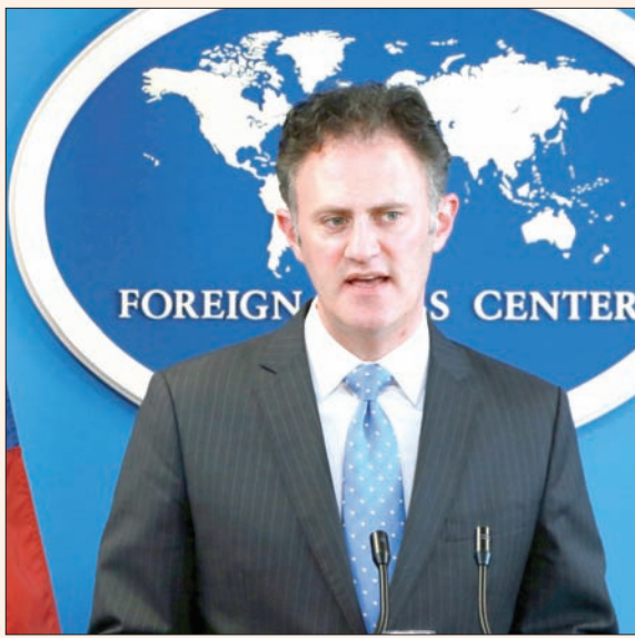
السفير الأمريكي في وزارة الخارجية سيليز

الثانية فهي للتعامل مع الإرهابيين المحليين الذين لم يسافروا إلى منطقة الصراع ولم ينضموا إلى جماعة إرهابية لكنهم يستوحون أفكار العنف ويتحولون إلى إرهابيين. وأوضح سيليز أن هذه المبادرة ترعاها المغرب والولايات المتحدة وتهدف لاستكشاف العوامل التي تدفع الناس ليصبحوا إرهابيين محليين وكيفية التعرف عليهم قبل أن يتمكنوا من تنفيذ عملية إرهابية. ويقول السفير سيليز «تطرف الإرهابيين المحليين تختلف عن المقاتلين الأجانب ولذا سنضع مجموعة جديدة من المبادرات تمكن الحكومات والقطاع الخاص من استخدامها لمعالجة هذا التهديد بشكل فعال لأن الإرهابيين يتعلمون من إخطائهم وعلينا أن نتعلم وتتكيف».