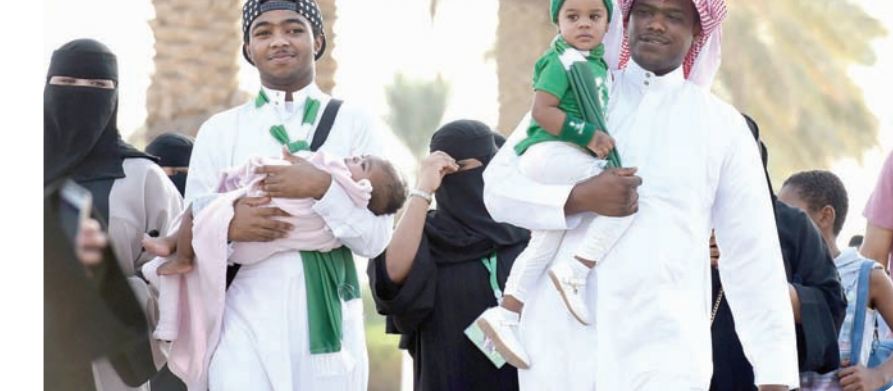
عائلات سعودية في طريقها إلى ساحات الاحتفال باليوم الوطني بالرياض

مختلفاً على الكورنيش وشهد إطلاق عروض الوسائط المتعددة المرئية المائية «Water Hologram»، وهي بمنزلة «حكاية بانورامية»، تروي تاريخ وثقافة وإنجازات هذا الوطن الغالي، كما أنها تحية لأبطال وشهداء الحد الجنوبي، الذي كان لهم نصيب من الاحتفال بهذا اليوم.