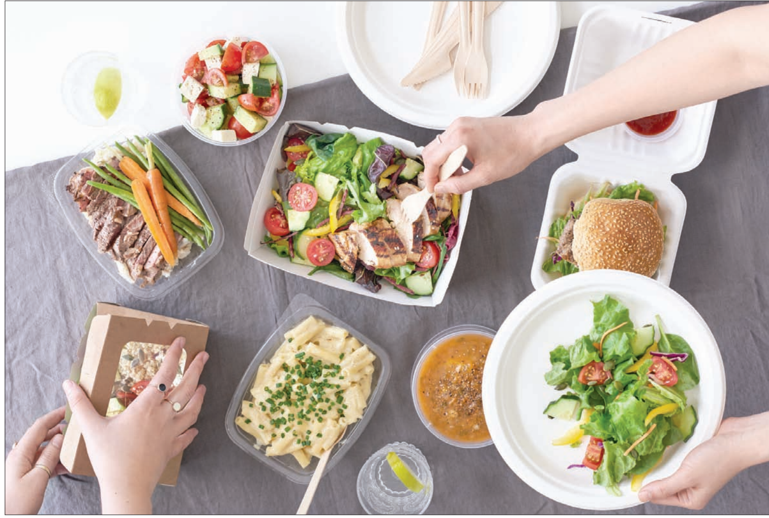
لندن، «الشرق الأوسط»

«فريش فيتنس فود»: وهي تمنح المشترك فرصة اختيار قائمة الطعام التي تروق له وحساب عدد السعرات التي يريدتها. ويتم استخدام المعلومات من فريق متخصص في الحميات الغذائية لتدبير برنامج غذائي مناسب للمشارك. ويتم توصيل الوجبات يومياً. وتنفرد الشركة بأنها تعتمد على التنوع وعدم اعتماد حميات كل ثلاثة أسابيع ولا يتماثل طعام يومين. وهي توفر وجبات صحية مثل الدجاج المشوي مع الفلفل الأخضر وصلصة الرمان والأسماك في الفرن. وبخلاف هذه الخدمات لتوصيل الوجبات إلى المنازل يمكن أيضاً الاستعانة بأحد خدمة ظهرت في فرنسا وهي الاستعانة بطباخة ماهرة تصل إلى المنزل لإعداد الوجبات المفضلة حسب الطلب. وهي تعتمد على السيدات العجائز من ذوات الخبرة من اللاتي لا تقل أعمارهن عن 85 عاماً لتعودت عليه وتفضله الأجيال الجديدة. وتسمى هذه الخدمة في فرنسا «خدمة الجدات» نظراً لسن المشاركات فيها. وتجهز الجدة الوجبات من المكونات الموجودة في المنزل وتقدم الوجبة بغسل الصحون قبل مغادرتها. ويمكن طلب هذه الخدمة بغرض تعليم كيفية طهي الوجبات المفضلة. وهو موجة تعتبر عودة إلى أصول المطبخ التقليدي. ولم تصل هذه الخدمة إلى لندن بعد.