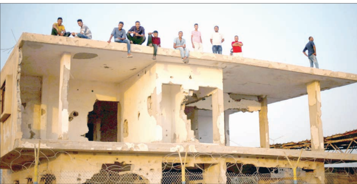
فلسطينيون يترقبون وصول أقاربهم عبر معبر رفح من رحلة الحج جنوب غزة