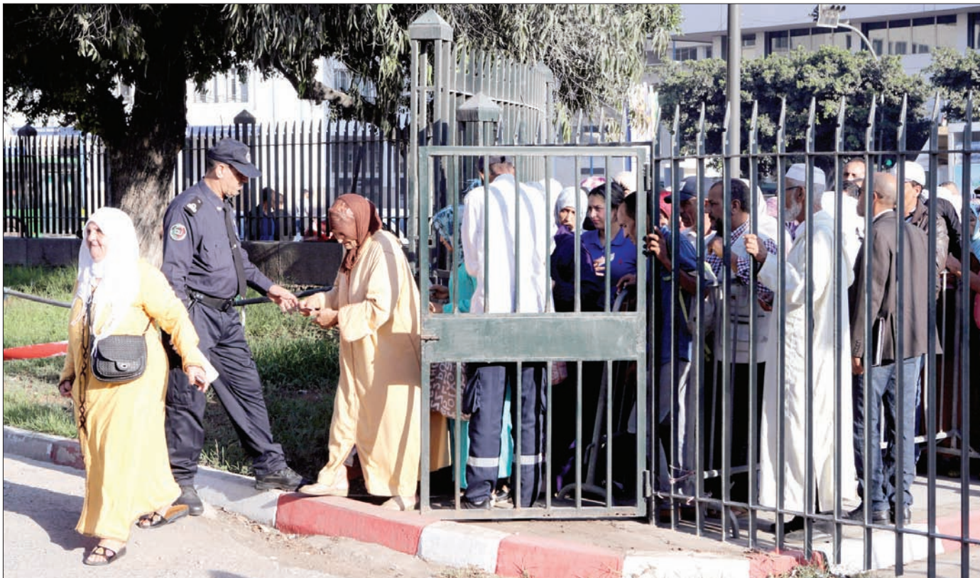
شرطي يدقق في هويات أقرباء معتقلي الحراك قبل عقد المحكمة في الدار البيضاء