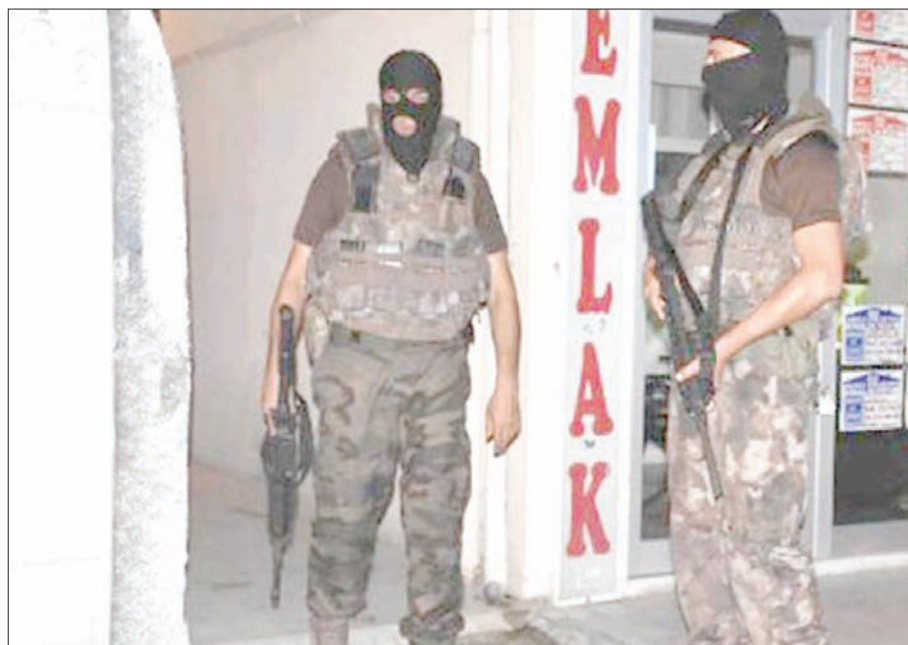
حملات مستمرة على مواقع «داعش» في إسطنبول («الشرق الأوسط»)

ونفذ تنظيم داعش الإرهابي تركيا خلال عام 2015 وحتى مطلع عام 2017 الجاري، كان أكثرها دموية هجوم مزدوج على مسيرة للديمقراطية نظمها حزب الشعوب الديمقراطي (الوئيد للأكراد) وعدد من المنظمات المدنية في أنقرة في أكتوبر (تشرين الأول) 2015، أسفر عن مقتل أكثر من 100 شخص وإصابة العشرات. واستهدف التنظيم بهجمات مناطق سياحية في إسطنبول خلال عام 2016، كما نفذ هجوماً ثلاثياً على مطار أتاتورك الدولي قتل فيه أكثر من 40 شخصاً أصيب العشرات، وفي مطلع العام الجاري نفذ الداعشي الأوزبكي عبد القادر مشاربيوف، الملقب بـ«أبو محمد الخراساني» هجوماً في قاعة رأس السنة على نادي «رينا» الليلي في إسطنبول، راح ضحيته 39 شخصاً، وأصيب 69 آخرون غالبية من الأجانب.