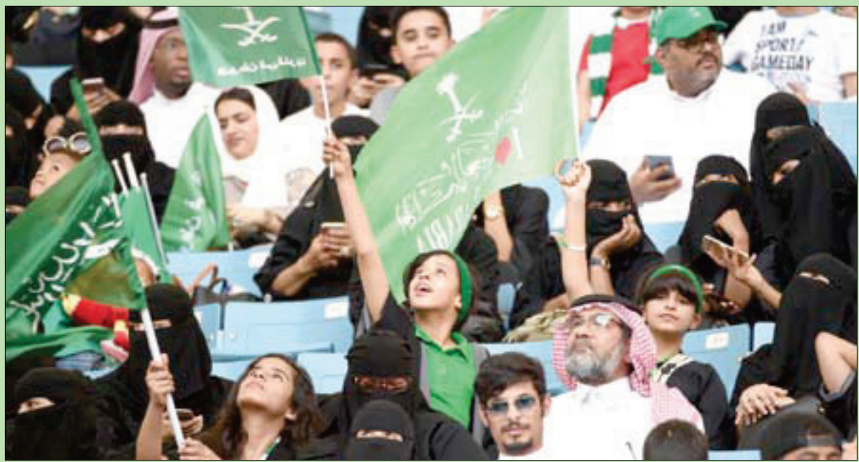
احتفلت المملكة العربية السعودية أمس بذكرى اليوم الوطني الـ 87 من خلال مهرجانات وبرامج في أكثر من 17 مدينة. وشهد ملعب الملك فهد الدولي في الرياض فعالية «ملحمة وطن» وهو أوبريت قصصي يحكي تاريخ السعودية وسط حضور جماهيري كبير... وفي الصورة جانب من الحضور التقاصيل (يوميات الشرق)