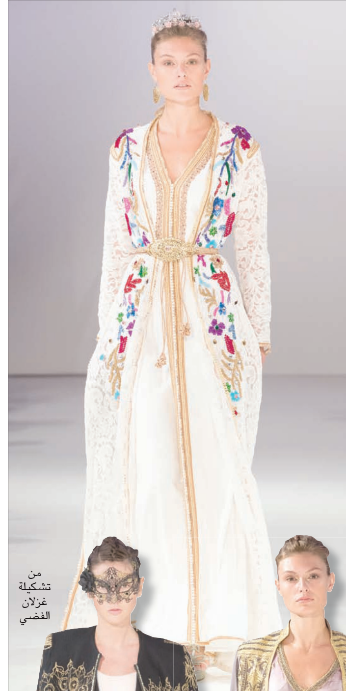
من تشكيلة غزلان الفضلي

جاءوا عليه بالتطريزات الغنية والأقمشة المترفة، التي تدرجت من شفافية المسلمين إلى نعومة الحرير والأورغترزا والمخمل في القطعة الواحدة أحياناً. أما من ناحية الألوان، فحدثت بلا حرج، لأنها جزء من جينياته ورموزه. فعلى مدى تاريخه كان القفطان يستمد جراته من هذه الألوان الساطعة أو المتناقضة بشكل صارخ، لكن المصمم يطوعها ليضفي عليها التناغم المطلوب. ويربط بعض الماخوذيين بالتاريخ هذه الظاهرة بالموسيقى زريباب. يذكرون له عنايته بمظهره واهتمامه بأناقته ويربطونها بالفردوس الأندلسي، بشمسه الساطعة ورغد حياته. وهو ما لا نستغربه أو نستنكره إذا عرفنا أن القفطان كان أصلاً رجالياً قبل أن نوعية الأقمشة، وفي كل الحالات استغلوا ألوانه وتطريزاته الغنية ليطلقوا العنان لخيالهم. وهذا ما أكدته قصص من المغرب خلال أسبوع لندن لربيع وصيف 2018.