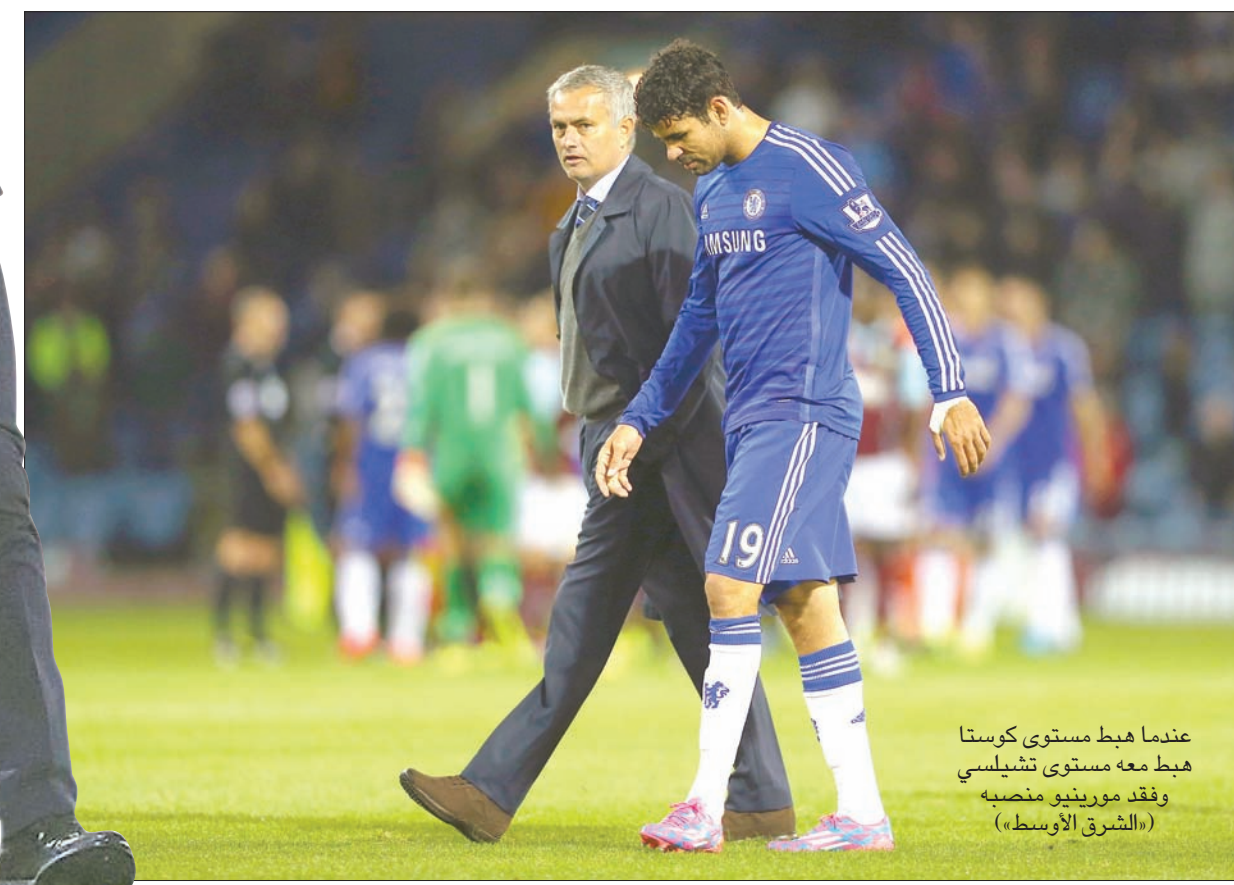
عندما هبط مستوى كوستا هبط معه مستوى تشيلسي وفقد مورينيو منصبه («الشرق الأوسط»)

الموسم الماضي. وحتى عندما حصل كوستا على الإنذار الخامس خلال مشاركته في مباراة الفريق أمام كريستال بالاس في ديسمبر (كانون الأول)، ليتأكد غيابه عن مباراة الفريق التالية أمام بورنموث بسبب الإيقاف، غادر كوستا ملعب «سيلهرست بارك»، وهو صاحب الهدف الوحيد في المباراة. وعندما عاد كوستا من الإيقاف، لعب عشر مباريات أخرى في المسابقات المحلية دون الحصول على أي بطاقة صفراء. ويعيد عن تأثيره الواضح داخل الملعب، كان كوستا محبوباً بين اللاعبين، وكان بعض اللاعبين يتواصلون معه بشكل دائم خلال المواسم الثلاث التي قضاها في «ستامفورد بريدج» والتي سجل خلالها 52 هدفاً في 89 مباراة في الدوري الإنجليزي الممتاز وحصل على لقب الهداف في هذه المواسم الثلاثة ولعب دوراً حاسماً في فوز فريقه بالدوري الإنجليزي الممتاز مرتين. وكان كوستا يقود الخط الأمامي لتشيلسي بكل شراسة ومكر ودهاء خلال هذه المواسم الثلاث، والتي حصل خلالها على 33 بطاقة صفراء، بالإضافة إلى بطاقة حمراء واحدة، بعد حصوله على إثنين في مباراة الفريق أمام إيفرتون في كأس الاتحاد الإنجليزي. وقدم المهاجم البالغ من العمر 28 عاماً أداءً لافتاً من تشيلسي، وكانت المباراة الأخيرة له مع الفريق في نهائي كأس الاتحاد الإنجليزي في مايو (أيار) الماضي قد شهدت تالفاً كبيراً أيضاً للاعب الذي أحرز في تلك المباراة هدفه رقم 58 والأخير له مع البلوز. ووصفه المدير الفني الحالي مانشستر يونايتد جوزيه مورينيو بأنه لاعب متكامل، كما أكد كونتي على أنه لاعب محوري في الطريقة التي يلعب بها الفريق. وجاء وقت بدأ واضحاً خلاله أن كونتي بدأ ينجح في تغيير سلوكيات اللاعب لدرجة أنه لعب 10 مباريات دون الحصول على بطاقة حمراء واحدة، كما لم يتعرض للإيقاف سوى في مباراة واحدة قرب نهاية