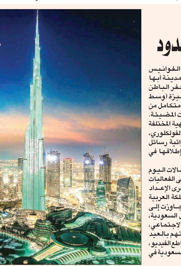
مواقع التواصل الاجتماعي شهدت حضوراً لافتاً