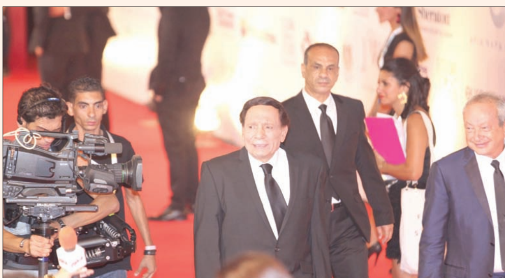
عادل إمام في حفل الافتتاح

ويشارك من المغرب فيلم «فولوبيليس» للمخرج فوزي بن سعدي في مسابقة الأفلام الروائية الطويلة، ومن الأردن فيلم (17) للمخرج ووداد شافاكوج في مسابقة الأفلام الوثائقية. وترأس لجنة تحكيم مسابقة الأفلام الروائية الطويلة المنتجة الأميركية سارة جونسون، الحاصلة على جائزة «إيمي» و«بيبيودي» للإنتاج المستقل، وتضم اللجنة في عضويتها الناقد الفني مارك آدمز الذي انضم مديراً فنياً لمهرجان إدينبورغ السينمائي الدولي عام 2015، إضافة إلى عمله مدير النقد الفني في مجلة صناعة السينما اليومية «سكرين»، فضلاً عن عمله لدى صحيفة «ذا صن» من مرور البريطانتيه ناقداً وصحافياً فنياً لما يزيد على 25 عاماً.