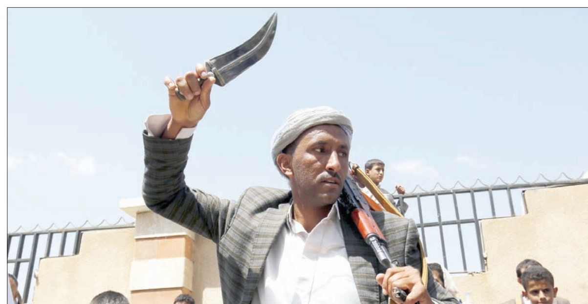
أحد أتباع الحوثي في استعراض أسلحة بالعاصمة صنعاء

افتخر بتجربتي الصحافية في تغطية الحرب في مدينة منكوبة ومحاصرة لأكثر من عامين، التي اعتبرها تجربة مهمة على المستوى المهني، فإن ذلك كان ثمنه باهظاً، على جميع المستويات، لكن تمكننا من نقل حقيقة الوضع العسكري من الخطوط الأمامية»، وكانت نقابة الصحفيين اليمنيين رصدت أكثر من 130 حالة انتهاك طالت الحريات الصحافية خلال النصف الأول من العام 2017، واستهدفت تلك الانتهاكات نحو 195 صحافياً ومؤسسة إعلامية، وضمنها حالات قتل واعتداءات وتهديد ومصادرة وإيقاف عن العمل وتعذيب وحالات شروع بالقتل، إضافة إلى قرصنة على المواقع الإخبارية الإلكترونية، إلى جانب مصادرة مقتنيات الصحفيين وجررتهم إلى المحاكم بطريقة غير قانونية، وفقاً لما أعلنته النقابة أخيراً. ولعل الأمر اللافت، أخيراً، أن بطش ميليشيات الحوثيين طال الكتاب والصحافيين المقربين من الرئيس السابق علي عبد الله صالح، فقد جرى، الأسبوعين الماضيين، اعتقال 4 صحفيين، 3 منهم من الغربيين من صالح، والرابع من الموالين للحوثيين، ولكنه انتقد، في عدد من المنشورات، سلوك جماعته، فكان مصيره الاعتقال الذي صادر خاصة لـ«الشرق الأوسط»، فإن توجه الانقلابيين بالعودة عن الصحافيين المعتقلين والمحكومين والإفراج الذي لم يتم إلى الآن، جاء عقب ضغوط دولية للجماعة الانقلابية من قبل دول ومنظمات، هدت بتصنيفهم ضمن الجماعات الأكثر خطورة على حرية الصحافة في العالم.