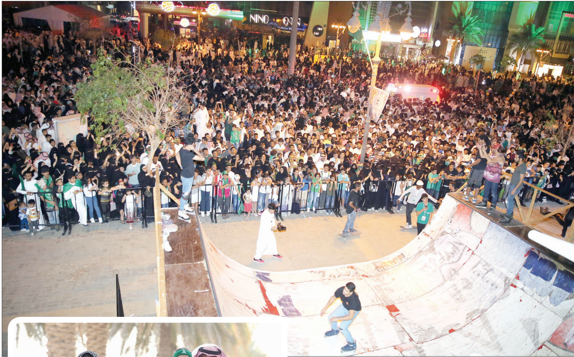
جانب من احتفالات اليوم الوطني بالرياض أمس

كما قدم لاعبو الفريقين والأجهزة الإدارية والفنية المهنية للقيادة الرشيدة والشعب السعودي بمناسبة اليوم الوطني تحت شعار «سنبقي بلادي «منار الأمم»