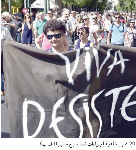
اليونان سجلت نسبة نمو في 2017 على خلفية إجراءات تصحيح مالي

أثينا، «الشرق الأوسط» اعتبر رئيس مجموعة وزراء مالية اليورو يريون ديسيلبلوم، أن الاقتصاد اليوناني «يتحسن»، لكن الأولوية تبقى «للاستقرار الاقتصادي والسياسي» و«للمضي في الإصلاحات». وشدد رئيس مجموعة وزراء مالية منطقة اليورو، في مقابلة نشرت أمس السبت، في إحدى الصحف اليونانية، قبل زيارة لأثينا يقوم بها غدا الاثنين، على وجوب أن تحقق (اليونان) بحلول نهاية برنامج الإنقاذ) في أغسطس (آب) 2018 الإصلاحات» التي يطالب بها دائئوها.