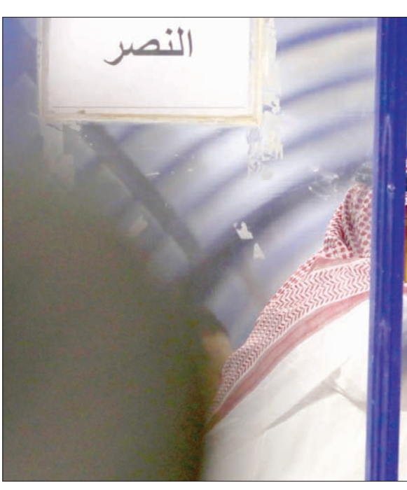
الأمير فيصل بن تركي رئيس النصر متفاعلاً مع أحداث مباراة الفيحاء الأخيرة

بعد تحقيقه للقب استمر داسيلفا في قيادة الفريق خلال الموسم الجديد 2015-2016، لكنه لم يمس سوى أربع مباريات حتى تمت إقالته وتكليف الكولومبي هيغيتا مدرب الحراس في قيادة الفريق مؤقتاً حتى تم التعاقد مع الإيطالي فابيو كانافارو الذي رحل هو الآخر عقب مرور 11 مباراة ليعود هيغيتا في قيادة الفريق مؤقتاً، حتى تم التعاقد مع الإسباني كانيديا بعد موسم من إقالته ورحيله، إلا أن حامل اللقب تراجع بصورة كبيرة وحل في المركز الثامن بلائحة الترتيب.