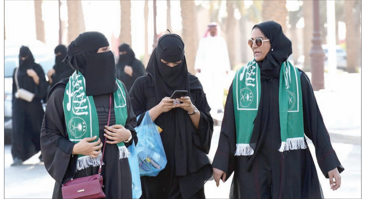
فتحت الهيئة العامة للترفيه أمس مدرجات استاد الملك فهد الدولي بالرياض للعائلات للمرة الأولى لمشاهدة أوبريت «ملحمة وطن».

احتفالات الألعاب النارية في الدرعية المسرحية والعروض البحرية بالخبر، والرديسي مول بجدة، وقاعة الاحتفالات الجوية بكورنيش جدة، والاحتفالات البحرية بجازان، والمهرجان الغنائي الكبير» بالصالة المغطاة بملعب الجوهرة بجدة، ومهرجان «بسملة وطن» ساحة جبل سلع بالمدينة المنورة، وغيرها.