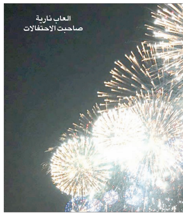
العاب نارية صاحبت الاحتفالات

مدينة محافظة في السعودية، وأطلع الخليل على البرامج كافة التي ستقام خلال الفعاليات المختلفة التي تحتضنها 17 مدينة ومحافظة في السعودية،