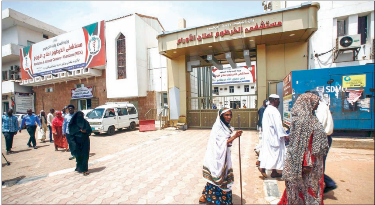
الخرطوم أكدت أنها ستعمل عن قرب للانتقال إلى مرحلة المنافع المباشرة في مجالات التعليم والصحة والثقافة والمواصلات (أ.ف.ب)

بارلوسيا والصين وروسيا. واختتم وفد من بارلوسيا برئاسة وزير الزراعة زيارة السودان أول من أمس، وقع خلالها على مشروع زراعي كبير لتحويل القطاع الزراعي إلى قطاع نشط، وقيام عدد من المصانع والمشروعات البيلاروسية في السودان خلال عام واحد لتغطي حاجة البلاد من الصادرات الزراعية.