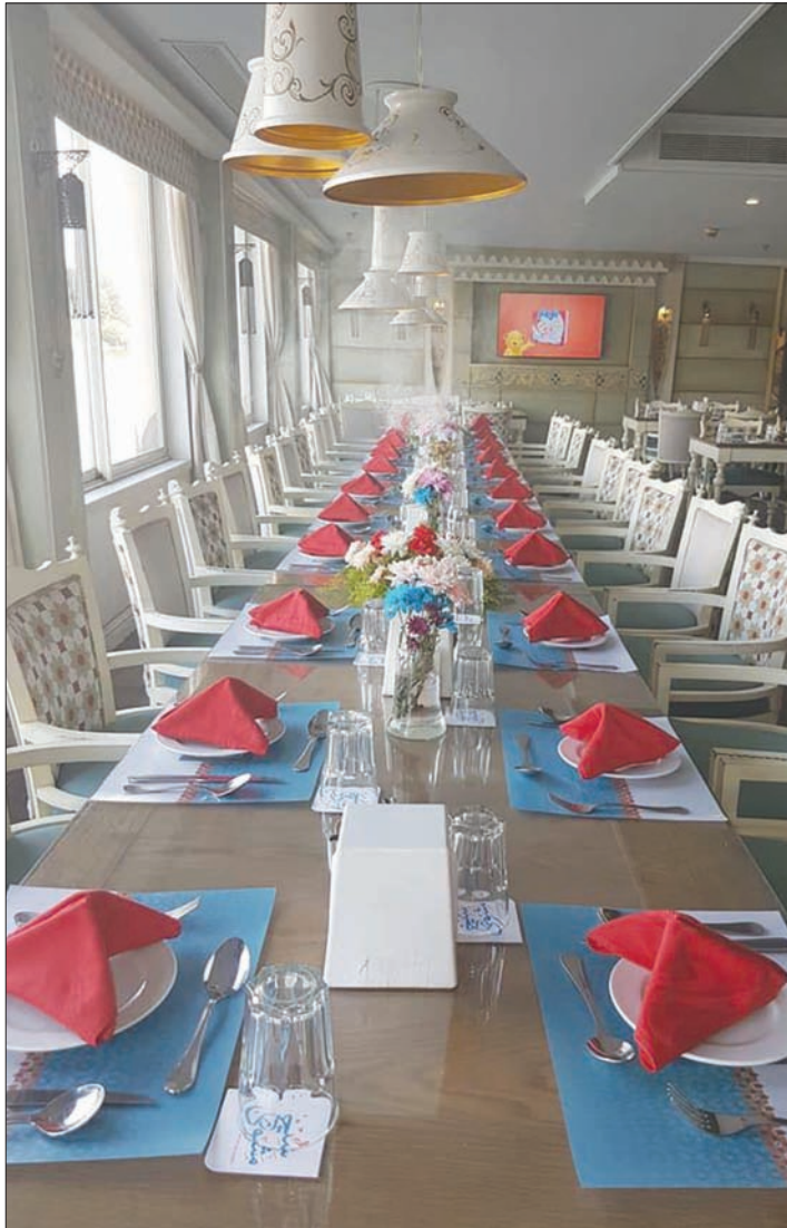
«سيخ مشوي» من الداخل