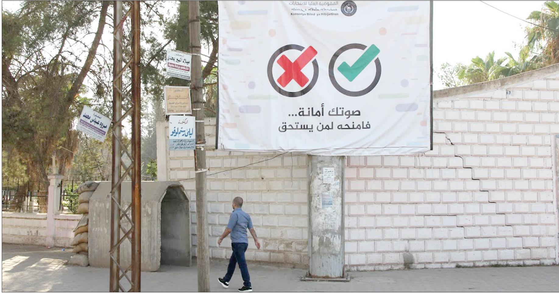
لافتة «انتخابية» في أحد شوارع مدينة القامشلي شرق سوريا