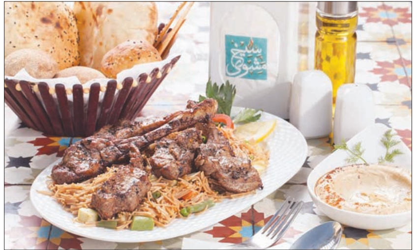
الريش الضائني مع الشعيرية