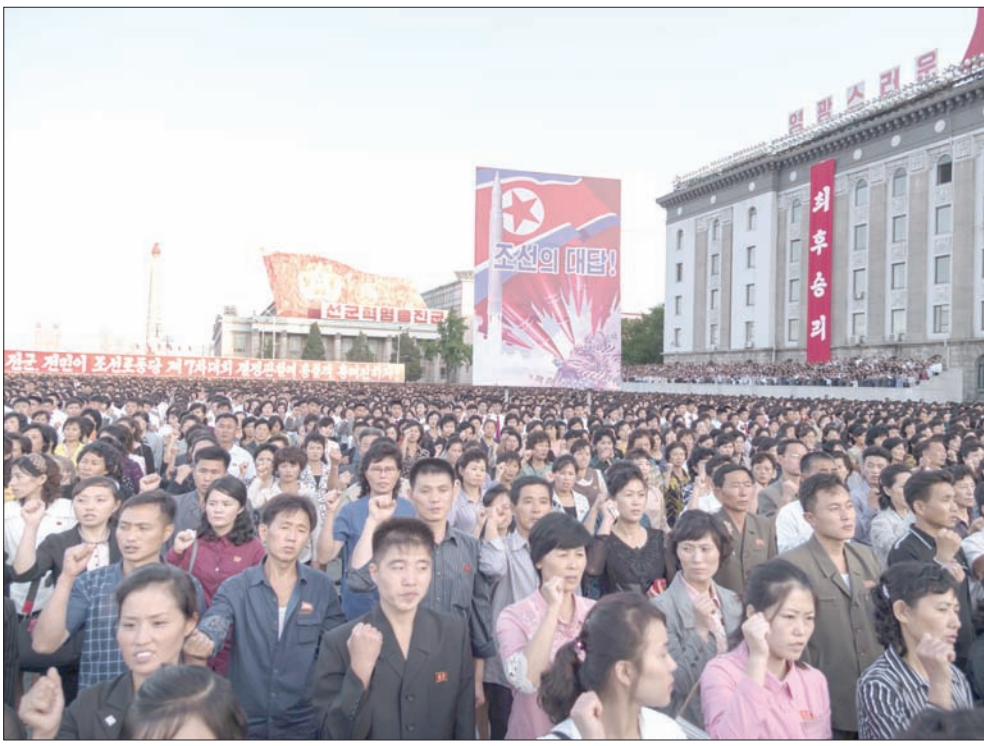
كوريون شماليون يشاركون في «مظاهرة» للتنديد بتصريحات الرئيس الأميركي في بيونغ يانغ أمس

وتقول بيونغ يانغ إنها تحتاج للسلاح النووي للدفاع عن نفسها بوجه «عدائية» القوات الأميركية إليها وتعقد العزم على بناء نظام صاروخي قادر على حمل رأس نووي والوصول إلى الأراضي الأميركية.