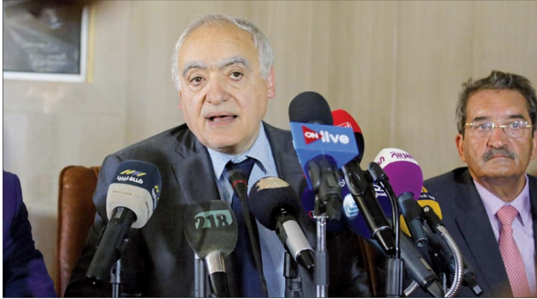
المبعوث الخاص للأمم المتحدة إلى ليبيا غسان سلامة

وأضاف المصدر في تصريح مقتضب أن «إيطاليا ستغري في سياساتها، التي كانت تدعم في السابق، المجلس الرئاسي، وستفتح على الشرق، تأكيداً للموقف الدولي الداعم للمبعوث الأممي». وزيارة حفر إلى روما، بعد غد (الثلاثاء)، تكون إيطاليا طوط صفحة من الخلافات المؤقتة مع قائد الجيش الليبي، الذي سبق أن لُوح في الثالث من أغسطس (آب) بالتصدي لأي سفن إيطالية تستقر في المياه الإقليمية الليبية دون تصريح، اعتراضاً على موافقة البرلمان الإيطالي على إرسال قطع بحرية إلى ليبيا، في إطار المحاولات للحد من عبور المهاجرين البحر المتوسط باتجاه أوروبا.