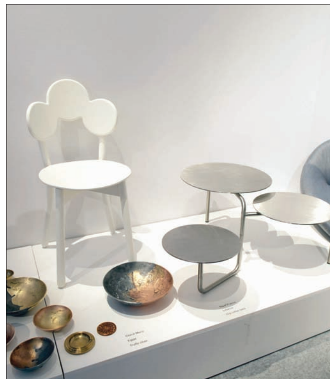
جانب من معرض «الشرق الأوسط: صمم الآن» الذي يقيمه حي دبي للتصميم في لندن