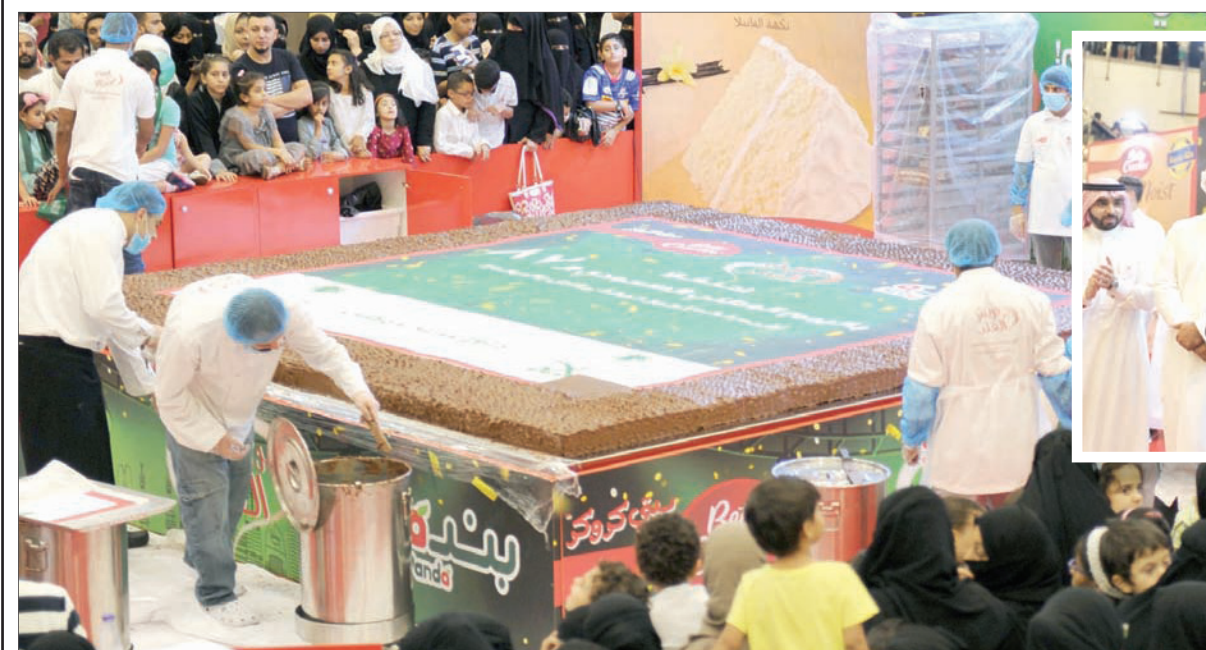
جانب من عملية تزيين الكعكة في «الاندلس مول» بجدة

ويعد التأكد من تحقيق الرقم القياسي، بدأ تقطيع الكعكة الرخامية إلى 4 آلاف و800 قطعة لتوزع على زوار مركز «الاندلس مول»، وأصدقاء «بيتي كروكر» في المملكة، كما جرى تقديم جزء منها إلى المؤسسة غير الربحية بنك الطعام السعودي.