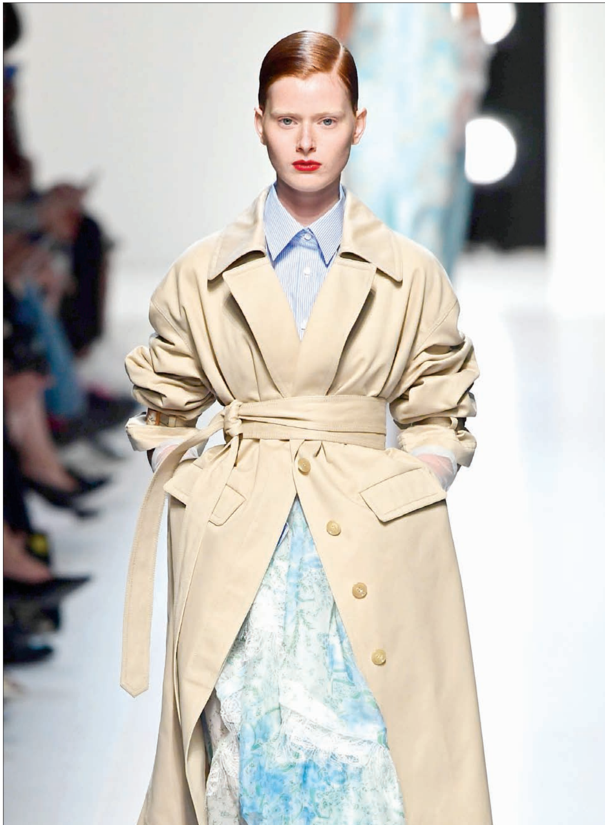
عارضة تقدم زياً من تصميم إرمانو سيرفينو خلال عرض أزياء الربيع وفصل الصيف المقبل في ميلانو

الحقيقة أنه القمني حجراً، فأبدته على كل ما قاله، لأنني فعلاً أشكو من اضطرابات حنجرتي - خصوصاً عندما أغني - كما أن شعبي الهوائية بالأصل راحت وطي.