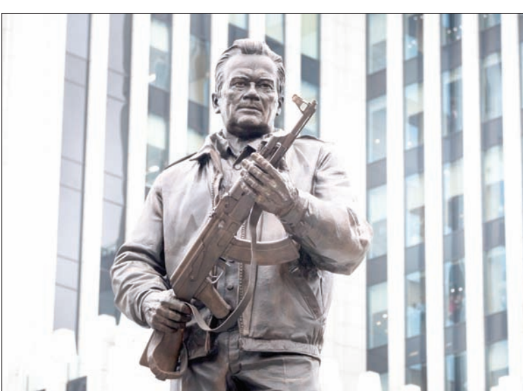
النُصْب التذكاري لميخائيل كلاشنيكوف وهو يحمل بندقية ألمانية تشبه البندقية الشهيرة التي صممها خلال الحرب العالمية الثانية

ويحلول مساء الجمعة ظهر في الجزء المعدني ذي النقش البارز فراغ مربع في المكان الذي كان يصور البندقية الألمانية. وهناك وجه شبه كبير في الشكل الخارجي