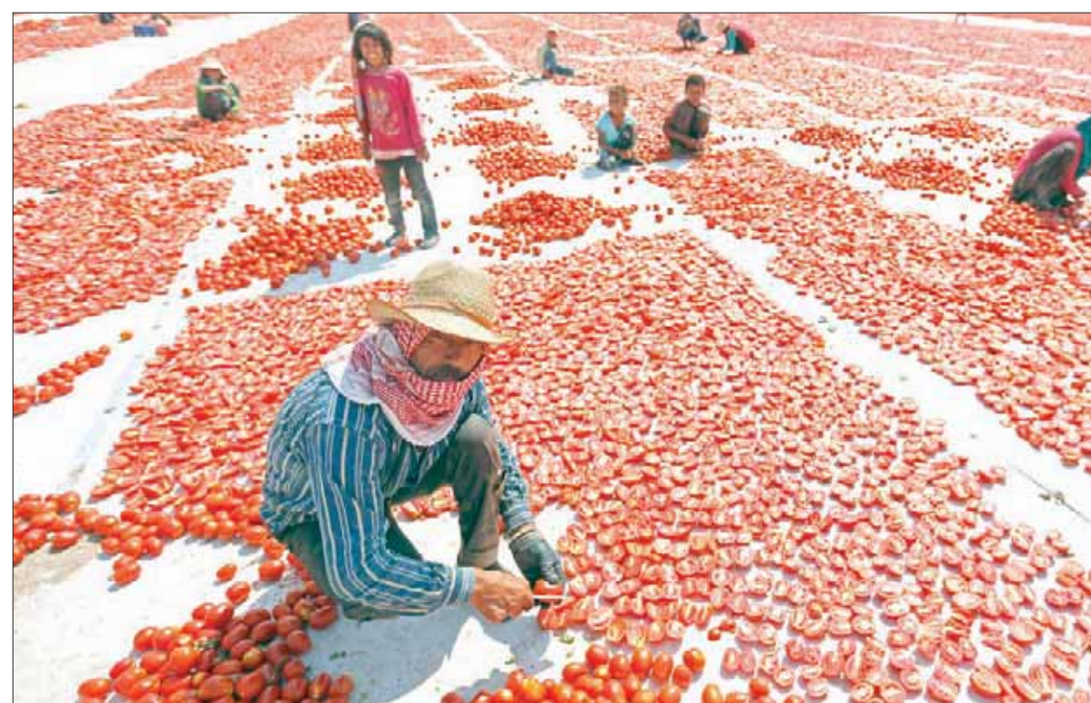
عمال من النزاحين السوريين يفرشون الطماطم لتجفيفها في منطقة إزمير التركية

ولفت السفير الروسي إلى وجود كثير من الفرص الاقتصادية الكبيرة القابلة للنقاش بين البلدين، قائلاً: «نوجد مجالات جديدة من الممكن التعاون فيها، ولدي معلومات أن الجانبين في الوقت الحالي يبحثان التبادل التجاري بين البلدين في السنوات القليلة الماضية، فإن العلاقات الاقتصادية بين موسكو وأنقرة تشهد تطوراً كبيراً.