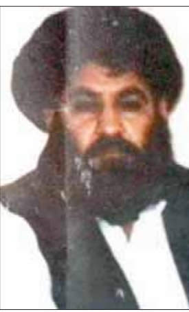
الملا اختر منصور

قندهار (أفغانستان) كارلوتا غال وروح الله خابانوك * في الساعات السابقة على مقتله في غارة أميركية بطائرة «درون»، أدرك الملا اختر محمد منصور، زعيم حركة طالبان، أن هناك شيئا غير طبيعي يحدث. كان في طريقه إلى منزله قادم من زيارة سرية إلى إيران في مايو (أيار) عام 2016، وكان يقود سيارته عبر منطقة نائية من جنوب غربي باكستان، عندما اتصل بشقيقه وأقاربه لإخبارهم بقراره. «كان يعرف أن شيئا ما سوف يحدث»، كما قال قائد سابق في الحركة ومن المقربين لدائرة الملا منصور الداخلية في مقابلة شخصية: «ولهذا السبب أخبر أفراد أسرته بما يجب القيام به، وأن يستمروا متحدين». ومن النادر لزعيم في طالبان أن يجري مقابلة شخصية، لكنه تحدث هذه المرة شريطة عدم الكشف عن اسمه أو موقعه؛ بسبب أنه قد انشق مؤخرا عن