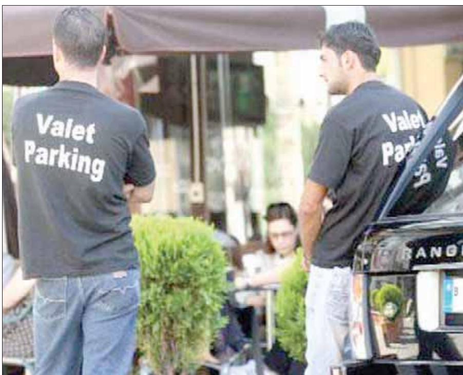
«فاليه باركينغ» في بيروت

تلقى شكاوى المواطنين في هذا الصدد، بحيث يتم التجاوب بسرعة معها وتُنذر الشركة المسؤولة في المرحلة الأولى لتقفل في حال تكررت مخالفتها هذه. يرى بعض اللبنانيين في ظاهرة «الفاليه باركينغ» بأنها خدمة مريحة تخفف عن كاهلهم وتختصر وقتهم الضائع في البحث عن موقف لسيارتهم، مما يتسبب في تأخيرهم عن مواعيد عملهم، فيما تجد شريحة أخرى بأن على الدولة أن تكون أكثر حزمًا في هذا الموضوع فتتخذ محاضر ضبط في حق كل من يحاول مخالفة هذا القرار لأن حالة من الفلتان الشديد تسود. ويعاني بعض اللبنانيين من مشاكل عدة مع عمال «الفاليه باركينغ»، تتمحور حول معاملة لهم بشكل غير لائق أو بإجراءات أضرار في سياراتهم من جراء حوادث سير معينة، وكذلك سرقة بعض محتوياتها وأحياناً سرقتها كاملة والهروب بها إلى جهة مجهولة بعد أن يدعي أحدهم