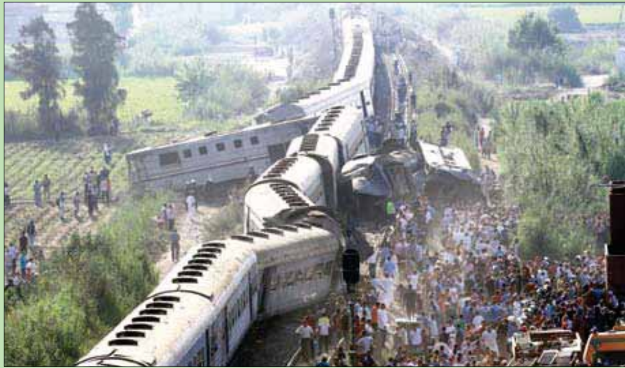
مصريون في مكان تصادم القطارين في الإسكندرية أمس