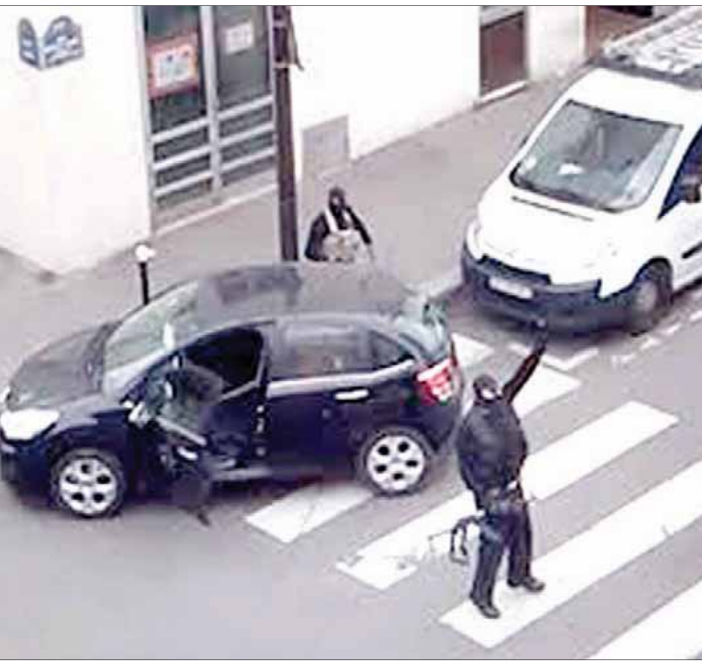
سعيد وشريف كراشي منفذا هجوم «شارلي إبدو» استخدموا الأسلحة النارية وقتلا 12 شخصا وجرحا 5

السلاح يجب أن يطابق نوع الخزانة المطلوب شراؤها، فلن يستطيع أحد أن يشتري خزانة لهندية وهو يحمل ترخيص مسدس. وكان خالد البركراوي الذي فجر نفسه في محطة للغطارات الداخلية في بروكسل، في مارس من العام الماضي، قد نجح في الحصول على 31 خزانة لسلاح كلاشيكوف، بعد أن اشتراها بشكل قانوني من أحد المحلات التجارية. وعلى الصعيد الأوروبي، سبق أن اعتمد مجلس الاتحاد الأوروبي أواخر ديسمبر (كانون الأول) الماضي، الاتفاق الذي جرى التوصل إليه بين الدول الأعضاء والبرلمان الأوروبي حول تعديلات تشريعية، تهدف السيطرة على عمليات اقتناء وحيازة الأسلحة. وقال روبرت كالينيك وزير الداخلية في سلوفاكيا، والتي كانت تتولى الرئاسة الدورية للاتحاد الأوروبي، إن القوانين الأوروبية الحالية بشأن الأسلحة النارية تعود إلى عام 1991، ولكن في أعقاب سلسلة من الهجمات الإرهابية في أوروبا، ظهرت الحاجة إلى معالجة بعض القصور في التشريعات القائمة. وأضاف: «الاتفاق ينص على تشديد القيود التي من شأنها أن تساعد على منع حيازة الأسلحة النارية من قبل منظمات إرهابية وإجرامية»، مختتما بأنها تعديلات تصدى للمخاطر التي تهدد السلامة العامة والأمن. وحسب بيان أوروبي في بروكسل، فإن الاتفاق يتضمن أيضا إجراء مراجعة لتراخيص الأسلحة النارية، وأيضا موائمة قواعد وسم الأسلحة النارية، بحيث يكون هناك اعتراف متبادل بالعلامات بين الدول الأعضاء، مما يساهم في إمكانية تتبع الأسلحة النارية المستخدمة في الأنشطة الإجرامية. ونوه البيان إلى وجود بعض الأسلحة التي يتم تجميعها من مكونات منفصلة. وتضمن الاتفاق أن تضاف هذه المعلومات في أنظمة للبيانات الوطنية، وأيضا تنسيق التعاون بين الدول الأعضاء للكشف عن التجار والسماسرة، والكشف عن أي صفقات تتم عبر الوسائل الإلكترونية.