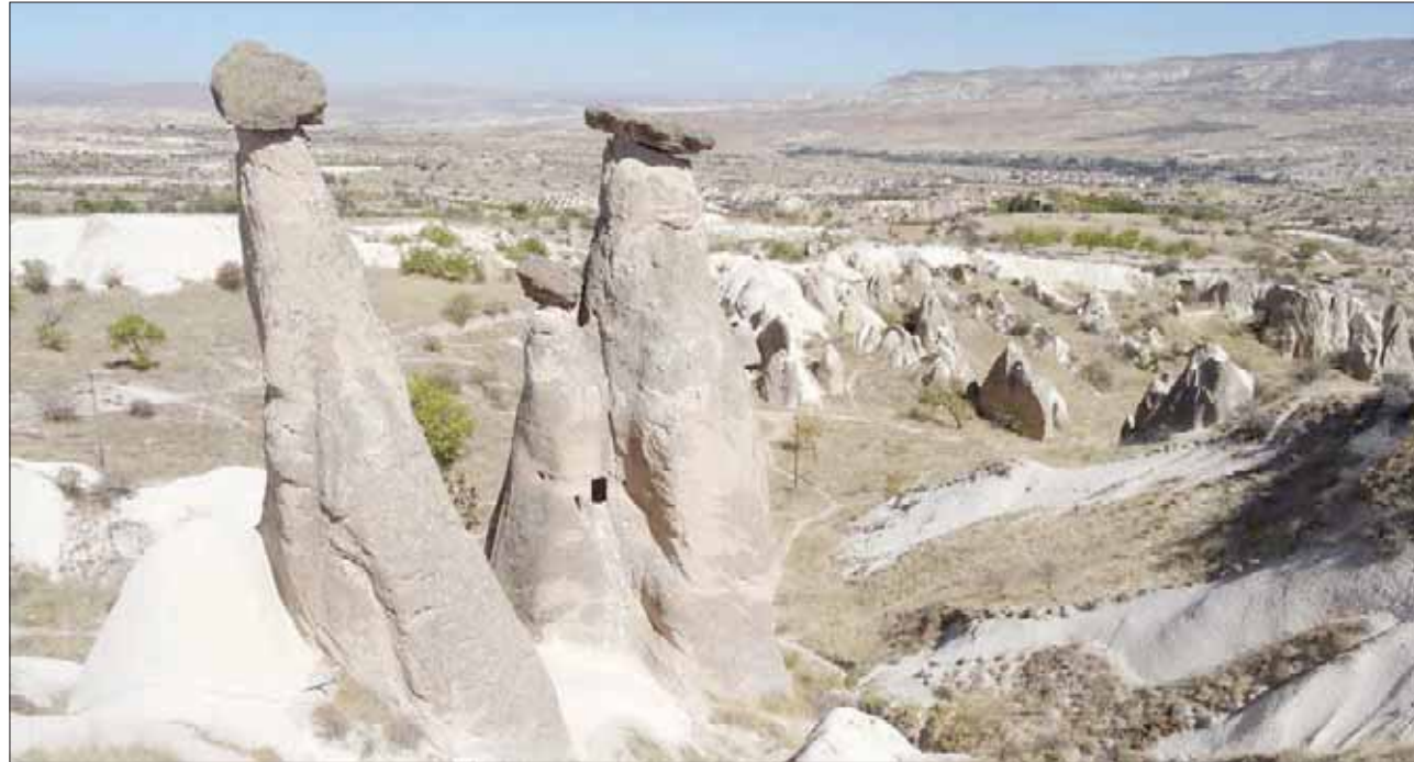
«مداخن الجن» في وادي دفرنت في كبادوكيا بوسط تركيا

تثير «مداخن الجن» أو «مداخن العفريت» التي تقع في وادي دفرنت في منطقة نيفشهر في كبادوكيا السياحية الشهيرة، بوسط تركيا دهشة زائريها الذين تصل أعدادهم إلى أكثر من مليوني زائر كل عام من الأتراك والأجانب، لمشاهدة هذه الأعجوبة التي نسجت حولها الأساطير. يقع وادي دفرنت قرب بلدة أفانوس التابعة لولاية نيفشهر في منطقة كبادوكيا التي تعد عنواناً لعراقة منطقة الأناضول وقدمها عبر التاريخ الإنساني، ويضم الوادي الكثير من «مداخن الجن» التي تشكلت بفعل عوامل النحت والتعرية الطبيعية والتي تتخذ أشكالاً مثيرة مثل الجمال والتماسيم والكلاب أو القبعات والأميرات وغيرها، ويطلق على هذه الأشكال من الصخور أيضاً «موائد الشيطان».