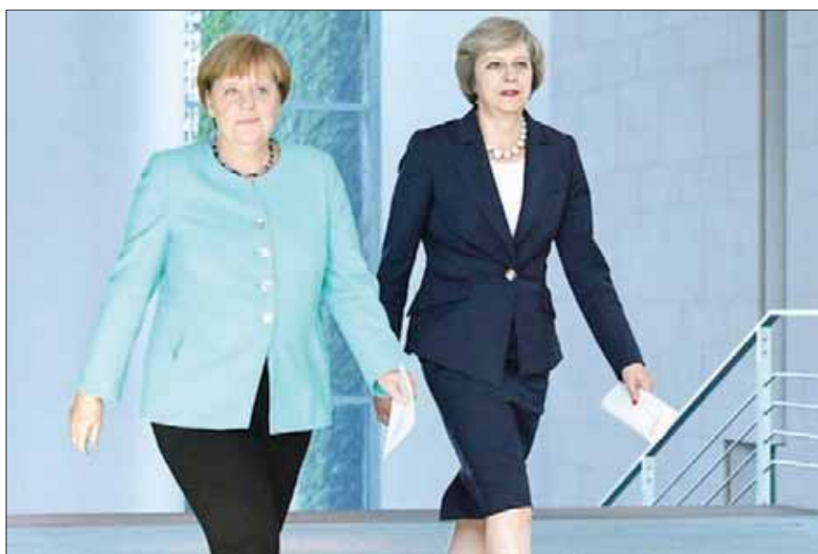
بعد تفعيل المادة 50 كانت ميركل أول مسؤول أوروبي تتصل به ماي

كوسيلة لدفع أجنداث أخرى قدما إلى الامام، واعتقد أن ذلك قد يترك أكثر حذراً إلى حد ما تجاه (البريكست)، أو راغب بدرجة أكبر قليلاً في نيروبي. ولم يقدم أدلة البريطانية (من الاتحاد الأوروبي)