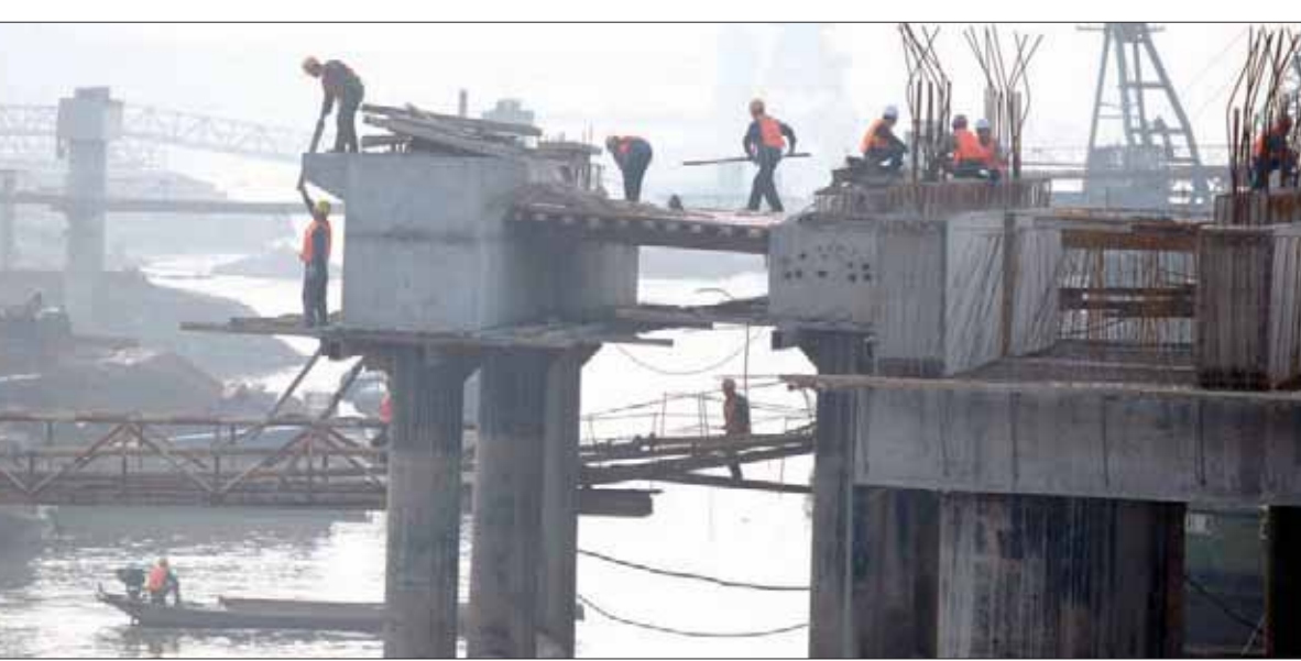
تمنح الصين دول آسيوية قروضاً ميسرة وفي حال العجز عن سداد الديون تجبرهم على تحويلها لأسهم في المشروعات القائمة

وضع بنغلاديش ليس أفضل من كل الدول المذكورة آنفاً. تبلغ قيمة الاستثمارات الصينية في بنغلاديش نحو 24 مليار دولار، وتمثل بذلك نحو 20 في المائة من إجمالي الناتج المحلي لبنغلاديش. كذلك منحت الصين لبنغلاديش قرضاً ميسراً لتمويل المشروعات التي تحظى بدعمها. من المرجح ألا تتمكن بنغلاديش