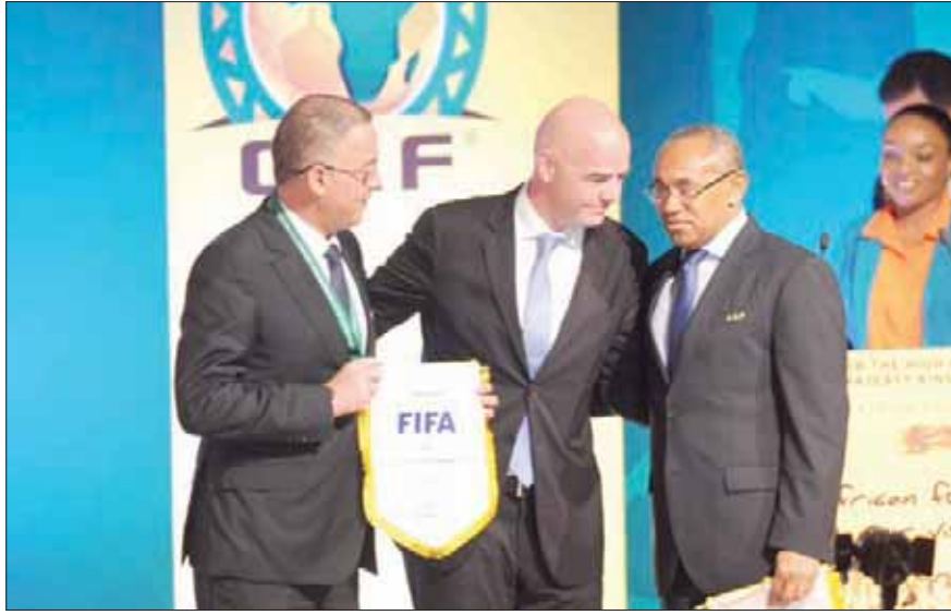
فوزي لقعج رئيس الجامعة الملكية المغربية لكرة القدم إلى جانب رئيسي «فيفا» و«كاف»

تتقدم كاس العالم وطلبة الحالي، تحدث القبة عن وجود بنيات ومؤهلات ملموسة، خصوصاً بعد انخراط المغرب في تطوير بنياته الرياضية، بوجود ملاعب جيدة، فضلاً عن نجاحه الأخير في تنظيم تظاهرات كروية عالمية، نظير كأس العالم للأندية، زيادة على ما يتمتع به البلد من استقرار وأمني وجاذبية سياحية وموقع استراتيجي مهم، دون الحديث عن الدينامية التنموية التي انخرط فيها المغرب على مدى العقدين الأخيرين، والتي توجت بمشاريع ضخمة، تشمل النقل السككي والطرق والبحري والجوي، والإقامة، وتطوير شبكات الاتصال، إلى غيرها من المؤهلات والبنيات التي تجعل من الطلب المغربي، هذه المرة، أكثر من مشروع، ومن حلم. ومن جهته، قال فؤاد الورتازي، النائب الأول لرئيس العصبة الإفريقية المغربية الرئيسية المنتخب لفرق الكؤكس المراكشي، إن «الطلب المغربي الرسمي لتنظيم كأس العالم في 2026 يبقى شيئاً مهماً لسمعة المغرب، كروياً وسياسياً واقتصادياً وإعلامياً».