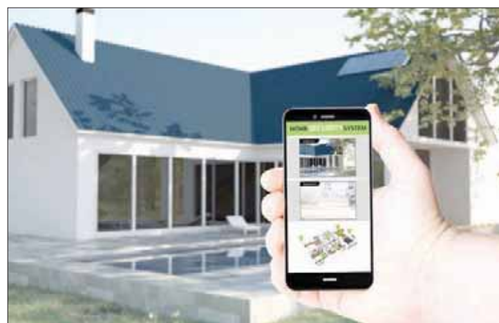
الهواتف الجواله دخلت ميدان مراقبة البيوت للأطمئنان عليها عن بعد

مقاطعات النورماندي والباسك. وجاء في ملف التحقيق أن أفراد العصابة كانوا يخارون مدينة معينة ثم يتوزعون كزلاء في الفنادق الواقعة على الطريق السريعة ويرصدون المنازل الفخمة في محيط يمتد لأكثر من 50 كيلومتراً، أحياناً. وكانت حصيلة عمليات السطو، كميات من الجواهر والساعات الثمينة والسيارات الفخمة التي قدرت بمليون ونصف المليون يورو. وكان هناك بين المهاجمين من تخصص بفتح الأقفال أو تعطيل أجهزة الإنذار. أما الضحايا