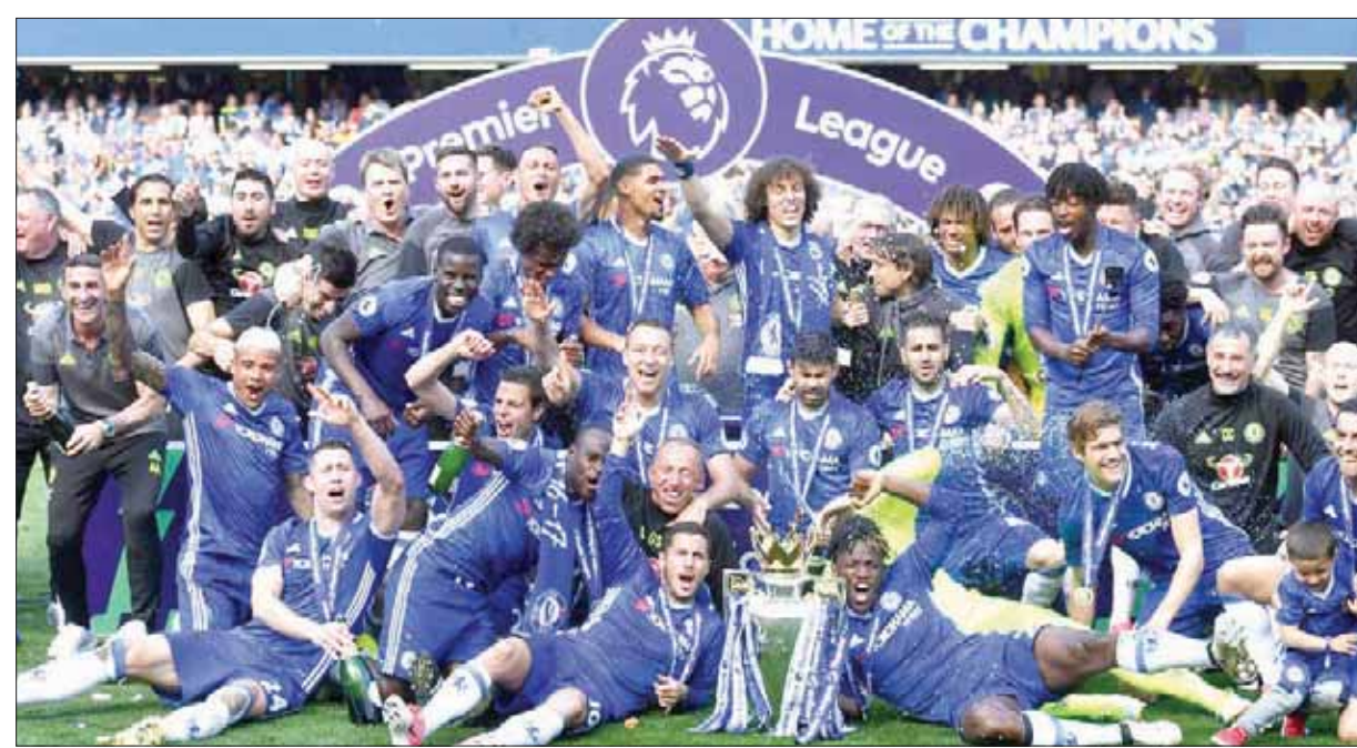
أندية كثيرة تتسابق لإعاقبة تشيلسي عن تحقيق لقبه الثاني على التوالي («الشرق الأوسط»)

بينما يخوض كلوب اعتباراً من نهاية الأسبوع الحالي موسمه الإنجليزي الثالث؛ ما يجعلهما تحت ضغط كبير، ولا سيما أن فريقهما يمكن أن يفتقد الفنية اللازمة للتفوق على أمثال تشيلسي وقطي مدينة مانشستر وارسنال. وبعدهما انتهى موسم 2014 - 2015 في المركز الثالث، وفانيا الموسم المنصرم، يواجه توتنهام خطر التراجع عوض التقدم درجة إضافية على منصة التتويج، في ضوء التعاقبات التي تجربها الفرق المنافسة.