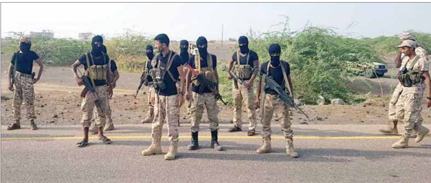
عناصر من قوات الأمن اليمنية ينتشرون في شبوة

التي باتت تدرك أن الأجهزة الأمنية تضيق الخناق عليها بشكل يختلف عما كان في السابق، خصوصاً أن وزارة الداخلية وحسب تصريحات سابقة للواء حسين عرب «عازمة على ملاحقة هذه الجماعات ولن تتوقف إلا بإتمام مشروعها في تطهير البلاد».