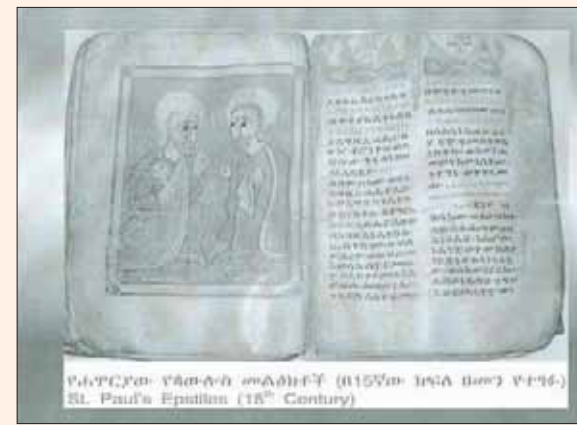
مخطوطتان محفوظتان في المكتبة الإثيوبية