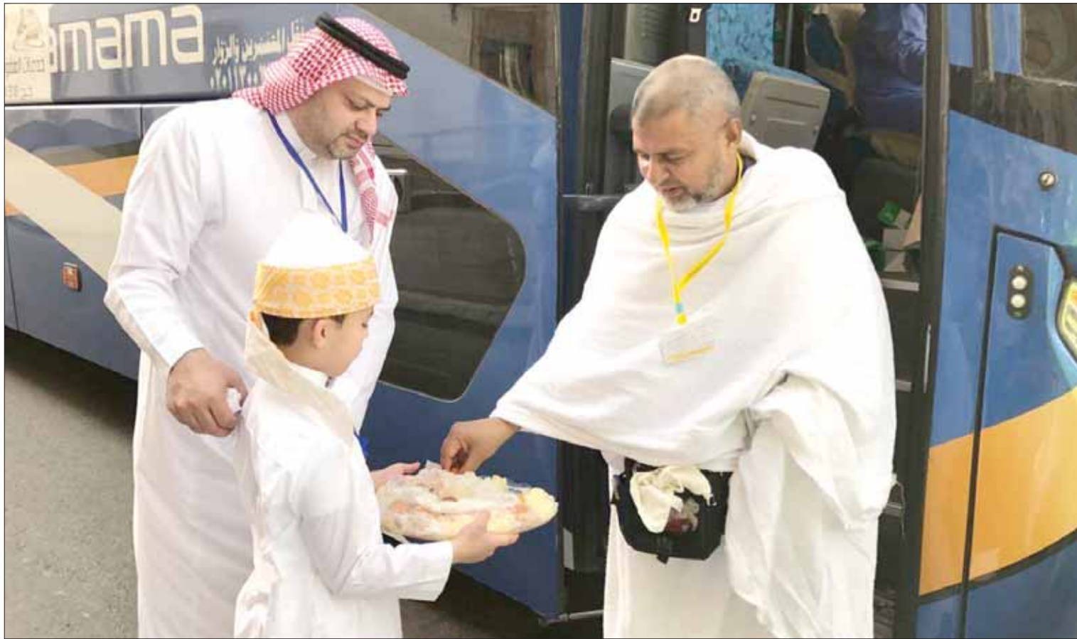
استقبال حجاج باكستان بماء زمزم والحلويات المكية

مسلمان بن عبد العزيز؛ لما تقوم به من جهود جبارة لراحة ضيوف الرحمن.