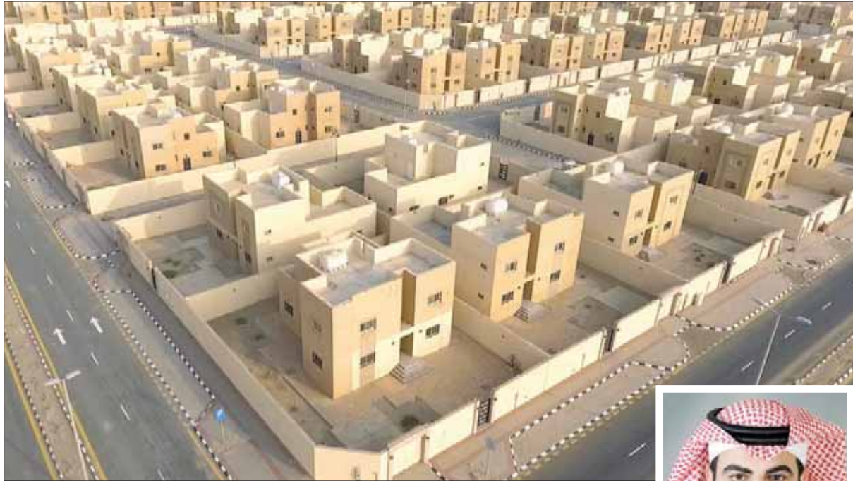
تعمل السعودية بشكل جاد على إنهاء ملف أزمة الإسكان من خلال حزمة من البرامج والحلول

أهمية أن تستند هذه الصناديق على مقيمين عقاريين مهنيين يستطيعون ربط الأسعار الحالية، بالتغيرات الاقتصادية التي تحيط بالقطاع العقاري، وهي المتغيرات التي تلعب بلا شك دوراً في ربحية هذه الصناديق مستقبلاً».