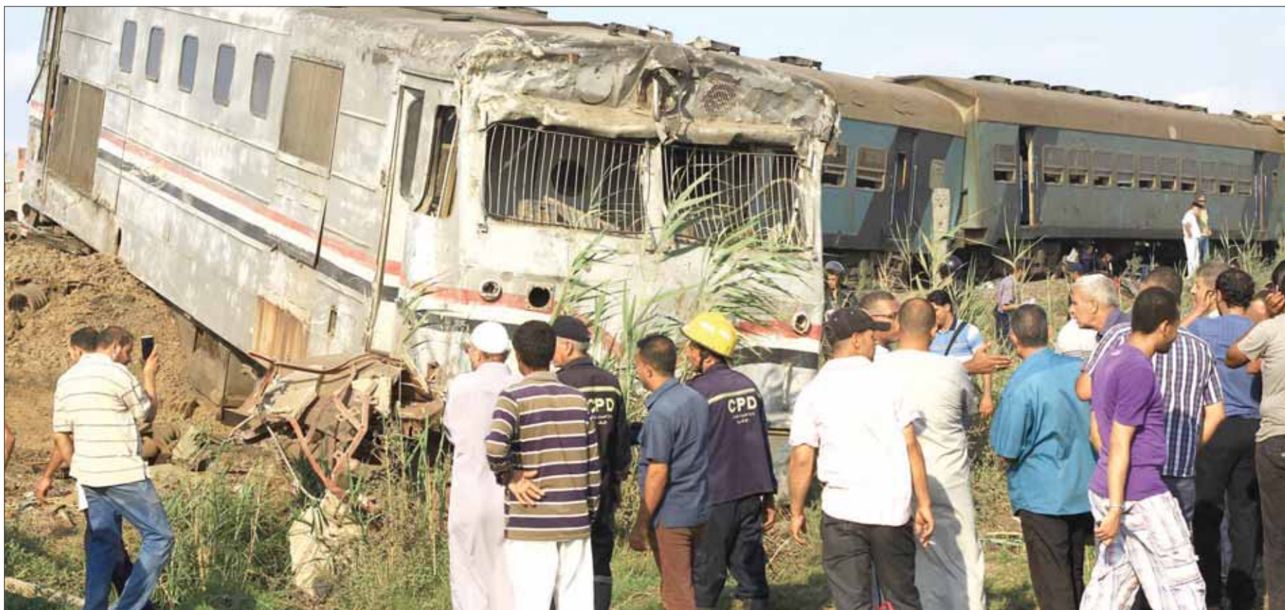
مصريون يتجمعون حول حطام عربات القطارين عقب حادث التصادم