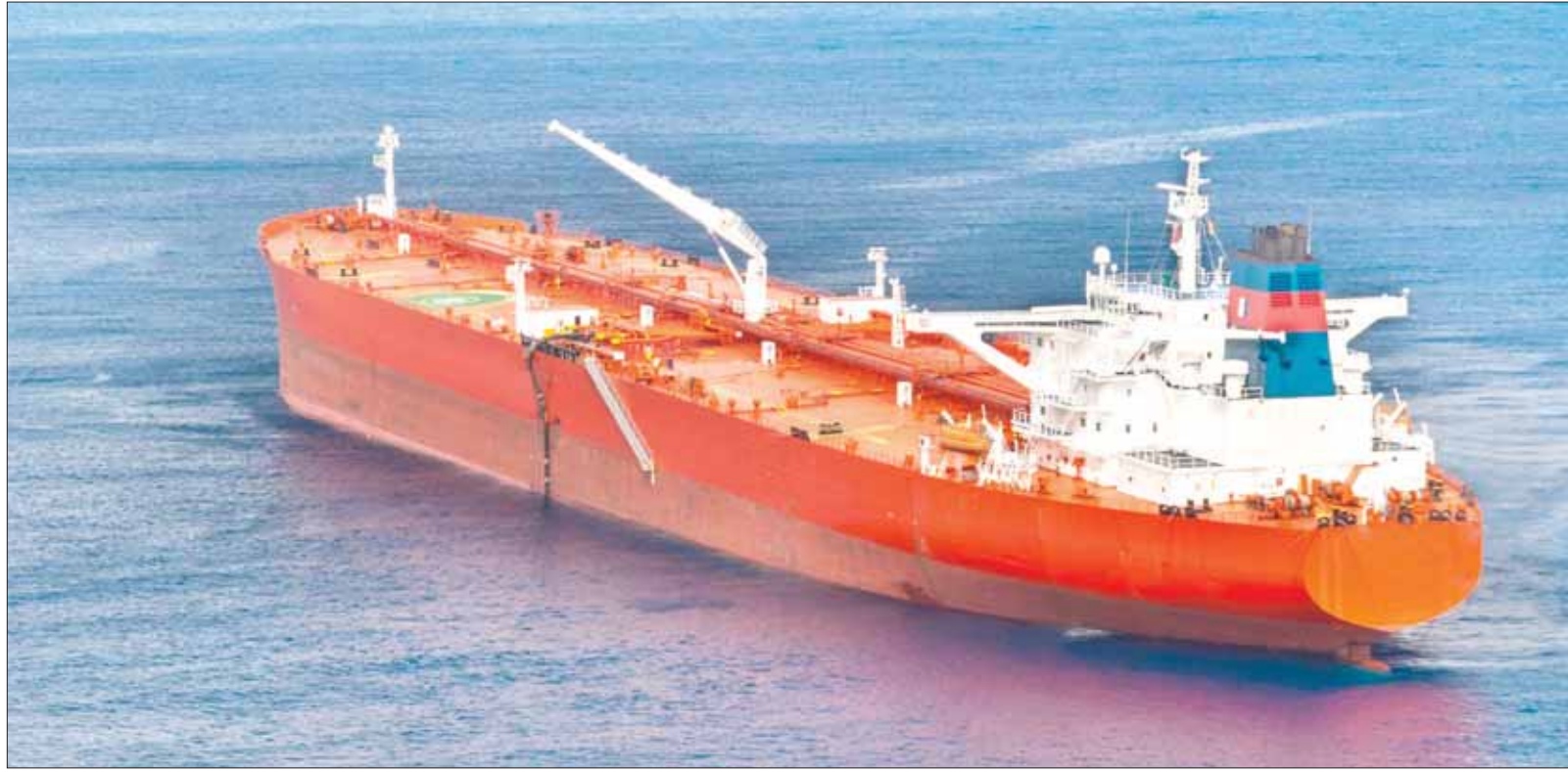
تقليص الإنتاج من حزام أورينوكو سيحرم المنطقة من مصدر مهم للنفط الخفيف

الدولية عن انخفاض في المخزونات بالدول الصناعية في يونيو (حزيران) ويوليو الماضيين.