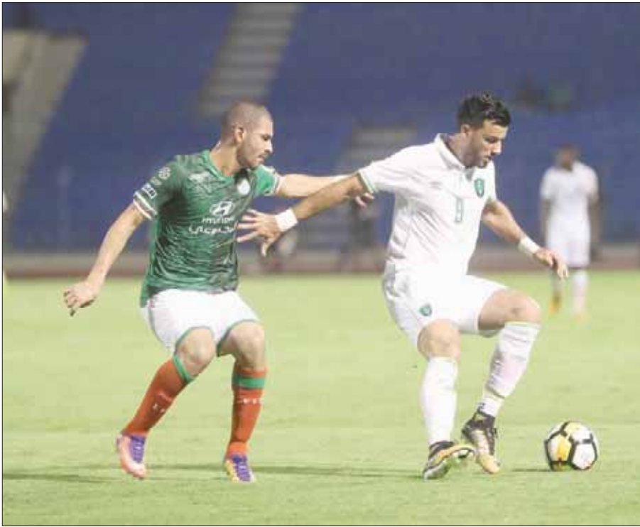
من مباراة الاتفاق والأهلي أمس