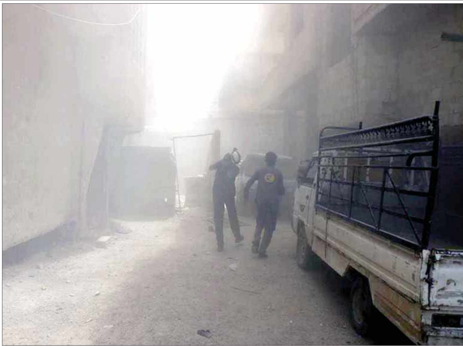
غبار ودخان بعد قصف من قوات النظام على حمورية في غوطة دمشق أمس