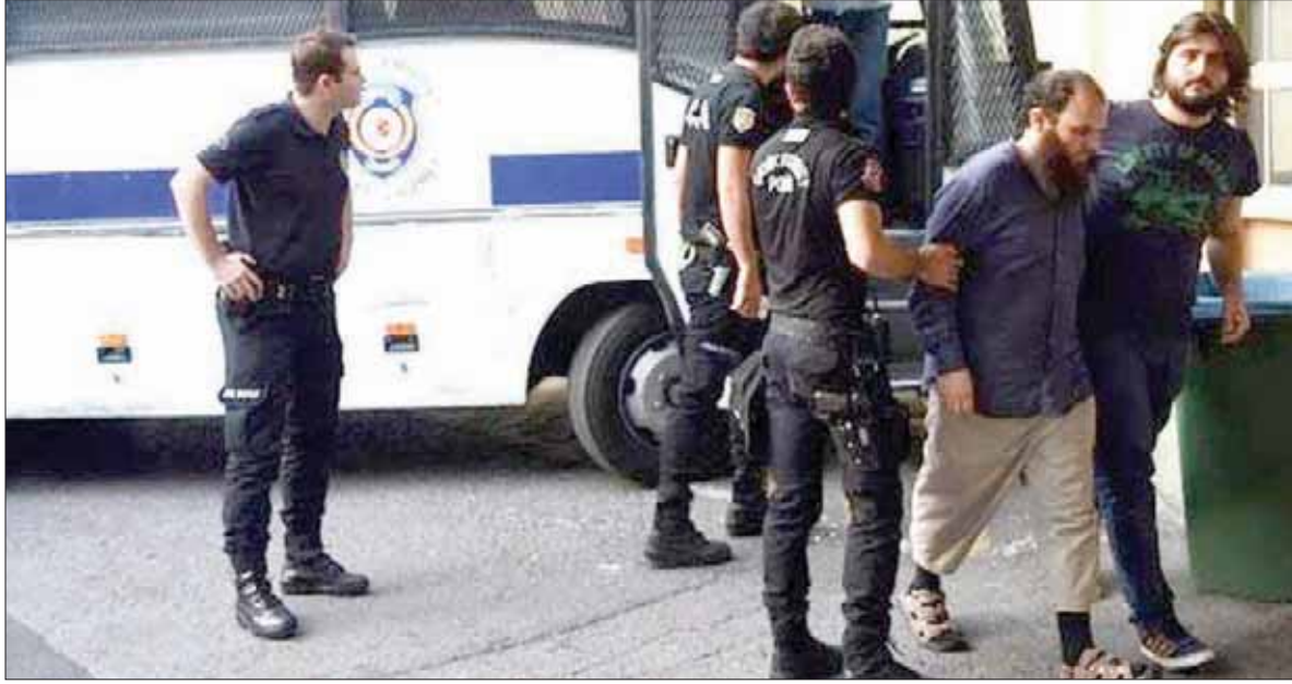
قوات مكافحة الإرهاب التركية ألقت أمس القبض على 22 يشتبه بانتمائهم إلى «داعش» في شرق البلاد