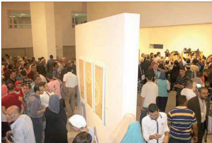
زوار في إحدى قاعات الملتقى

الملقب بـ«شيخ الخطاطين»، الذي سيحتفي بمسيرته، ويكرم طوال أيام الملتقى. ويكرم الملتقى العام للفنان المصري العالمي أحمد مصطفى، والفنان فكري سليمان، والفنان الدكتور مصطفى عبد الرحيم العلي (الكويت). ومن ضيوف الشرف الفنان عاصر بن الهادي بن جدو (تونس)، والفنان حميد الخربوشي (المغرب)، والفنانة غادة الحسن (السعودية)، وضيوف الشرف من الباحثين الدكتور رشيدة بنت محمد بن سالم الديماسي (تونس)، وأحمد بن طاهر الخضري (السعودية)، وسبقام حفل إعلان جوائز الملتقى، وتكريم المشاركين يوم الاثنين المقبل، في تمام الساعة الثامنة مساءً، على المسرح الصغير بدار الأوبرا.