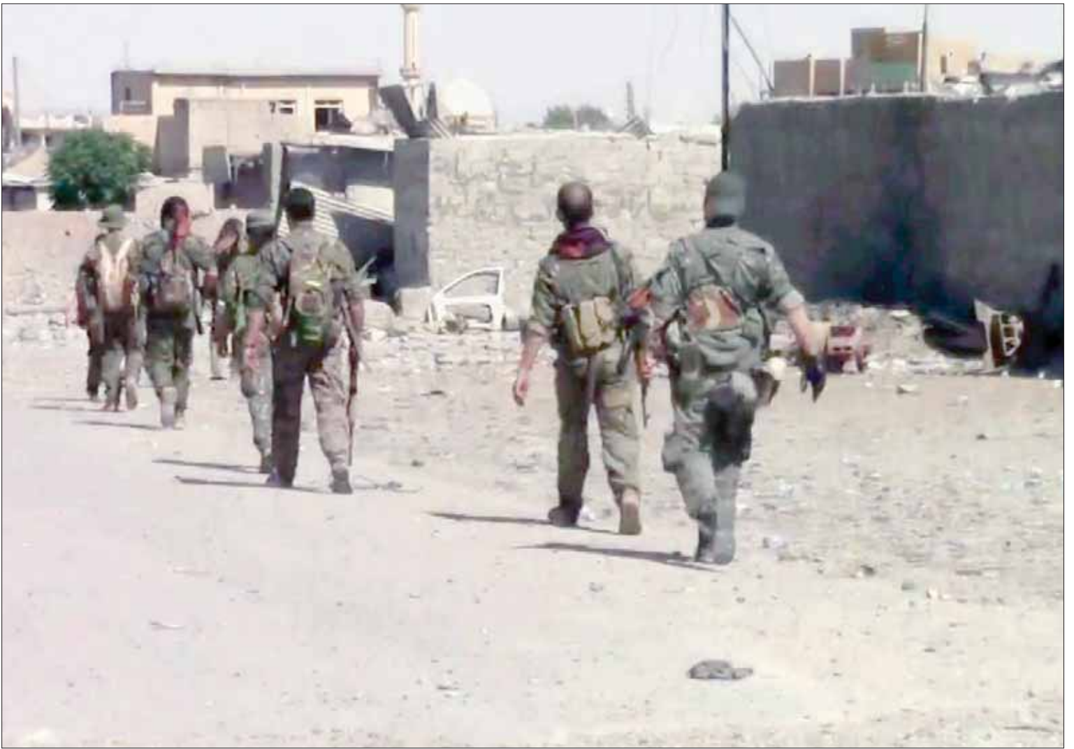
عناصر من «قوات سوريا الديمقراطية» تتقدم في الرقة

أوضح رئيس الجمهورية اللبنانية العماد ميشال عون، أن اللقاء الحواري الذي دعا إليه الاثنين المقبل في قصر بعبدا في حضور رئيس مجلس الوزراء الرئيس سعد الحريري، وعدد من الوزراء المختصين وممثلين عن القطاعات المختلفة، هدفه إيجاد حل للخلاف الذي نشأ حول قانون سلسلة الرتب والرواتب وقانون استحداث ضرائب لتمويل هذه السلسلة، مشدداً على وجوب أن يراعي هذا الحل «مصالح جميع اللبنانيين من دون أن يفقر فئة أو يغني فئة أخرى، ذلك أنه في ظل أوضاع اقتصادية صعبة كالتي يعيشها لبنان ليس في مقدور أحد الحصول على ما يتمناه ويريده، أو يحقق له مصالحه دون مصالح الآخرين».