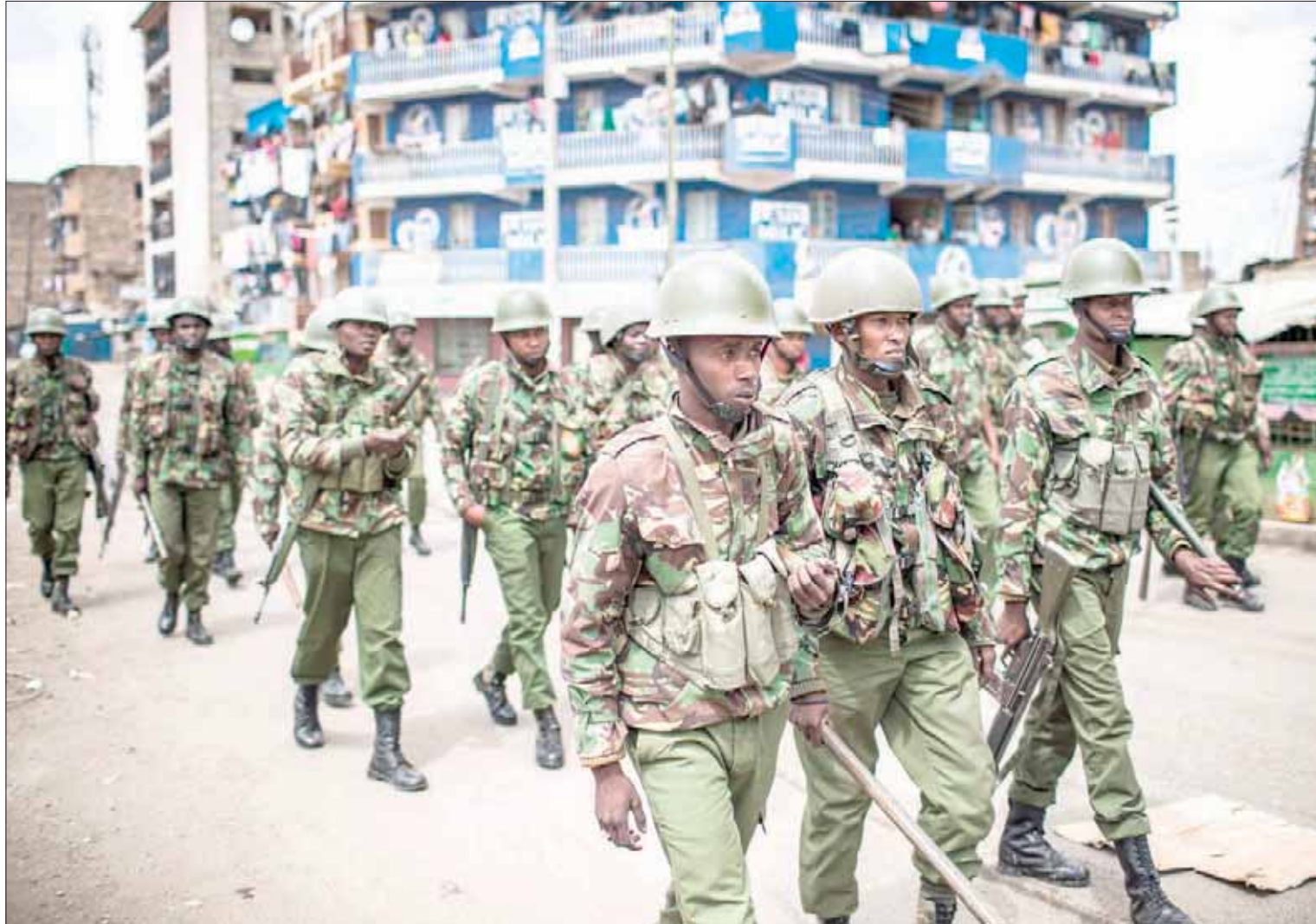
قوات كينية تجوب شوارع نيروبي تحسبا لاندلاع أعمال الشغب

نواكشوط - «الشرق الأوسط» أقت الشرطة الموريتانية في وقت متأخر من ليل الخميس الجمعة القبض على عضو مجلس الشيوخ المعارض محمد ولد غده، بعد أن رفضت السماح له بمغادرة البلاد قبل ساعات من القبض عليه. وقالت مصادر قريبة من عضو مجلس الشيوخ إن عناصر من الأمن حضروا إلى بيت ولد غده، وأمره بمراقبتهم. تجدر الإشارة إلى أن استقالة شعبياً أجري في الخامس من الشهر الحالي، ألغى مجلس الشيوخ الذي ينتمي إليه ولد غده، الناشط ضمن مجموعة من الشيوخ المناوئين للاستفتاء.