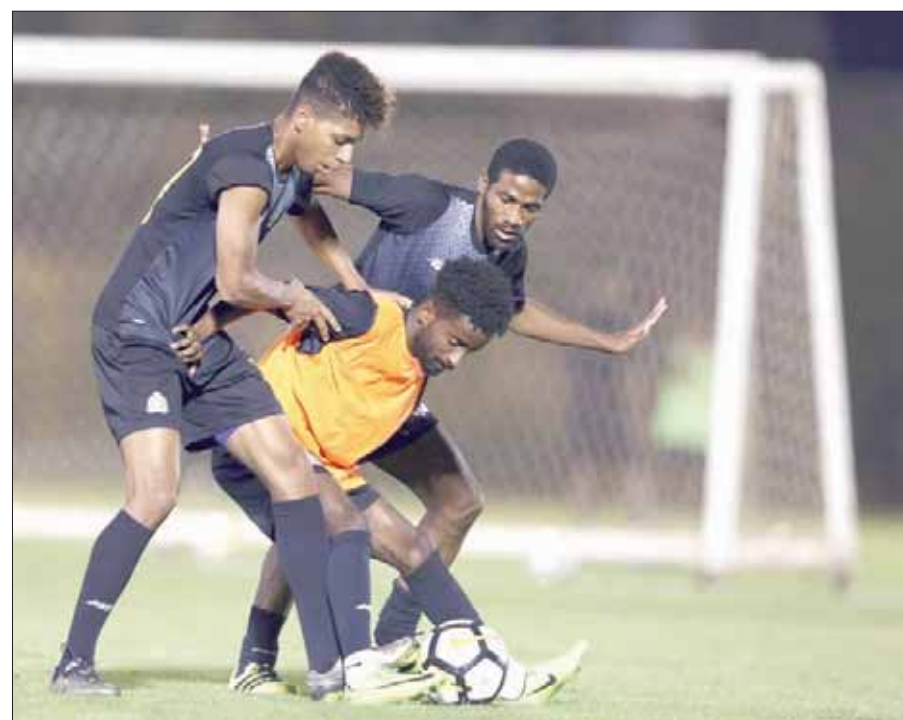
من استعدادات النصر الأخيرة لمباراة الفيصلي