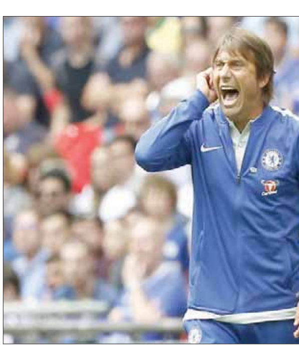
كونتي يخشى تكرار السيناريو الأسوأ (أ.ب.)

ورغم إنفاق النادي نحو 126 مليون جنيه إسترليني (164 مليون دولار) لضم الفارو مورانا وأنطونيو روديجر وتيموي باكايوكو إضافة إلى تعاقب مع ويلي كابييري في صفقة انتقال حر، لا يزال كونتي يواجه تساؤلات بشأن بعض المراكز. وقال كونتي: «من المهم بالنسبة لنا تعزيز القوة العديدة لفريقنا لأننا لدينا فريق صغير.. ضم لاعب واحد لا يعد كافياً لتطوير فريقنا، فنحن بحاجة إلى المزيد.. نحاول إنجاز أفضل ما بوسعنا من أجل الفريق. الآن علينا الانتظار والتخلي بالصبر في طريق تطوير الفريق».