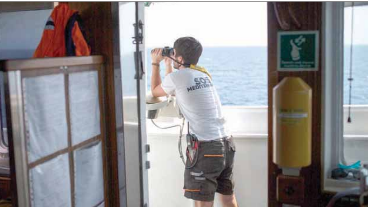
سفينة إنقاذ أوروبية تجوب البحر في محاولة لإنقاذ المهاجرين الذين يتوجهون إلى أوروبا انطلاقاً من السواحل الليبية