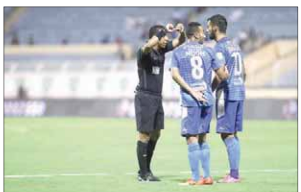
الفتح تلقى خسارة كبيرة مع انطلاقته الدوري السعودي