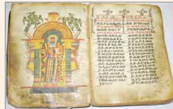
مخطوطتان محفوظتان في المكتبة الإثيوبية