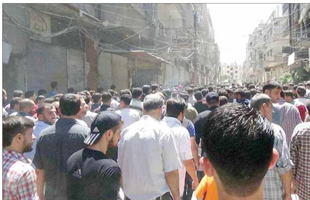
مظاهرة ضد النظام في غوطة دمشق أمس

الموت في مياه البحر المتوسط. من ناحية أخرى، شدد بلديري على أن بلاده لن تسمح إطلاقاً لمساعي إقامة دولة مصنعة جديدة على حدودها، لا سيما في سوريا والعراق (في إشارة إلى مساعي الأكراد في سوريا لإقامة كيان كردي وإعلان إدارة إقليم كردستان العراق إجراء استفتاء على الاستقلال عن العراق في 25 سبتمبر/ أيلول المقبل)، قائلاً إننا نواصل مفاوضاتنا في هذا الشأن مع الدول المعنية. وأكد بلديري أن تركيا لن تتردد في الرد بالشكل المناسب كما فعلت سابقاً عند استهداف أي من مصالحها وسيادتها وأمنها القومي. وترفض أنقرة الدعم المقدم من واشنطن لوجبات حماية الشعب الكردية، الجناح العسكري لـ«حزب الاتحاد الديمقراطي» الكردي السوري وأكبر مكونات تحالف «قوات سوريا الديمقراطية»، في إطار الحرب على «داعش»، والعمليات الحالية لتحرير الرقة، معقله في الشمال السوري، لمخاوفها من التوافق على خفض التصعيد العسكري في بعض المناطق في سوريا، قائلاً: «صربنا الآن قادرين على توصيل كثير من المساعدات الإنسانية والغذائية والطبية إلى تلك المناطق» ولفت إلى أن كلاً من مفاوضات جنيف وأستانة تقدمان إسهامات من أجل حل الأزمة السورية.