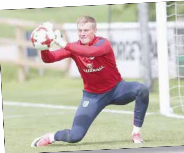
التعاقب مع بيكفورد حل مشكلة إيفرتون في حراسة المرمى («الشرق الأوسط»)