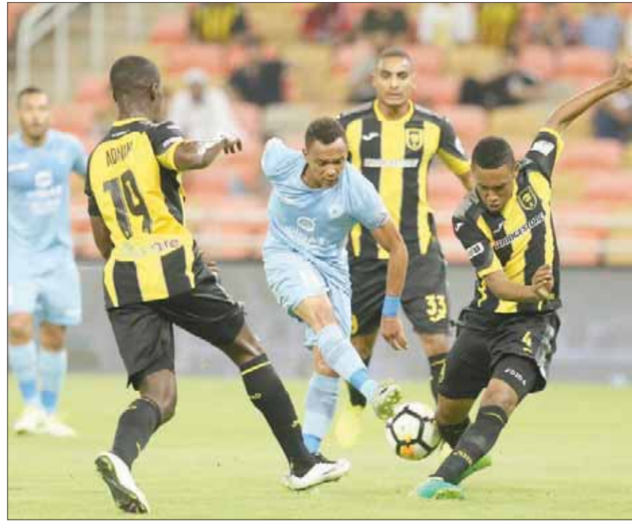
جانب من المواجهة التي جمعت الاتحاد والباطن