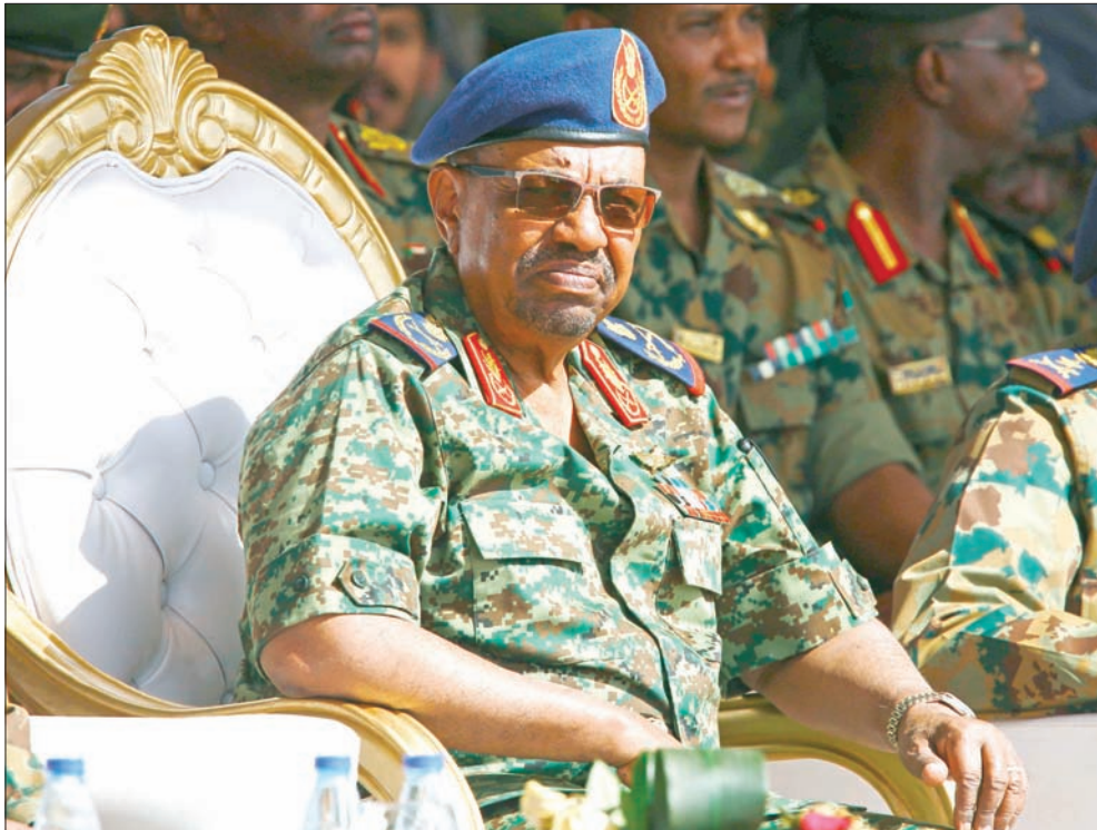
الرئيس السوداني عمر حسن البشير

وقال غندور إن واشنطن تأمل في إقامة «علاقات جيدة» مع السودان، مشيراً إلى أن ما جاء في تقرير الخارجية الأمريكية الذي صدر قبل أيام بمثابة «صك براءة» للسودان.