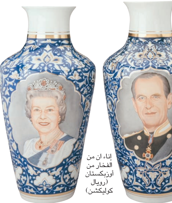
إناء من الفخار من أوزبكستان (رويال كوليكتشن)

ذكري أميرة ويلز الراحلة، بمناسبة مرور 20 عاماً على وفاتها. العرض يقدم تحية لديانا ولخدماتها لبريطانيا، عبر عرض مكتبتها مكتمل ببعض الأوراق التي تحمل خط يدها، والصور المختلفة التي تصور ديانا مع الأميرين ويليام وهاري، وبعض المتعلقات الخاصة بها، مثل حقيبة أورانج تحمل الحرف «سينسر»، وحقيبة أخرى تحمل مجموعة من شرائط الكاسيت محملة بموسيقى وأغان محببة للأميرة الراحلة، كل ذلك إلى جانب الصور المختلفة لديانا خلال مراحل حياتها.