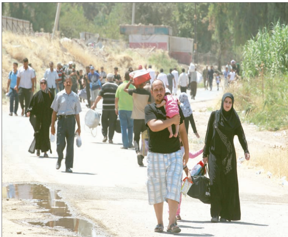
مواطنون يمشون في شوارع الموصل شرق الموصل بغربها

ويشير التاريخ إلى أن التدريب قد لا يكون كافياً. فقد انفتحت الولايات المتحدة 25 مليار دولار على الجيش العراقي خلال فترة الاحتلال الأميركي الذي أسقط صدام حسين في 2003