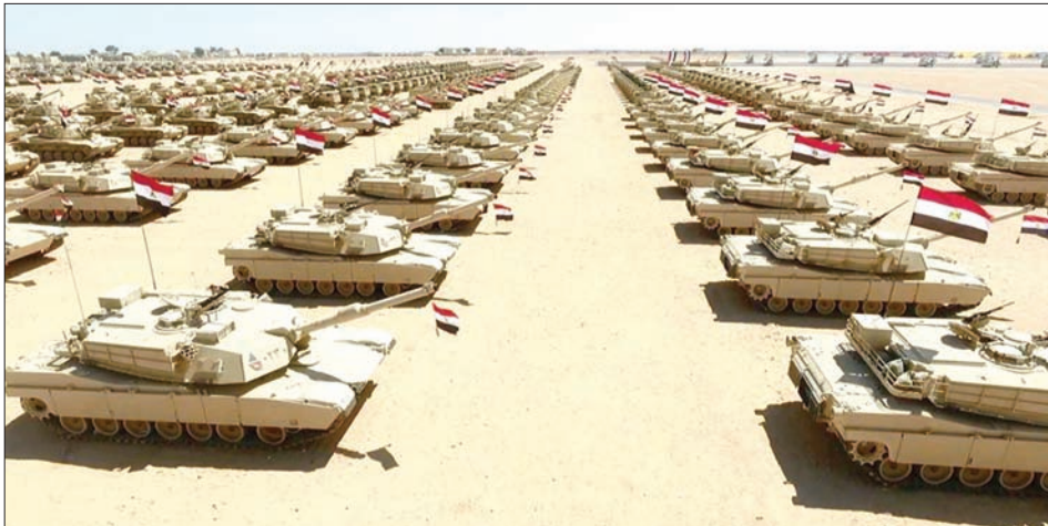
صورة للقاعدة العسكرية المصرية الجديدة على الحدود مع ليبيا

استبقت أمس إيطاليا الاجتماع المزمع عقده الأسبوع المقبل في العاصمة الفرنسية بين المشير خليفة حفتر قائد الجيش الوطني الليبي، وفائز السراج رئيس حكومة الوفاق الوطني الليبية، للدعوة إلى حصر مهمة المفاوضات على إنهاء الأزمة الليبية في شخص رئيس بعثة الأمم المتحدة لجسار غسان سلامة، الذي راجت تكهنات أمس بأنه قد يشارك في هذا الاجتماع. وأوضح وزير الخارجية الإيطالي أنجيلينو الفانو في مؤتمر صحفي عقده أمس بوزارة الخارجية الإيطالية، عقب اجتماعه مع نظيره السعودي عادل الجبير، أنه كانت هناك صيغ تفاوض مختلفة يتعين أن تقدم نتائجها إلى سلامة حتى يتحتم من توليفها، وفقاً لنقله وكالة «آكي» الإيطالية. وتحدثت أوساط إعلامية إيطالية عن توجيه فرنسا دعوة إلى غسان سلامة، وزير الثقافة اللبناني الأسبق، الذي سيبدأ بشكل رسمي