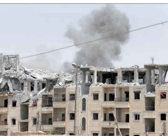
سحب الدخان تتصاعد بعد غارة للتحالف على الرقة (أب)

واصطلت «قوات سوريا الديمقراطية»، أمس (الجمعة)، تقدمتها في شمال وجنوب مدينة الرقة، معقل تنظيم داعش في الشمال السوري، فيما أفاد المرصد السوري لحقوق الإنسان» عن خرق قوات النظام مرة جديدة للهندة في جنوب اللجاة بريف رخلا الشمالي الشرقي بعد من الغدائف. وأبلغت مصادر موثوقة «المرصد» أنه جرى تخريج دورة من عناصر قوات الأمن الداخلي في محافظة الرقة، وفي التفاصيل التي حصل عليها المرصد السوري، فإن التحالف الدولي أشرف على تدريب نحو 260 عنصرًا من المتطوعين من قاطني محافظة الرقة، وجرت عمليات التدريب بإشراف وتمويل وتدريب من قبل التحالف الدولي ومدربين تابعين له، كما أكدت مصادر أن تسليم قوى الأمن الداخلي في الرقة وتمويلهم عائد للتحالف الدولي، حيث جرت عملية