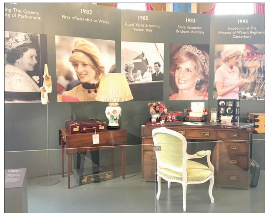
مكتب الأميرة ديانا وصورها