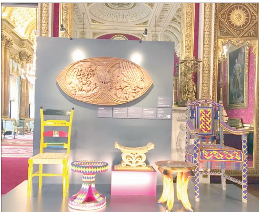
من الهدايا التي قدمت للملكة إليزابيث

دمية شعبية من إندونيسيا