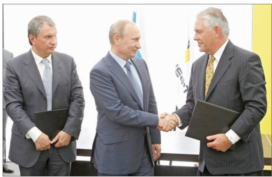
الرئيس الروسي فلاديمير بوتين مصافحاً وزير الخارجية الأميركي الحالي ريكس تيلرسون في 2012

هناك من تأثير يذكر على أي من أنشطتنا التجارية في روسيا حتى ملحوظ على العلاقات. والشركات تواصل العمل سوياً كالمعتاد». ولقد اختار الرئيس ترمب تيلرسون في منصب وزير الخارجية أول الأمر، حتى برغم وجود تاريخ من علاقات العمل سوياً من قبل. وخضع تيلرسون للتدقيق من قبل المشرعين في كلا الحزبين بسبب علاقاته الوثيقة ببوتين وعلاقات الأعمال السابقة في روسيا، بيد أنه حصل على التأييد القانوني لمنصبه الوزاري بتصويت يتراوح بين 56 و43 صوتاً. وفي عام 2013، فاز تيلرسون بجائزة من الحكومة الروسية تحمل اسم «جائزة الصداقة» بعد التوقيع على الصفقات مع شركة روزنيفت والتي بدأ بموجبه برنامج الحفر في بحر كارا في القطب الشمالي.