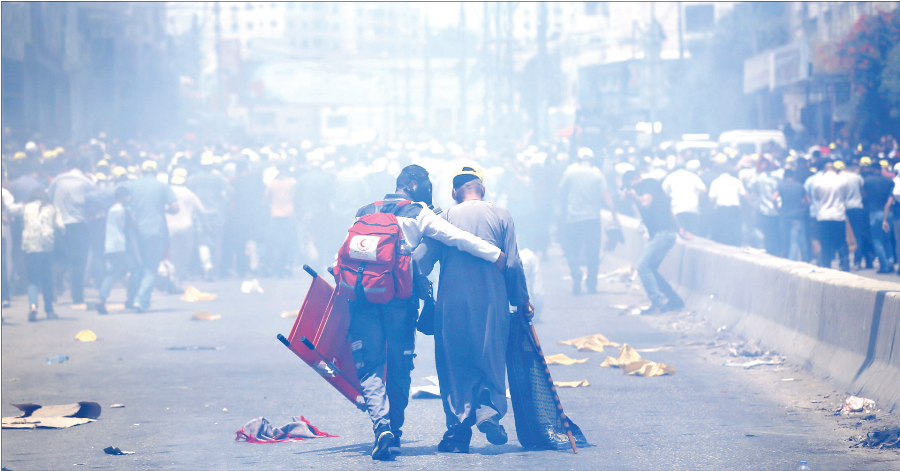
رام الله، كفاح زيون

لقد اختصر وزير الأمن الإسرائيلي جلعاد أزدان الموقف برمته في تعقيبه على الاعتراضات المتزايدة على تركيب الشرطة الإسرائيلية هذه البوابات على أبواب المسجد الأقصى في أعقاب هجوم فلسطيني أودي بحياة 2 من الشرطة الإسرائيلية، بقوله إنها «مسألة سيادة»، مضيفاً أن «إسرائيل غير ملزمة بأخذ موقف الأردن بعين الاعتبار، بكل ما يتعلق بتنفيذ القرارات التي تتخذها بشأن الحرم القدسي الشريف، وبما أن إسرائيل هي صاحبة السيادة في الحرم القدسي، فإن مواقف الدول الأخرى غير مهمة، وعليه، فإنه وبحال تم اتخاذ قرار له أسباب معينة، فعلياً تطبقه دون الخضوع للضغوط الخارجية».