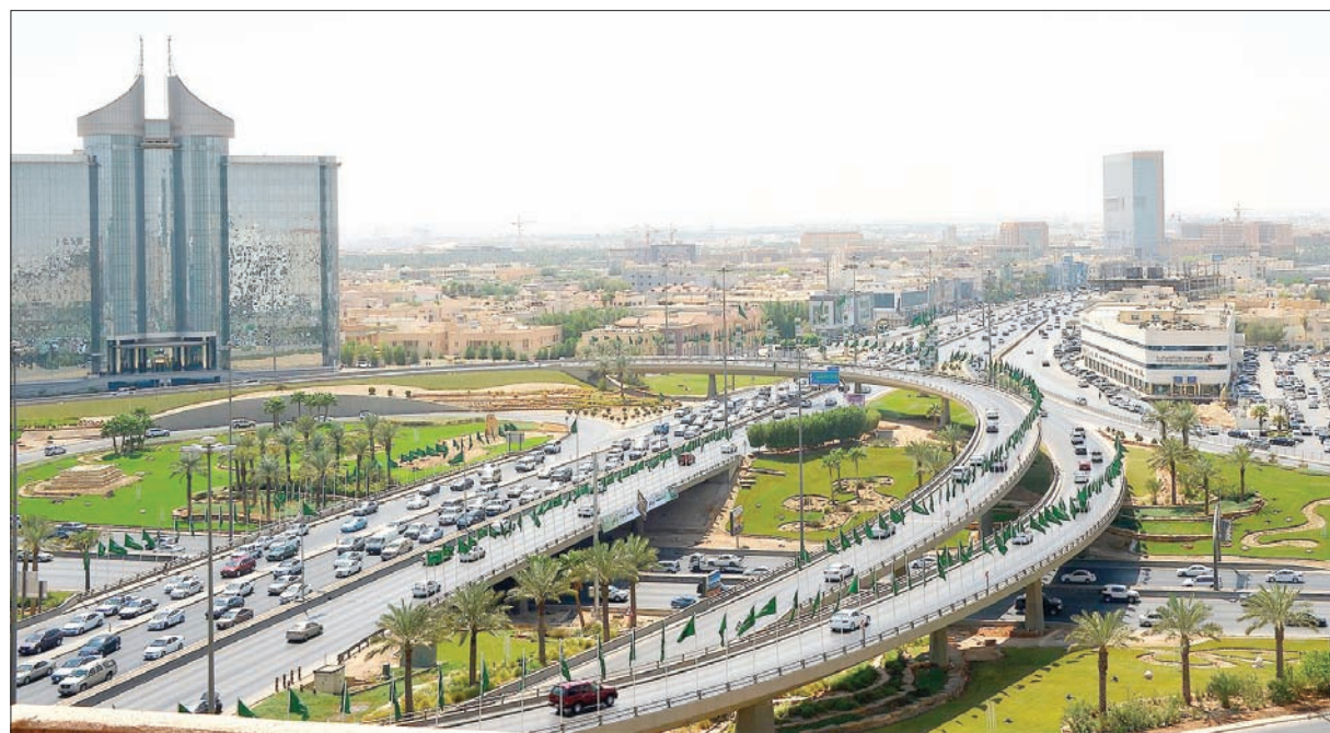
ستسجل السعودية تطوراً ملحوظاً على صعيد النمو الاقتصادي

المالية السعودية، ونقلها لمصاف الأسواق العالمية». كما شملت الأوامر الملكية الكريمة إنشاء ناطق خاص بالإبل، وهو النادي الذي من المتوقع أن يتولى مهام المهرجانات الكبرى التي ستقام للإبل، بالإضافة إلى أن هذا النادي سيكون محوراً هاماً في تنظيم مزارات الإبل الدولية، مما يجعل السعودية واحدة من أهم الأسواق العالمية في هذا المجال الحيوي. وتأتي الأوامر الملكية الكريمة التي أصدرها خادم الحرمين الشريفين الملك سلمان بن عبد العزيز، في وقت تعمل فيه المملكة بشكل ملحوظ على حزمة من الإصلاحات الاقتصادية، التي تستهدف تنويع الاقتصاد، وتقليل الاعتماد على النفط، ومنح القطاع الخاص فرصة أكبر للمشاركة مع القطاع الحكومي. وفي هذا الشأن، باتت السعودية تتجه بشكل جاد إلى تقليل الاعتماد على النفط كمصدر دخل رئيسي، من خلال تنويع مصادر الدخل، عبر خصخصة بعض القطاعات الحكومية، وإدراج جزء من أسهم الشركات الكبرى للاختتاب العام، ورفع وتيرة الإنتاج الصناعي، وتحفيز القطاع الخاص على النمو، والاستثمار في الأسواق المالية، مع التركيز في الوقت ذاته على الأدوات الاستثمارية الأخرى المناسبة. وأصبحت مرحلة ما بعد النفط في السعودية حدثاً تاريخياً بارزاً، تستجيب من خلاله البلاد تطوراً ملحوظاً على صعيد النمو الاقتصادي، ورسم ملامح الاقتصاد، وتعزيز مصادر قوته، الأمر الذي يدفع الاقتصاد السعودي إلى الأضي قدماً في نموه وازدهاره، مما يساهم بالتالي في تحقيق «رؤية المملكة 2030».