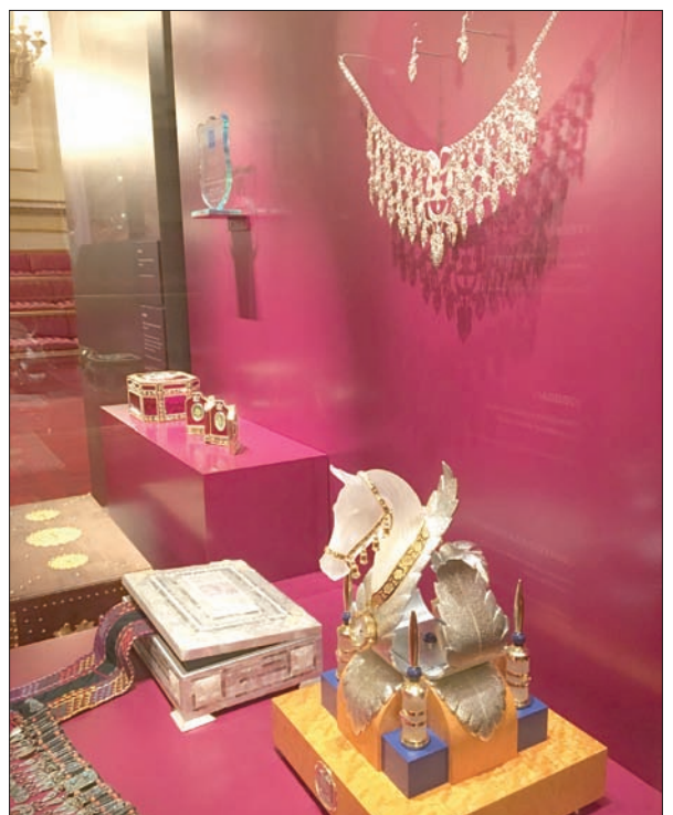
هدايا عربية .. من الإمارات والأردن واليمن