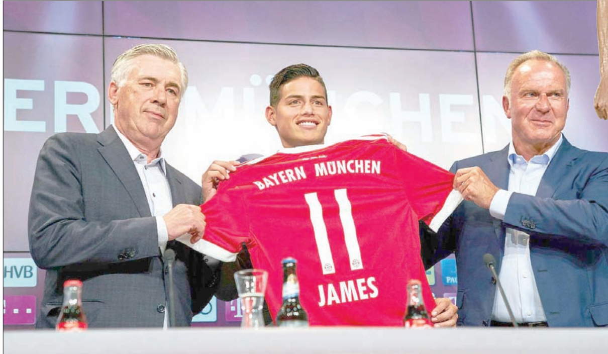
رودريغيز عاد إلى مدربه انشيلوتي (يسار) بعد أن كان محط أنظار تشيلسي ومانشستر يونايتد

انتقل داني سيبالوس إلى صفوف ريال مدريد، الذي أصبح لديه وفرة كبيرة في لاعبي خط الوسط المميزين. وكان سيبالوس هو ثالث أفضل لاعب في الدوري الإسباني