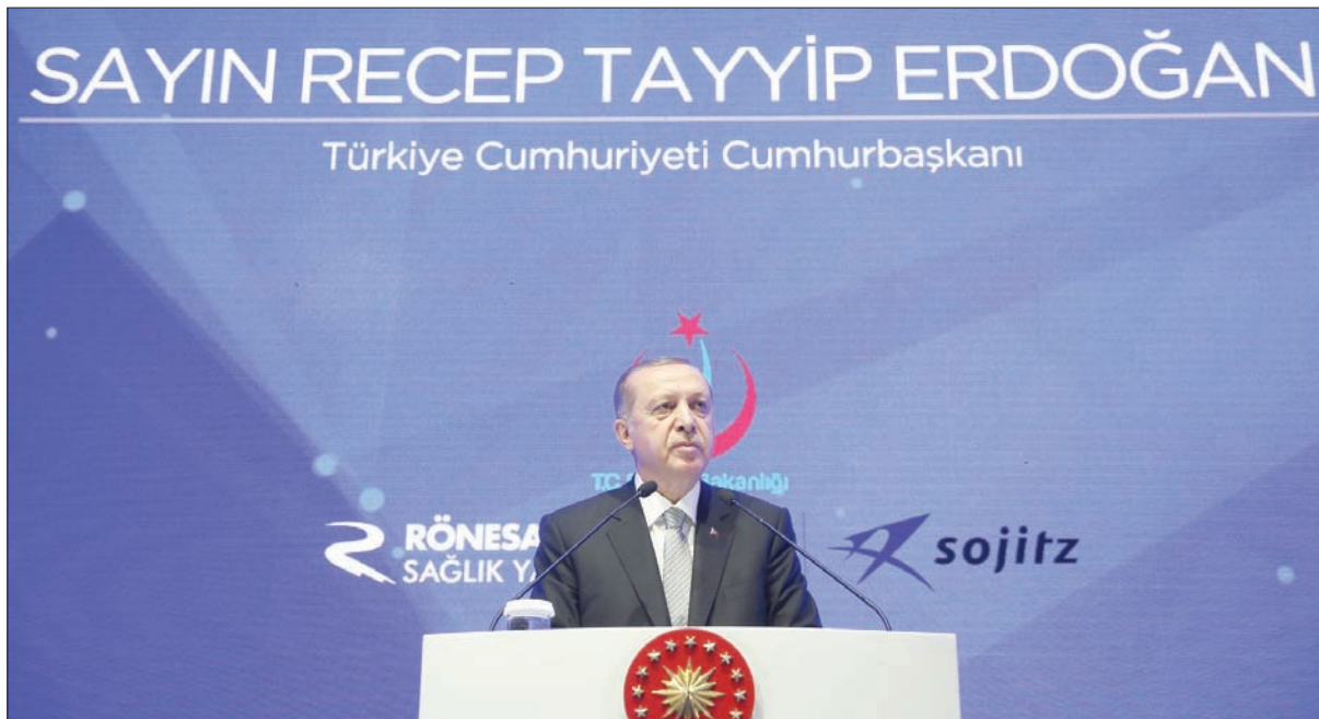
رجب طيب أردوغان يلقي كلمة في إسطنبول أمس

لتنفيذ ذلك وطالب بتجاهل القضاء التركي، بأسلوب بعيد عن البلاغة الدبلوماسية. وأوضح جاويش أوغلو، أن تركيا تدرس التهديدات الألمانية تجاهها، وستقدم الرد المناسب عليها. وقال إن ألمانيا باتت الدولة الرئيسية التي تحتضن جميع الإرهابيين، الذين يعملون ضد تركيا، ويواصلون أنشطتهم فيها، على غرار عناصر العمال الكردستاني واتباع غولن.