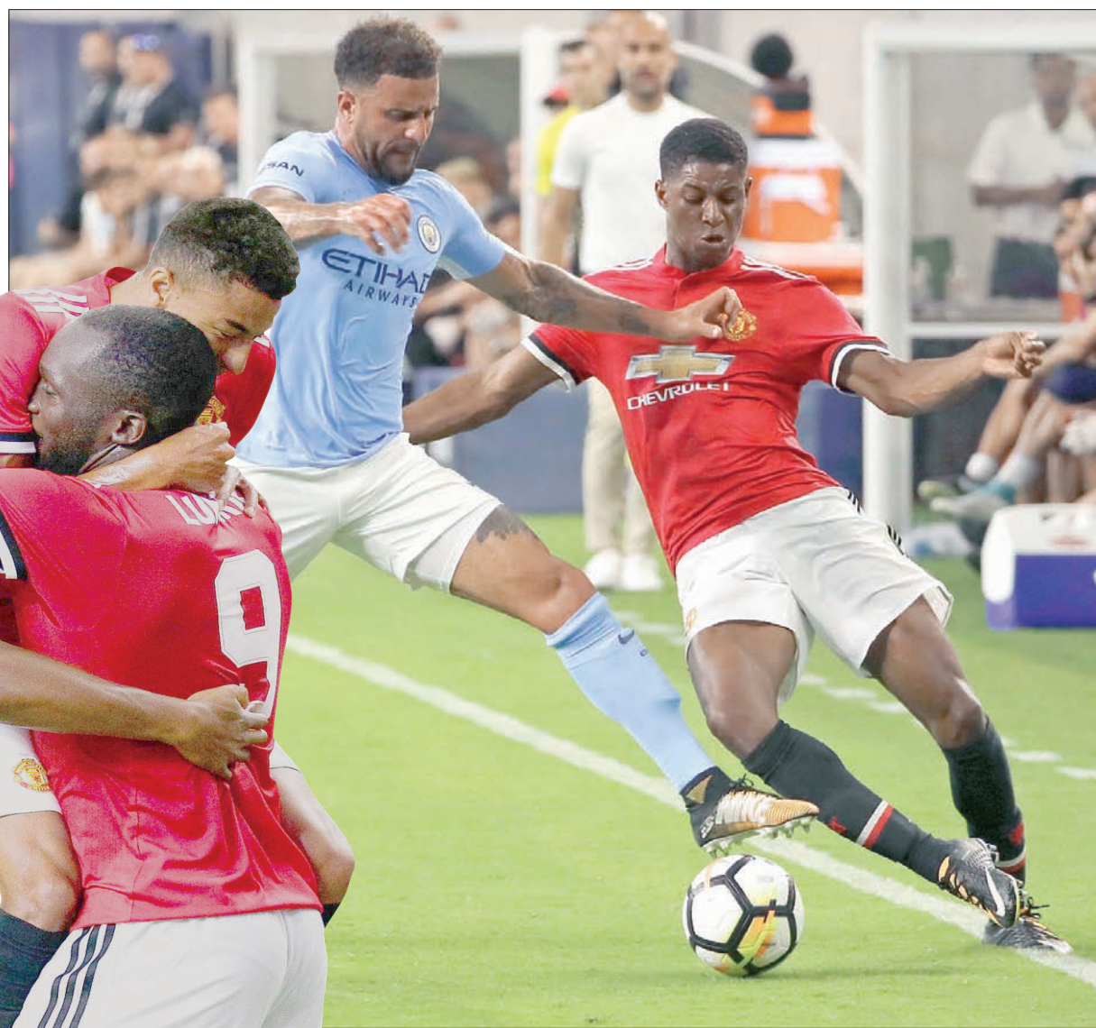
راشفور مهاجم يونائيد (يمين) في صراع على الكرة مع ووكر مدافع سيتي في أول مشاركة له مع الفريق

جو هارت والنمسواي ماركو إرنانوتوفيتش. وبالتالي، الفرق مجتهد جدا في سوق الانتقالات وأنا بانتظار المزيد من يونائيد». وقال مورينيو: «المنافسة بالدوري لإنجليزي ستكون متكافئة، بوجود تشيلسي، ليفربول، وإيفرتون، وريال سولت، الأوربية، ما يعني خوضهم مباريات أكثر». وأوضح: «الموسم الماضي، كان تشيلسي، ليفربول، وريال سولت، الأوربية، ما يعني خوضهم مباريات أكثر». وأضاف: «الموسم الماضي، كان تشيلسي، ليفربول، وريال سولت، الأوربية، ما يعني خوضهم مباريات أكثر». وأضاف: «الموسم الماضي، كان تشيلسي، ليفربول، وريال سولت، الأوربية، ما يعني خوضهم مباريات أكثر».