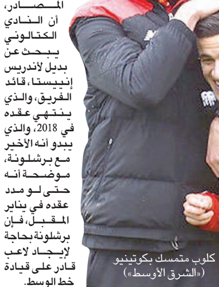
كلوب متمسك بكويتينو

ممتازة، والدوري الممتاز، نحتاج إلى التمسك باللاعبين مثل فيلبي». ووقع كويتينو الذي يدافع عن اللون ليفربول منذ 2013 قادما من إمبرميران الإيطالي، في يناير (كانون الثاني) الماضي عقدا جديدا مع فريقه الحالي لمدة خمسة أعوام لا يتضمن بندا جزائيا يسمح له بالرحيل إذا دفع المبلغ المطلوب. ويرى كلوب، الطامح إلى منح ليفربول لقبه الأول في الدوري