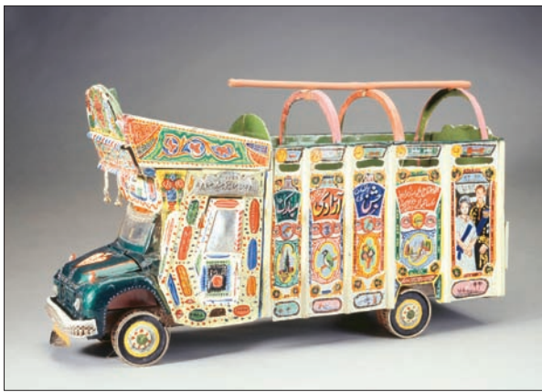
مجسم لشاحنة من باكستان مزين بالرسومات والنقوشات