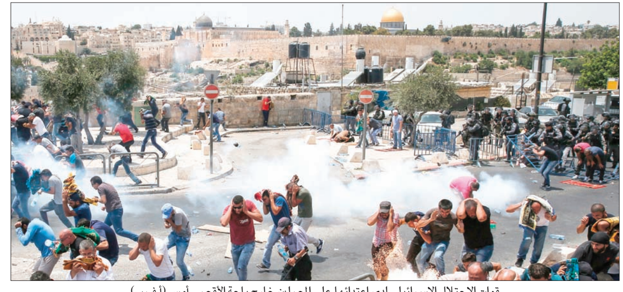
قوات الاحتلال الإسرائيلي لدى اعتدائها على المصلين خارج باحة الأقصى أمس

وذكرت هذه المصادر أن الاتصالات المكثفة بين إسرائيل والأردن تجري إلى جانب جهود من خلف الكواليس تشارك فيها كل من الولايات المتحدة والعربية السعودية ومصر. وقالت مصادر فلسطينية إن الرئيس محمود عباس غاضب من استغناء السلطة الفلسطينية عن الاتصالات الجارية أيضاً من اللجنة المذكورة.