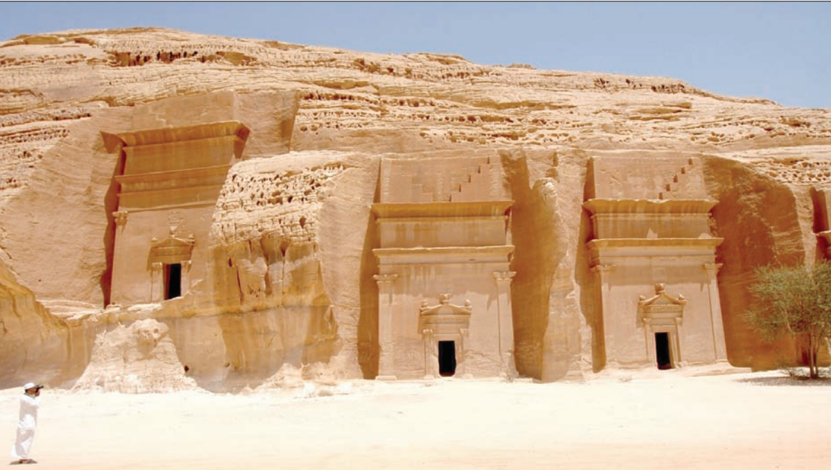
مدائن صالح من أهم معالم العلاء السياحية