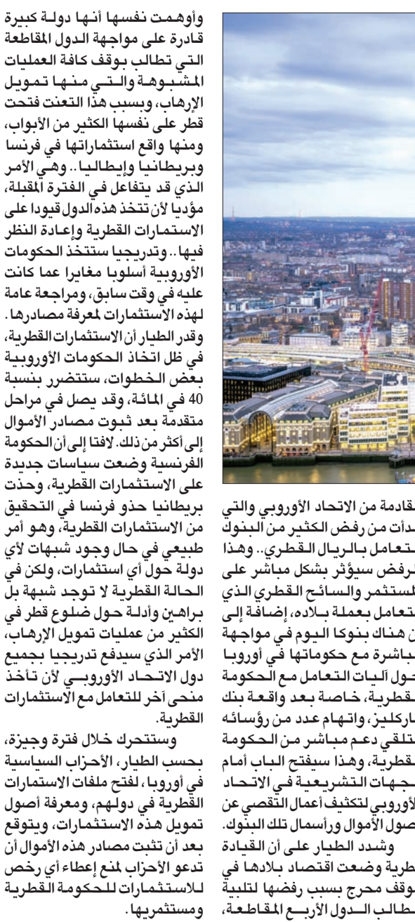
جدة، سعيد الأبيض

عصام المرزوق الذي يتراس الاجتماع الوزاري إن الدول الرئيسية المنتجة للنفط ستناقش اتفاق خفض الإمدادات العالمي وتراجع أوضاع السوق وتدرس أي مقترحات بخصوص الاتفاق. وأبلغ المرزوق وكالة الأنباء الكويتية يوم الجمعة أن الاجتماع سيناقش «الخطوات المستقبلية للاستمرار في تنفيذ الاتفاق ومناقشة أي اقتراحات من الأعضاء». وستحيل اللجنة أي توصيات توافق عليها إلى الدول الأعضاء. وللجنة تقديم توصيات لأوبك ومنتجي النفط الآخرين لتعديل الاتفاق إذا اقتضت الضرورة. وتراس الكويت للجنة الوزارية المشتركة لأوبك والدول غير الأعضاء التي تراقب مستوى الالتزام باتفاق خفض إنتاج النفط 1,8 مليون برميل يومياً. بدأت التخفيضات في يناير (كانون الثاني) 2017، وتستمر حتى مارس (آذار) 2018. ولا يزال موضوع عدم التزام أوبك بالكمية المحددة بالاتفاق تحدي كبير لنجاحه. وما زالت أسعار خام برنت دون مستوى الخمسين دولاراً للبرميل المهم بفعل سواعت القلق من ارتفاع إمدادات أوبك رغم تعهدها بخفض الإنتاج في مسعى لتقليص العروض بالسوق. ويأسس تراجمت أسعار النفط بعد أن توقع تقرير لشركة استشارية ارتفاع إنتاج أوبك في يوليو رغم تعهد المنظمة ببيع الإنتاج، مما جدد المخاوف في السوق من استمرار تخمة العروض من الخام.