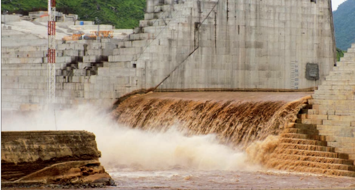
السلطات الإثيوبية أكدت اكتمال العمل بنسبة عالية في سد النهضة (الشرق الأوسط)

وتابع: «كما ترون وحسب الأجزاء المكونة للمشروع، فنحن على وشك إكمال المشروع المقدر له أن يجعل من إثيوبيا دولة رائدة»، وأضاف: «هو أجندة وطنية لشعبنا، وفي الوقت ذاته سيفيد البلدان الأخرى، ويزودنا بأداة لتطوير بلادنا ومواجهة عدونا التقليدي الفقر».