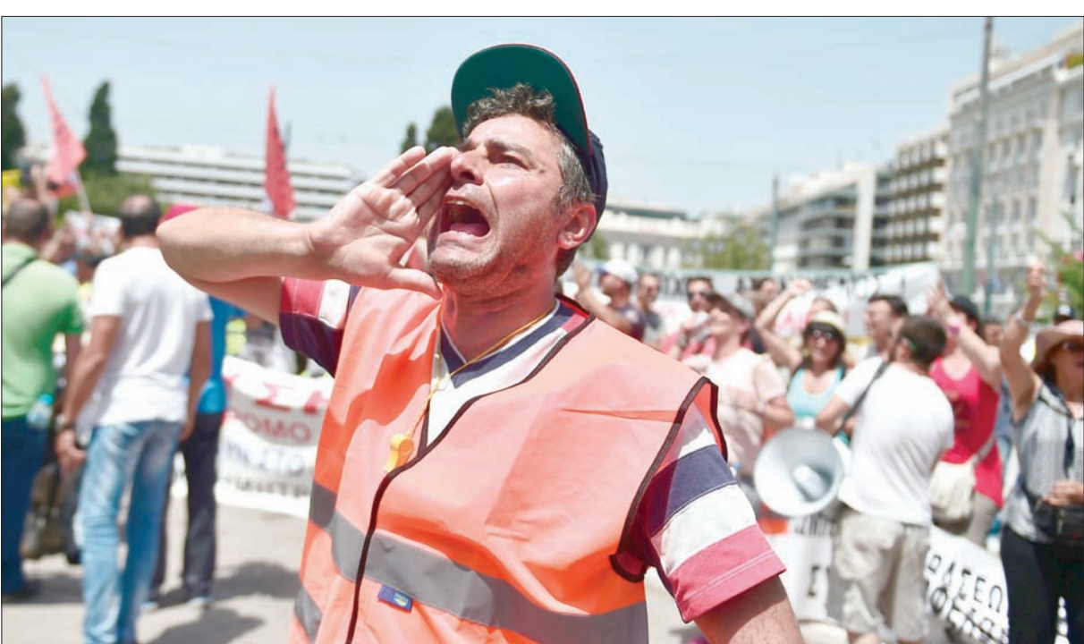
جانب من مظاهرة احتجاجية في وسط أثينا نهاية الشهر الماضي

المبدأ»، من أجل إقناع وزراء مالية منطقة اليورو بالإفراج عن الأموال التي تحتاج إليها اليونان بشكل بانس. ورفضت ألمانيا الأخذ بعين الاعتبار المزيد من تخفيف الدين، إلا إذا شارك صندوق النقد في برنامج القرض، ما أدى إلى عرقلة استمرار أشهرها. والخطوة غير الاعتيادية للموافقة على قرض دون الإفراج عن المبلغ كانت حلاً لتسوية الموقف، لكن المسؤولين عن القرض يقولون إنه لا يخالف القوانين. وقد تم استعمال هذا التكتيك سابقاً في 19 حالة في ثمانينات القرن الماضي، في الأرجنتين والبرازيل والمكسيك وغيرها. وفي وثائق عرضت خلال اجتماع مجلس الإدارة، مساء أول من أمس (الخميس)، قال مسؤولو المؤسسة المالية الدولية إن «الخلاف بين صندوق النقد والشركاء الأوروبيين لليونان تخلص، لكن استراتيجية تخفض الدين تعتمد على أهداف مرتفعة تاريخياً للفائض الأولي أو معدل النمو لفترات طويلة، لا تتمتع بالصدقية». وأكد الصندوق عند إعطائه موافقته أن الفائض الأولي (دون خدمة) حدد بنسبة 3,5 في المائة من إجمالي الناتج الداخلي، «لكن هذا الهدف يجب أن يخفض إلى نسبة أكثر واقعية في أسرع وقت