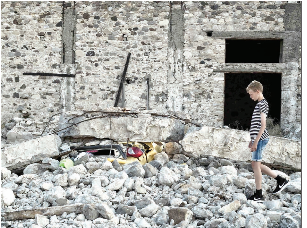
جانب من الدمار الذي خلفه الزلزال في الجزيرة السياحية التي تقع في بحر إيجه ويقصدها ملايين السياح سنويا

ريختر، واستمرت حتى الساعة 06,13 صباحا. وقالت والي موغلا أسنجول جيفالك، إن الزلزال لم يسفر عن أضرار مادية أو بشرية، وإنه تسبب بذعر كبير لدى المواطنين الذين هرعوا إلى الشوارع، وإن هناك إصابات طفيفة لدى عدد قليل من الأشخاص.