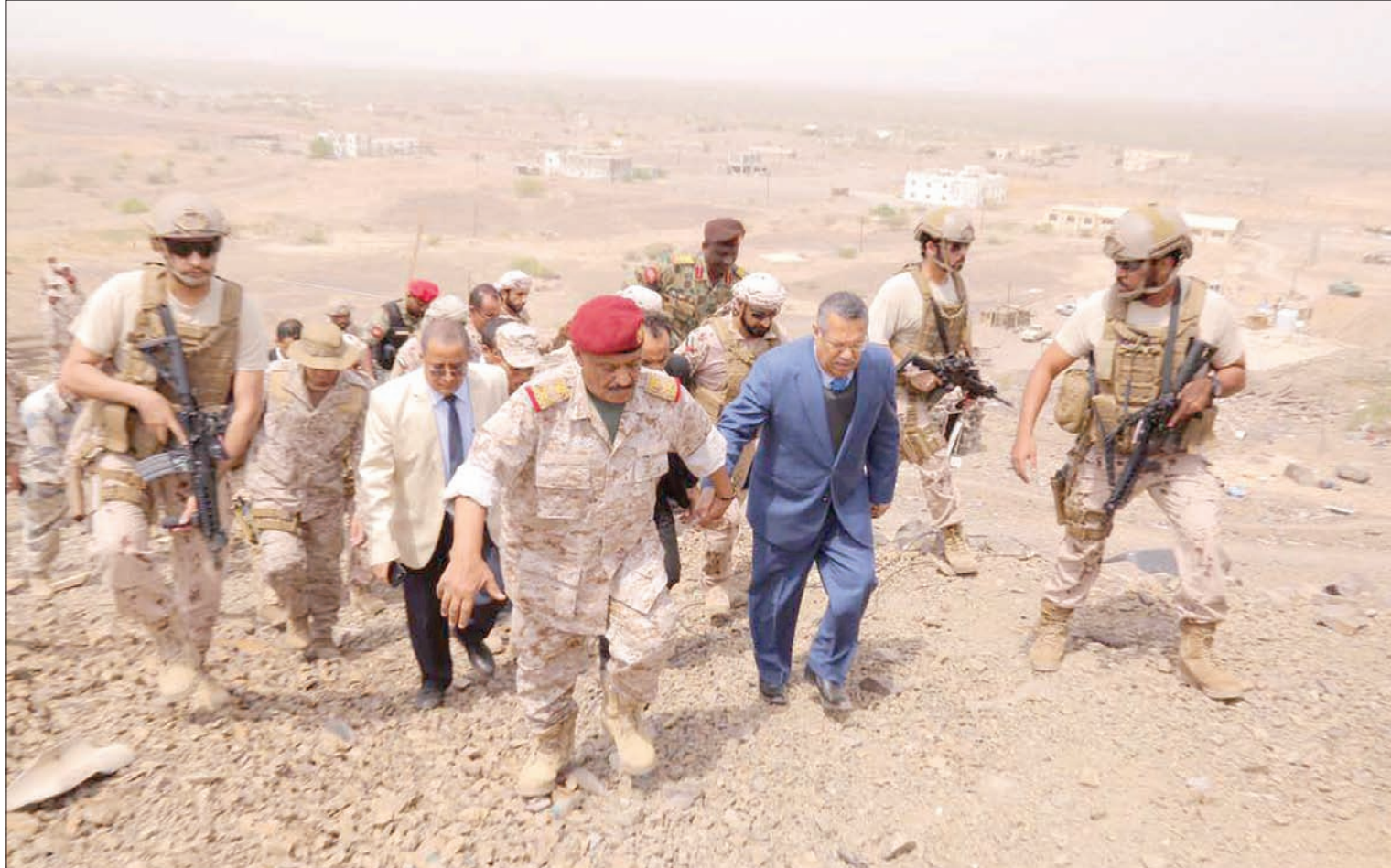
رئيس الوزراء اليمني تفقد قاعدة العند العسكرية وجهات قتال أخرى في كرش أمس

وأضاف: «حرصنا على السلام العادل والشامل وقدمنا كثيراً من الخنازلات، ولكن ذلك قوبل بتعنت ورفض الانقلابيين واستمرارهم في عدوانهم. لقد رفضوا مقترحات الأمم المتحدة الخاصة بالحديدة التي قبلتها الحكومة حرصاً منها على إنهاء معاناة شعبنا اليمني». ولفت إلى أن «استعادة السيادة وهزيمة الانقلاب ومحاربة القاعدة والتنظيمات الإرهابية الأخرى هي من أولويات الحكومة ولن نتحقق إلا بتكاتف الجميع والالتفاف حول القيادة السياسية متمثلة في الرئيس عبد ربه منصور هادي رئيس الجمهورية».