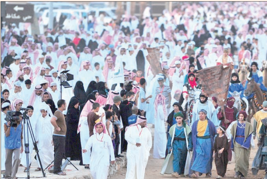
جانب من سوق عكاظ («الشرق الأوسط»)

العام الهيئة العامة للسياحة والتراث الوطني برنامجها الوطني «عيش السعودية» بالتزامن مع فعاليات سوق عكاظ في نسخته الـ11 الذي اشتمل على 50 رحلة سياحية بعنوان «رحلات عيش عكاظ» استفاد منها أكثر من 2500 طالب من 8 مناطق في المملكة بمشاركة 65 مرشداً سياحياً و10 منظمين للرحلات، وتضمن الرحلات من الرياض ومكة وجدة والطائف والأحساء وتبوك والدمام والباحة والمنطقة الشرقية والجوف.