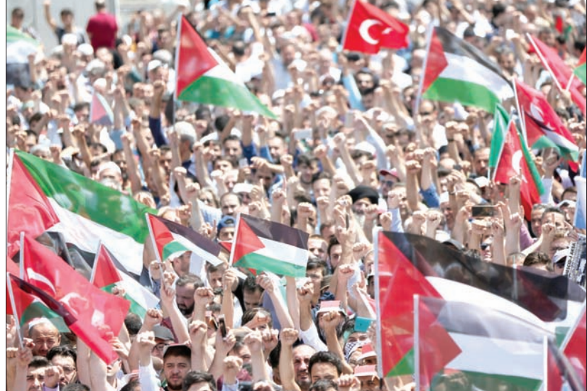
جانب من المظاهرة التي عرفتها إسطنبول احتجاجاً على الإجراءات الإسرائيلية في الأقصى (أ.ب.أ)

القانوني القائم في المقدسات». وحض الوزيران المجتمع الدولي على «بذل جهود سريعة وفاعلة لإنهاء التصعيد وتطويق الأزمة، عبر ضمان احترام إسرائيل التزاماتها القانونية والدولية، وإلغاء كل إجراءاتها الأحادية». وخلال اتصال هاتفي مع الممثلة الأعلى للسياسة الخارجية الأوروبية فيدريكا موغريني، حذر الصقليين من «عواقب استمرار التوتر الذي يجب تطويع عبر احترام إسرائيل الوضع التاريخي والقانوني القائم، وفتح المسجد الأقصى بشكل كامل وفوري».