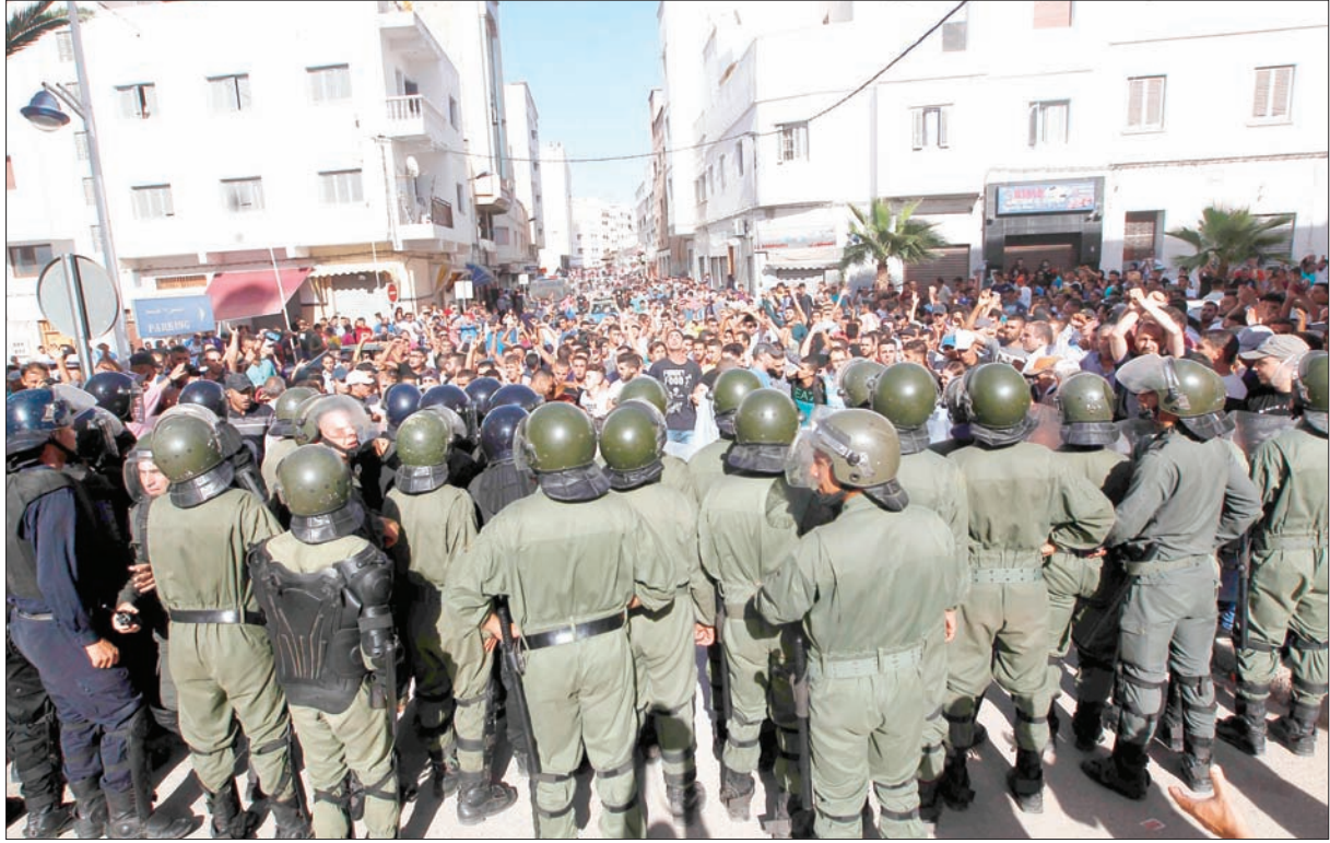
جانب من المواجهات التي عرفتها مدينة الحسيمة مساء أول من أمس بين المحتجين وقوات الأمن

في حصيلة أولية للمواجهات التي شهدتها مدينة الحسيمة المغربية أول من أمس، أفاد بيان صادر عن عمالة (محافظة) الحسيمة بأن 72 رجل أمن و11 متظاهرا أصيبوا بجراح خلال هذه المواجهات، موضحاً أن مجموعة من الأشخاص، تراوح عددهم بين 300 و400 شخص، حاولوا مساء الخميس تنظيم مسيرة احتجاجية بمدينة الحسيمة رغم القرار الصادر عن السلطات المحلية بعدم السماح بتنظيم المسيرة الاحتجاجية. وأضاف البيان أن عناصر مليتية ضمن هذه المجموعة «عمدت إلى استنفاذ القوات العمومية ومهاجمتها بالحجارة، مما أدى إلى إصابة 72 عنصراً من هذه القوات بجروح متفاوتة الخطورة، و11 شخصاً من المتظاهرين نتيجة استعمال الغازات المسيلة للدموع، تم نقلهم إلى المستشفى لتلقي الإسعافات اللازمة».