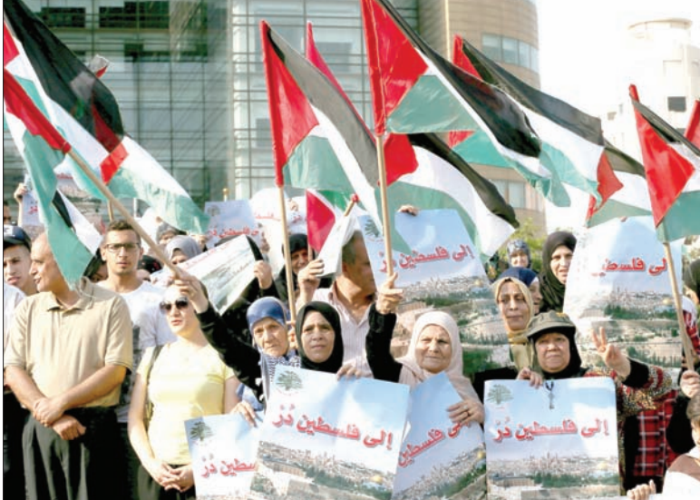
فلسطينيات يحملن أعلام فلسطين خلال المظاهرة التي عرفتها شوارع بيروت