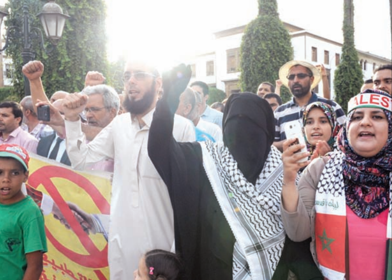
جانب من المظاهرات المؤيدة للفلسطينيين في مدينة الرباط المغربية