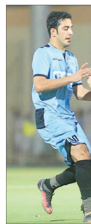
الباطن يعاني من صعوبات مالية قبل الموسم الجديد

وحقق الباطن الفوز في 6 مباريات على أرضه، فيما لم يحقق أي فوز خارجياً، وهذا يؤكد أن الفريق بحاجة إلى كسر هذا الحاجز في الموسم الجديد، إذا ما أراد لاعب البقاء لمواسم أخرى، بعد أن تم إلغاء ملحق البقاء رسمياً، وهو الملحق الذي خاضه الباطن في مناسبتين: الأولى بهدف الصعود، والثانية بهدف البقاء، قبل أن يتم إلغاء الملحق بعد عامين فقط من تطبيقه نتيجة عدم تحقيقه النجاح المطلوب، ولعدم تكافؤ الفرص بين الفريقين المتباريين، سواء من حيث اللاعبين الأجنبيين أو حتى المحليين. ومع أن الباطن لم يحقق في فوز خارج أرضه في الموسم الماضي، إلا