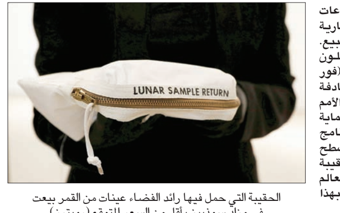
الحقيبة التي حمل فيها رائد الفضاء عينات من القمر بيعت في مزاد سويديز بأقل من السعر المتوقع