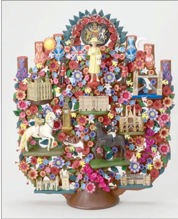
«شجرة الحياة» مجسم يصور محطات حياة الملكة