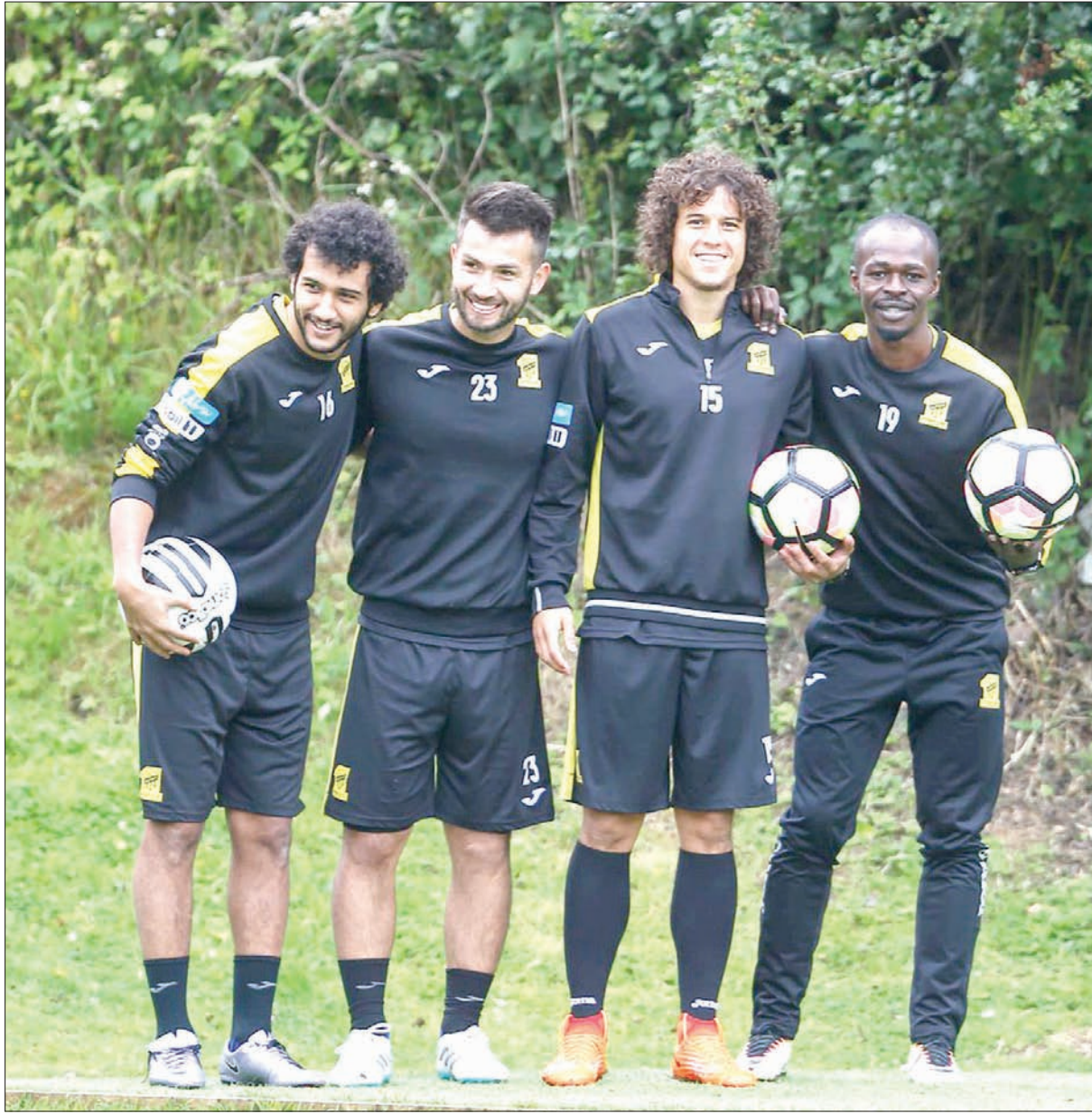
لاعب الاتحاد قبل التدريبات أمس

بينما قرر التشيلي سيريرا تكثيف الحصص التدريبية للاعبين خلال معسكر الفريق الخارجي المقام في بريطانيا، بهدف رفع معدّلهم اللياقية، باعتبارهم العنصر الأهم الذي يتطلب أن يكون اللاعبون عليه