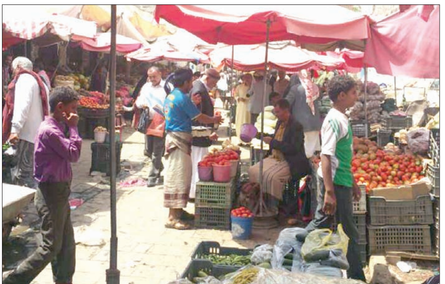
جانبا من سوق باب القاع وسط صنعاء، (الشرق الأوسط)