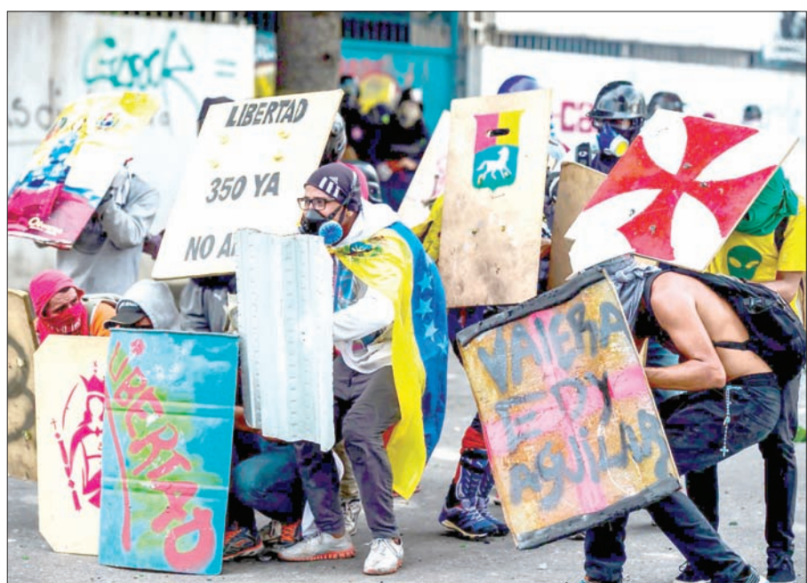
معارضون يصطدمون بقوات مكافحة الشغب في كراكاس أمس (أ.ب.أ)

الفرنزولية للتلقيين الحكومي أن الإضراب لم يؤثر على عملياتها. ولقي الإضراب دعم المنظمات الكبرى لأرباب العمل وقيادات العمل وعمل النقل. لكن الحكومة هي أكبر جهة تؤمن وظائف في البلاد، ويعمل فيها 3 ملايين شخص، كما أنها تسيطر على شركة النفط الذي يؤمن 96 في المائة من دخل فنزويلا. يقول لويس فيسنتي ليون، من معهد «داتاناليسيس»، إن «إضراباً في بلد نفطي تسيطر فيه الدولة على القطاع النفطي، يشكل اختبار قوة ماليًا بين أرباب العمل والسكان الذين يعانون من الفقر والجوع من جهة، وحكومة تكاد تنهار من جهة أخرى، لكنها لا تزال تسيطر على الموارد الشحيحة للبلاد».