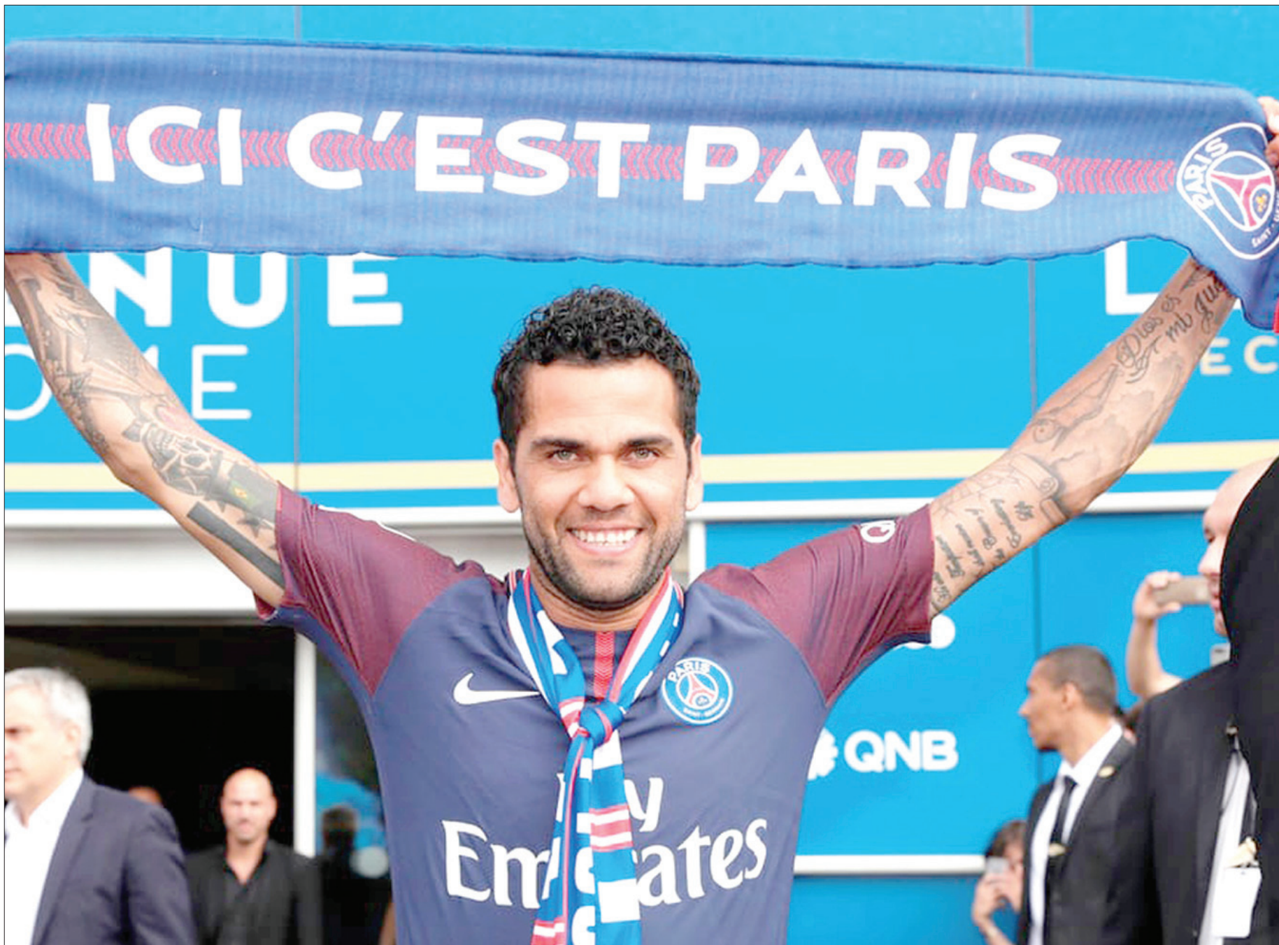
ألفيس خيب آمال غوارديولا وترك سيتي يدفع 50 مليون إسترليني لضم ووكر والتحق بسان جيرمان

وانفصل بونوتشي عن زميله في يوفنتوس أندريا بارزالي وجورجيو كيليني، حيث لعب الثلاثي في دفاع بطل إيطاليا منذ 2010، وساعدوا الفريق في الفوز باللقب في آخر 6 مواسم. وتأهل يوفنتوس أيضاً إلى نهائي دوري أبطال أوروبا مرتين في آخر 3 مواسم، وخسر في المراتب أمام برشلونة وديال مدريد على الترتيب.