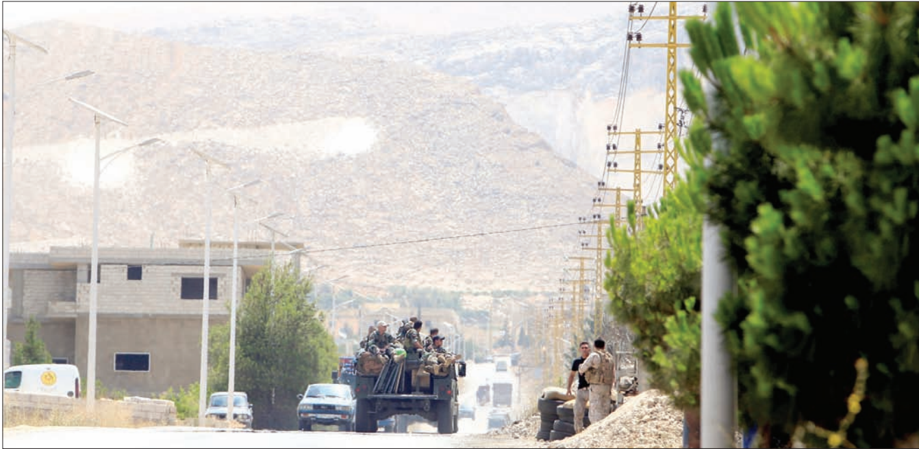
دورية للجيش اللبناني في مدخل بلدة عرسال أمس

انضمام تنظيم داعش، بقيادة موفق الجبراني، الملقب بـ«موفق أبو السوس» للقتال إلى جانب عناصر «جبهة النصرة» في المعركة، قبل أن يعلن الإعلام الحربي «السيطرة على (سهل الرهوة) وموقع (ضهر الهوة)، واصفاً بإهانه أهم المواقع في جرد عرسال».