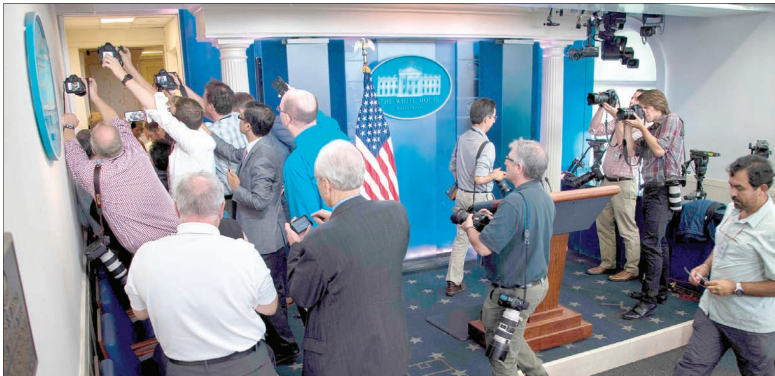
صحافيون ينتظرون خارج قاعة المؤتمرات الصحافية بالبيت الأبيض بواشنطن أمس

عن فرجينيا أن «احتمال تفكير الرئيس في إصدار عفو في هذه المرحلة المبكرة من التحقيقات الحالية أمر يثير القلق الشديد». وشدد على أن «العفو عن أفراد مشهورين بشكل تجاوزاً لخط أساسى»، ولم يصدر أى تعليق من البيت الأبيض حول مقال «واشنطن بوست»، حتى وقت كتابة هذه السطور.