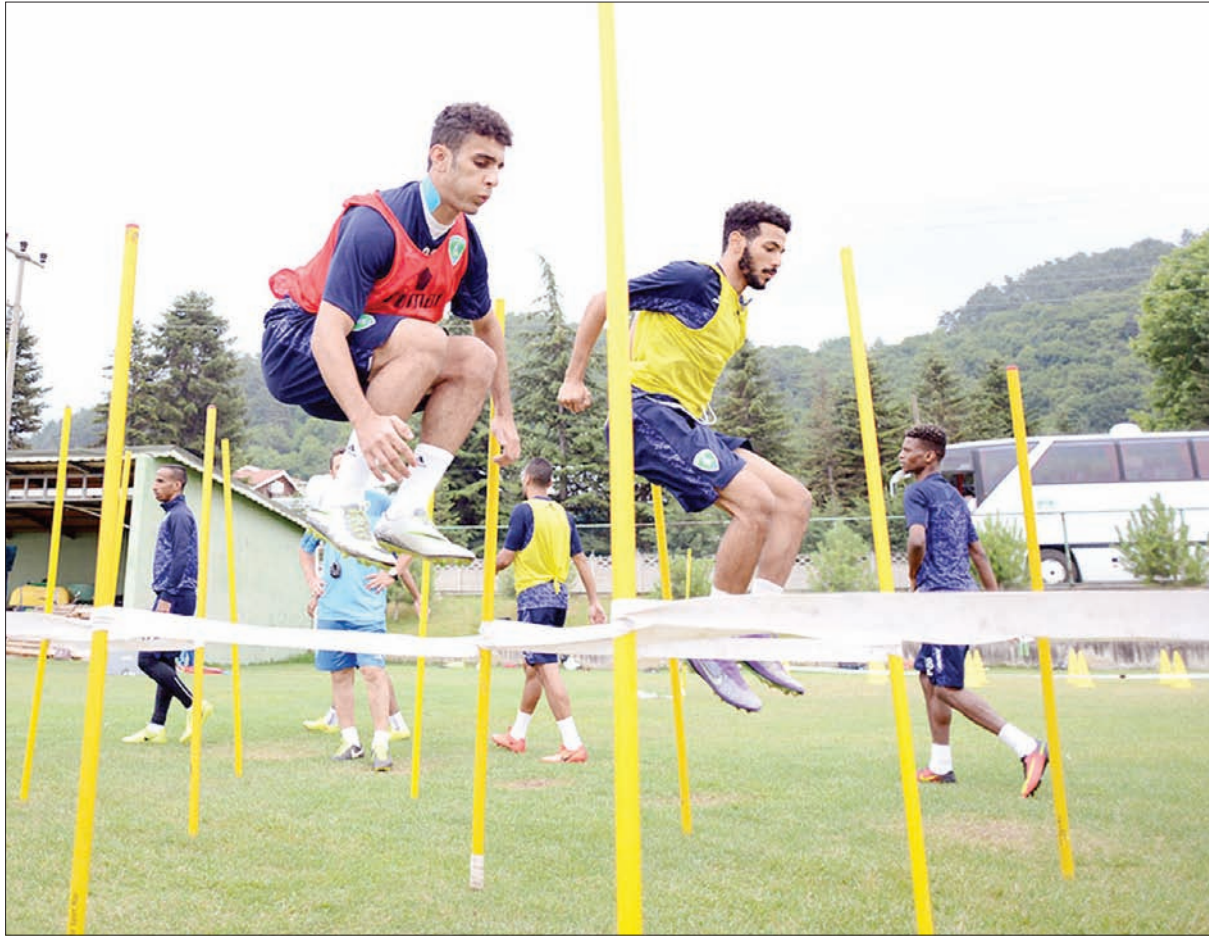
من استعدادات الفتح للموسم الجديد

للأندية لم تصرف من قبل اتحاد الكرة، تتعلق بحقوق النقل التلفزيوني، وبقبة الرعاة للدوري، مشيراً إلى أن نهاية العقد مع الراعي الرسمي للنادي أخيراً رفع حجم الضغوط المالية، رغم أن مبلغ الرعاية مع الراعي الرئيسي