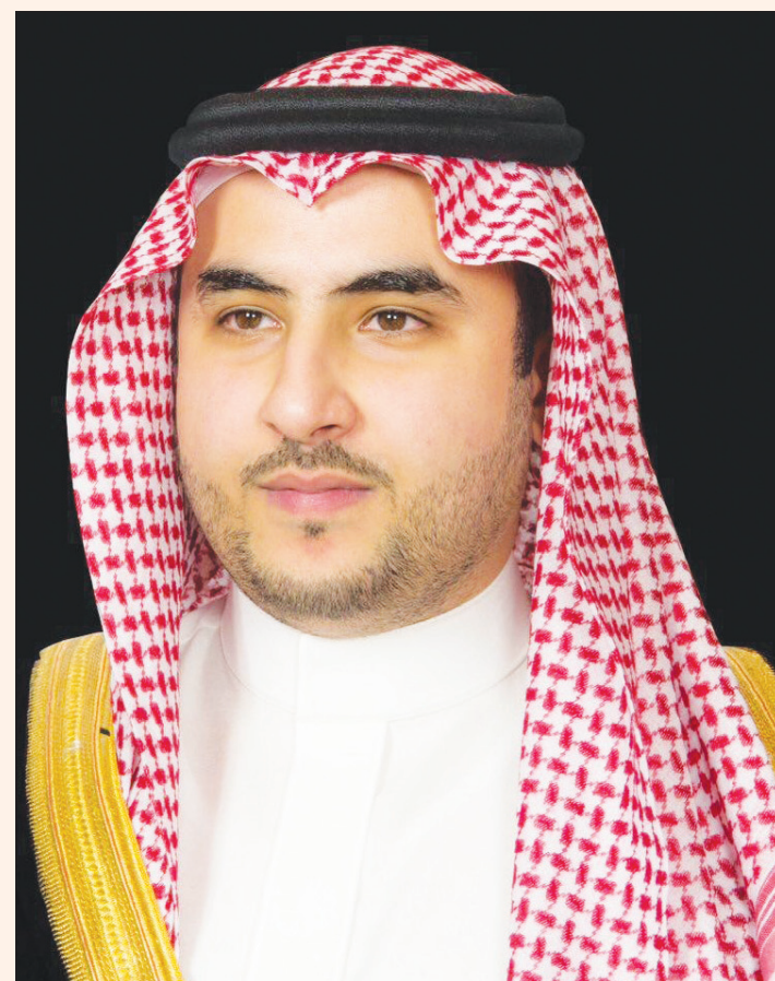
الأمير خالد بن سلمان