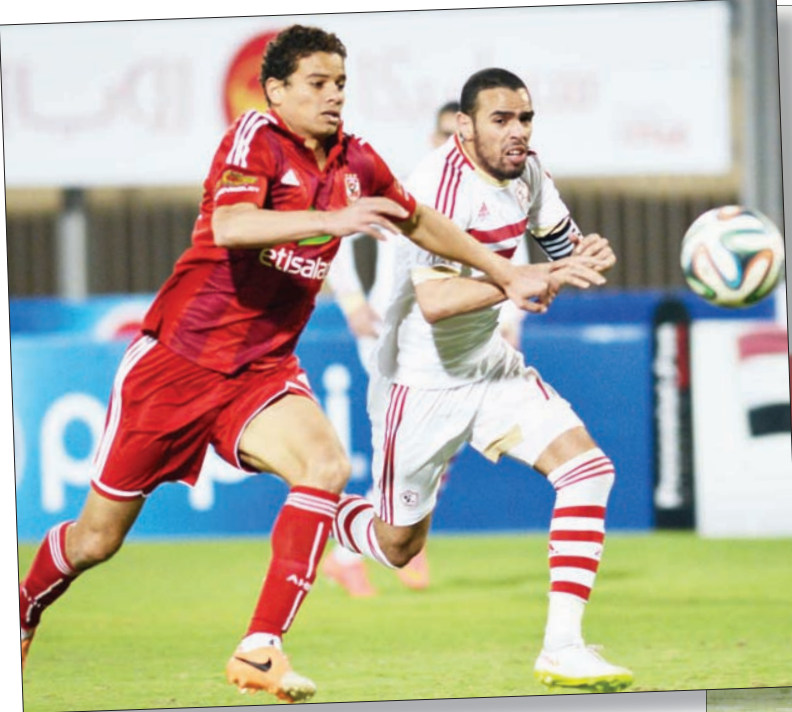
الأهلي المصري يدخل البطولة منتشياً بلقب الدوري المحلي

ويسعى المدرب الأرجنتيني للاستفادة من اللاعبين الشبان للانضمام للفريق الأول. ويبدأ الهلال مشواره في البطولة، التي احزن لقبها مرتين في 1994 و1995، بمواجهة المريخ السوداني، الاثنين المقبل.