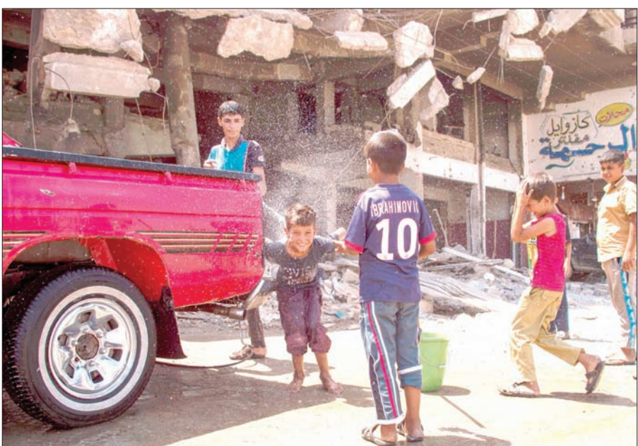
أطفال يلعبون بغسل سيارة في غرب مدينة الموصل أول من أمس

«يونسيف» تحذّر من «ثمن باهظ» دفعه الأطفال جراء «أهوال الموصل»