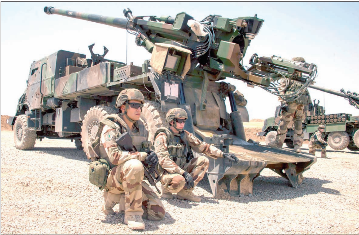
جنود فرنسيون يساندون قوات الجيش العراقي في المعارك ضد «داعش» قرب الموصل