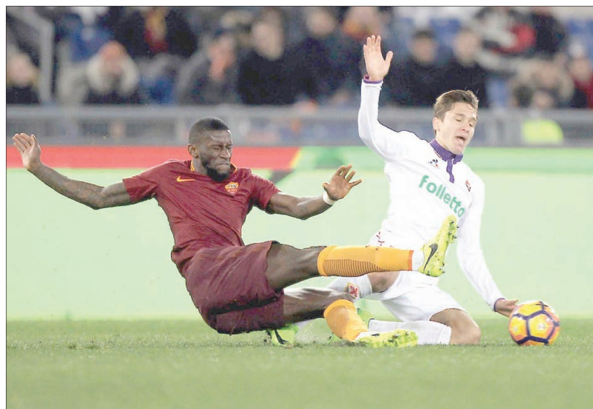
روديجر (يسار) أكثر لاعبي روما تعرضاً لعقوبات الحكام بسبب أسلوب لعبه الخشن

بونوتشي، ومؤخراً ديفيد لويز. بالنسبة لروديجر، فإنه يحمل إمكانات تؤهله لتحقيق تطور مشابه تحت قيادة، لكنه يبقى مخاطرة مرتفعة التكلفة بالنسبة للاعب لا يبدو تشيلسي في حاجة ماسة له. والملاحظ أن اللاعب يملك إمكانات بدنية تؤهله للنجاح داخل إنجلترا، لكن ثمة علامات استفهام تدور حول توقيت المراوغة لديه. تشير الأرقام إلى أنه ارتكب أربع مخالفات في المباراة الواحدة خلال المراوغة الموسم الماضي. كما أنه أكثر لاعبي روما تعرضاً لعقوبات الحكام، الأمر الذي يبدو ظاهرة نادرة الحدوث بالنسبة لمدافع في نادٍ من الأندية الكبرى. وخلال 26 مباراة بالدوري الممتاز شارك بها، حصل اللاعب على سبع بطاقات صفراء وواحدة حمراء، بجانب طرده من بطولة الدوري الأوروبي. وعلى مدار الموسم الماضي، ارتكب روديجر عدداً أكبر من الأخطاء الفردية تسببت في تمكن لاعب خصم من التصويب على المرمى أو تسجيل هدف، أكثر عن أي من لاعبي روما الآخرين (6).