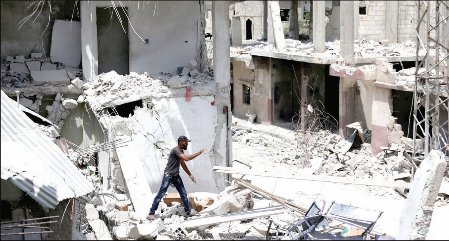
يبحث عن مقتنيات بين أنقاض مبنى مدمر في درعا