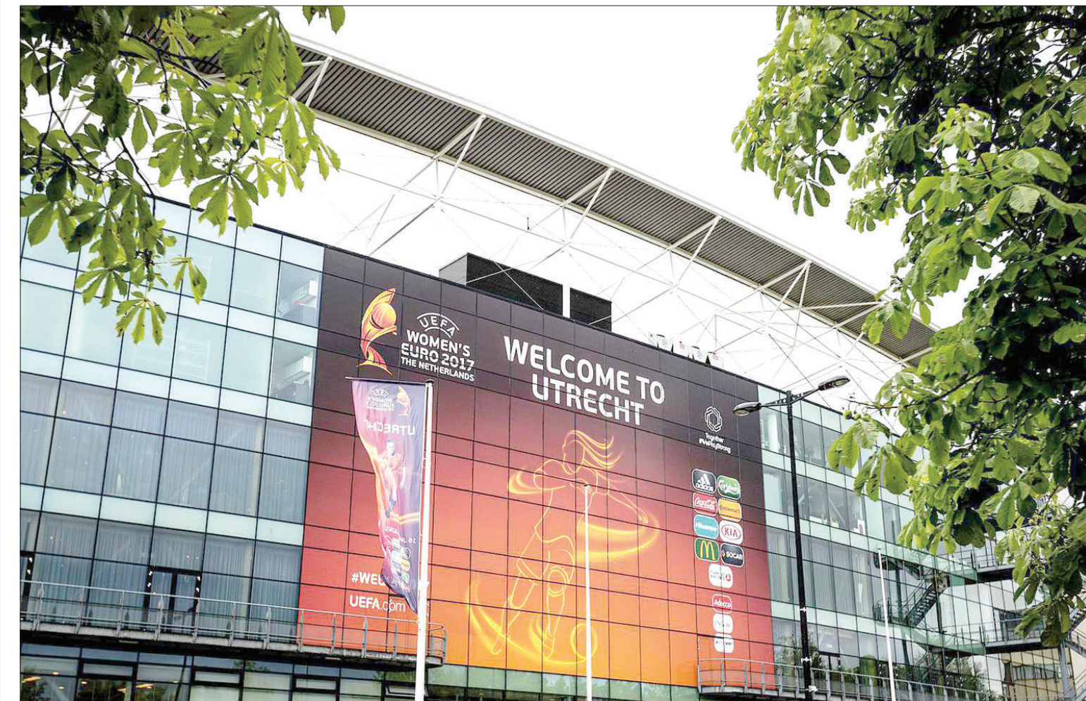
صورة للاستاد المقرر استضافته مباراة إنجلترا وهولندا ضمن بطولة أوروبا لكرة القدم للسيدات وكانت ضمن مخطط إرهابي لـ«داعش»

وأشارت «إذاعة كندا» إلى أن الموقع الإلكتروني لشرطة الجمارك وحماية الحدود الأميركية، يقول إن الذي يحمل البطاقة «يجب الانتظار الطويل على الحدود الكندية الأميركية، ويتمتع بمعاملة سريعة في النقاط الجمركية والمطارات التي تقبل التعامل بالبطاقة». في ناحية أخرى، أوردت أمس وكالة «أسوشيتد برس» رفض جيف سينيغ، عمدة طالكاسا (قرب ديترويت، ولاية ميتشيسغان) الاعتذار عن كتاباته في صفحته في موقع «فيسبوك»، والتي دعا فيها إلى قتل المسلمين «حتى آخر مسلم».