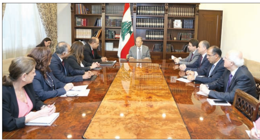
الرئيس اللبناني ميشال عون استقبل أمس مدير قسم الشرق الأوسط في البنك الدولي (الاتي ونهرا)

البنك لديه مشاريع مبتكرة تدخل في سياق أولوياته، إضافة إلى تطوير البنى التحتية». وتزامن إعلان عون عن اقتراب لبنان من إطلاق «خطة