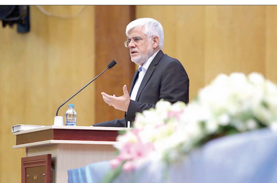
رئيس كتلة «الأمم» البرلمانية محمد رضا عارف خلال مؤتمر للتيارات الإصلاحية في طهران أمس

«البعض ينتصر لكنه ينسى من تعبوا من أجله وأنا معاتب على هذا الأمر».