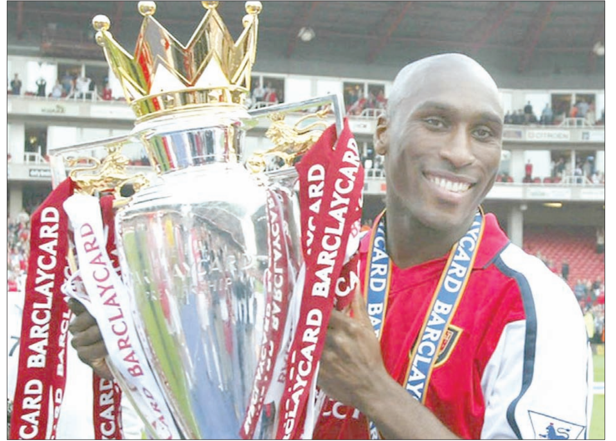
كامبل حصد مع أرسنال الكثير من الألقاب («الشرق الأوسط»)