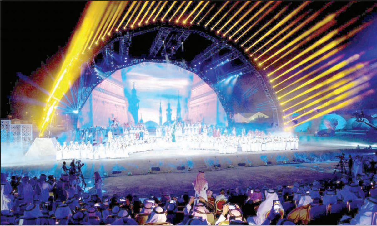
تحت رعاية خادم الحرمين الشريفين... أمير منطقة مكة المكرمة يفتتح الدورة الـ 11 لسوق عكاظ (واس)