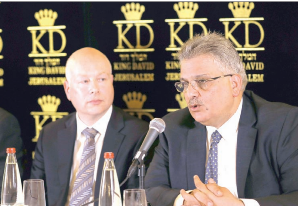
مارزن غنيم رئيس سلطة المياه الفلسطينية يتحدث في مؤتمر صحفي بالقدس وإلى جانبه المبعوث الأميركي غرينبلات والوزير الإسرائيلي تسمي هانغبي

وقال رئيس سلطة المياه الفلسطينية سارن غنيم إنه «بعد نقاشات طويلة استمرت لأكثر من عام ونصف العام، مع الجانب الإسرائيلي، توصلنا إلى توافق مبدئي يقوم على الحصة الفلسطينية بما مجموعه 32 مليون متر مكعب سنوياً من المياه على حصة مائة من هذا المشروع لا يوجد له أي انعكاسات على مناطق الضفة الغربية وقطاع غزة التي تأتي تحت حكم كبير في مصادر مياه الشرب خلال السنوات الماضية. وأوضح أن تنفيذ المراحل اللاحقة من المشروع ضمن للفلسطينيين مكاسب إضافية حال تنفيذه. يذكر أن الأردن أولى اهتماماً كبيراً بتنفيذ المشروع الذي سيكون إحدى أهم ركائز الاستراتيجية المائية الأردنية، والذي سيوزع الأردن بمياه الشرب لسنوات طويلة مقبلة بالإضافة إلى المحافظة على بيئة البحر الميت الذي يعتبر إرثاً تاريخياً ومورداً اقتصادياً هاماً للأردن.