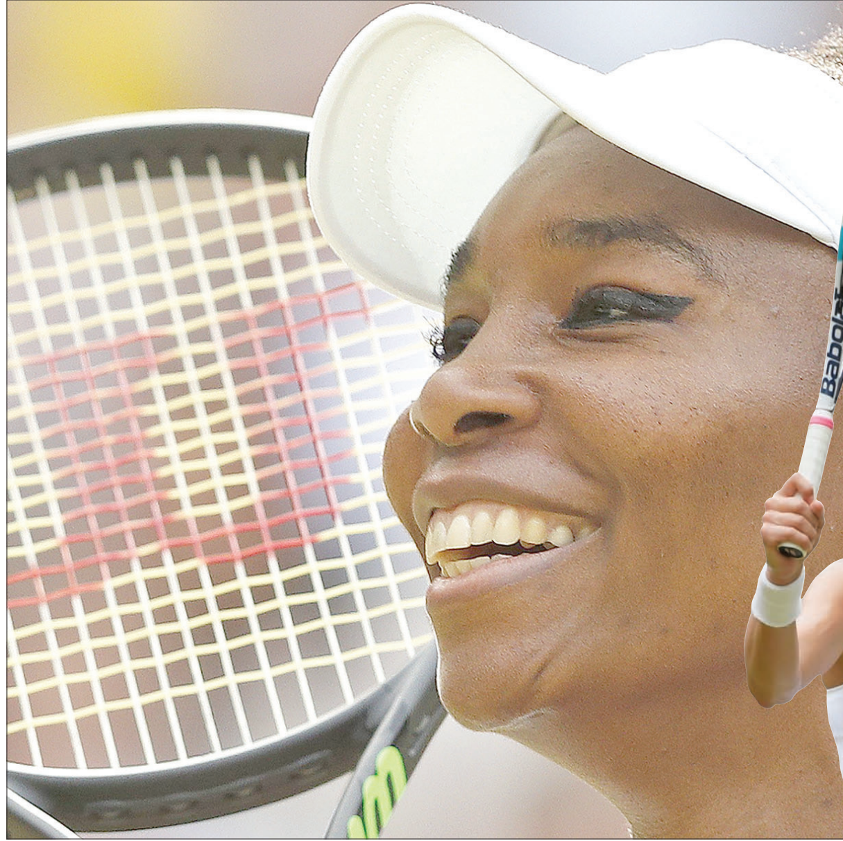
فينوس نجحت في إقصاء البريطانية كونتا (رويترز)

وقالت الإسبانية بعد الفوز أمس: «العبت بشكل جيد بالتأكيد. دخلت الملعب، وأنا...» وموعوروزا تحتفل بتأملها للنهائي (رويترز)