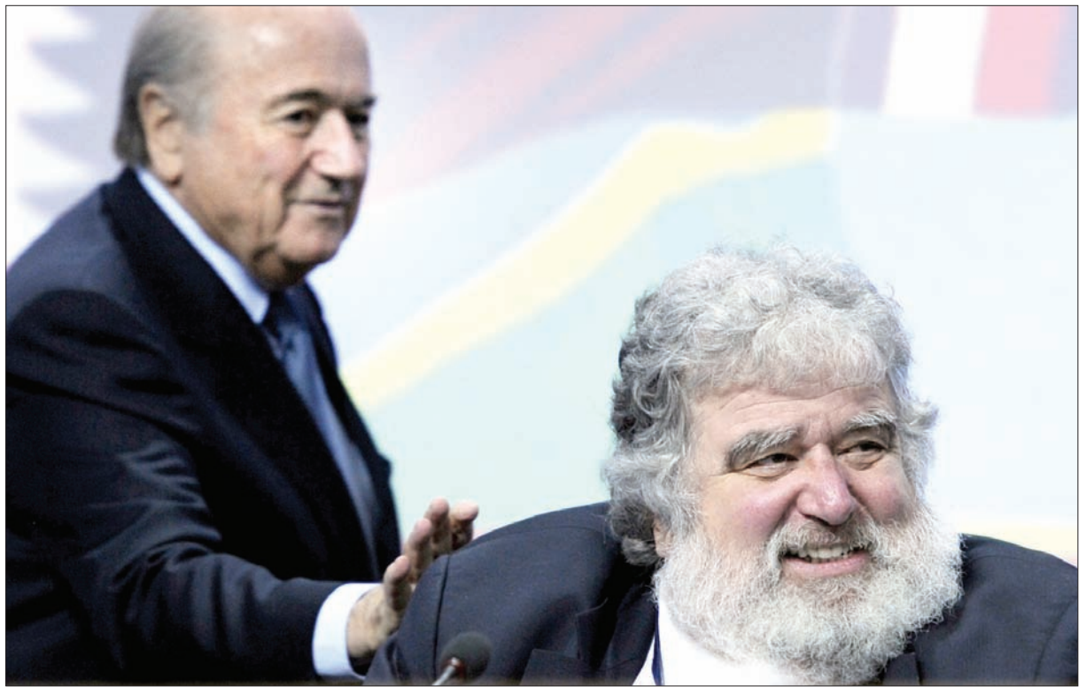
بلايزر المدعوم من بلاتر كشف فساد الفيفا

ذي الشعر الأبيض والحيحة الطويلة الكثة، أفضل في تعزيز اللعبة في القارة الأميركية رغم أنه لم ير كل كرة في حياته. إلا أن حظه بدأ ينفذ في الأعمار الأخيرة، لا سيما مع مفاخرته بأسلوب حياته الباذخ، وأطلق مدونة خصصها لسرد رحلاته وإجازاته حول العالم وصوره مع المشاهير والسياسيين، من أمثال الرئيس الروسي فلاديمير بوتين وملكات الجمال. من الأسباب التي أدت إلى انكشاف فساد ومحاولاته لإخفاء مستوى دخله الحقيقي، فشله في تقديم عائداته الضريبية بين 2005 و2010. وبحسب التقارير، أوقف بلايزر من قبل عنصر في مكتب التحقيقات الفيدرالي وآخر من سلطات الضرائب الأميركية عام 2011، وهو في طريقه إلى نيويورك الأميركية. ويروي أن العنصرين قالوا له: «يمكننا أن نوقف مكتبك البيزنسي، أو يمكنك أن تتعاون معنا».