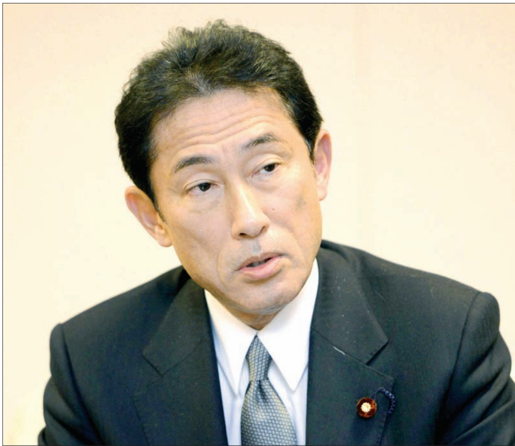
فوميو كيشيدا (الشرق الأوسط)

ونوه كيشيدا في حديث صحفي في طوكيو بـ «إعلان تحرير الموصل واقترب تحرير الرقة» من تنظيم «داعش»، لافتاً إلى أن «الأزمات الإنسانية، ستستمر حتى ما بعد تحرير المدينتين لأسباب عدة بينها «خروج عدد هائل من سكان تلك المناطق». وقال: «من المتوقع أن تستمر